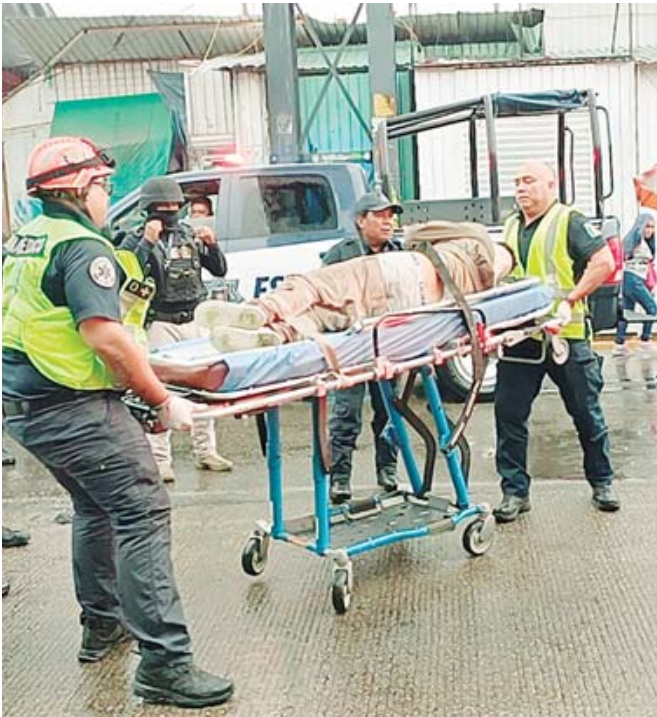
Los cuerpos de emergencia acudieron al lugar para brindar los primeros.