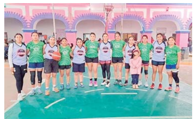
El equipo de Itundujía, conocido por su espíritu competitivo y camaradería, está devastado por la pérdida de sus compañeras.

Este accidente ha dejado una huella indeleble en el básquetbol femenino de Oaxaca, en tanto, las auto-