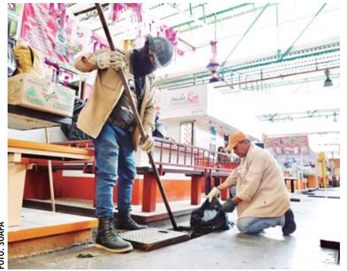
Personal de Soapa desazolva el drenaje del mercado 20 de noviembre.

"Necesitamos ver si ese voto diferenciado se dio de manera legal y legítima, lo que también pedimos es que se respeten los votos de la gente y los procedimientos legales, cuando se agoten todas las instancias respetaremos el fallo", apuntó.