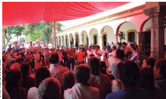
Asamblea comunitaria en Tlacolula de Matamoros.

principal de la población en donde se aprobó un punto de acuerdo en el cual se cancelan cualquier permiso que se haya otorgado en administraciones anteriores sobre la edificación de fraccionamientos.