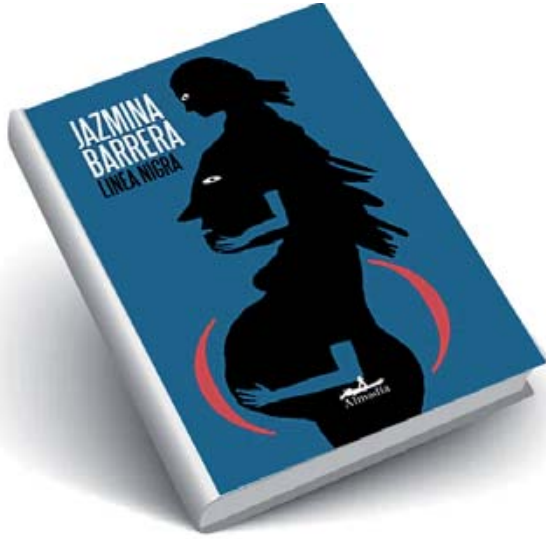
■ Línea negra.