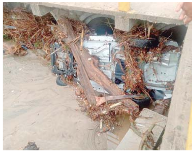
En el arroyo El Regadío, dos vehículos fueron arrastrados por la corriente.

Derivado de las intensas lluvias, se registró la caída de árboles y encharcamientos en varias zonas costeras. Un incidente significativo ocurrió en el arroyo