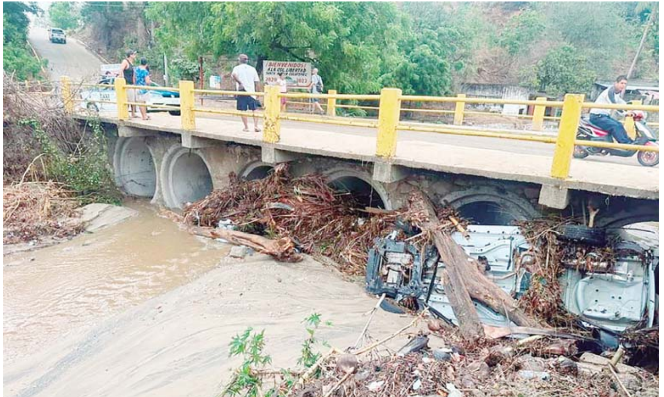
Un automóvil fue arrastrado por las fuertes lluvias, quedando atorado en el puente.

Las autoridades policíacas señalaron que el hombre es vecino de la colonia Jardín.