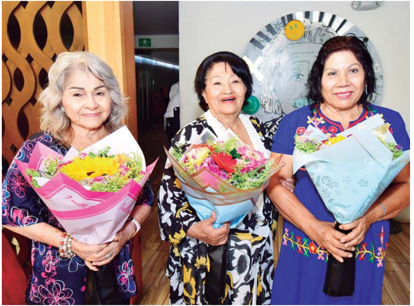
Las tres bellas damas recibieron un hermoso ramo de flores, con el cual posaron para la lente de Estilo.