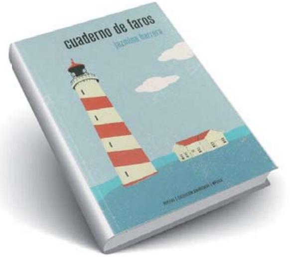
■ Cuaderno de faros.