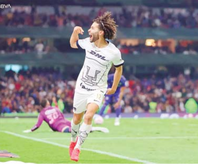
■ Lema asegura que el Chino ha tenido varias ofertas muy importantes.