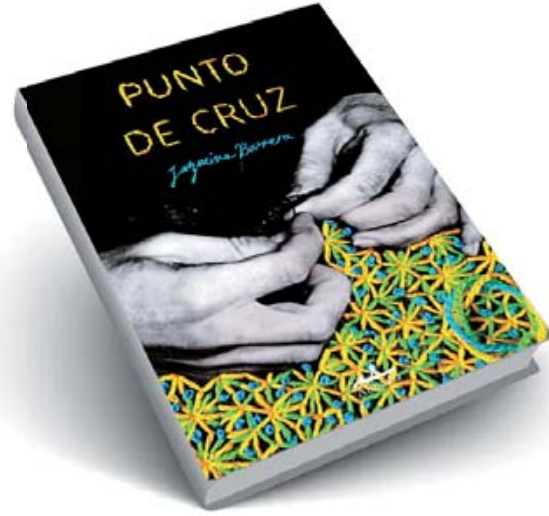
■ Punto de cruz.