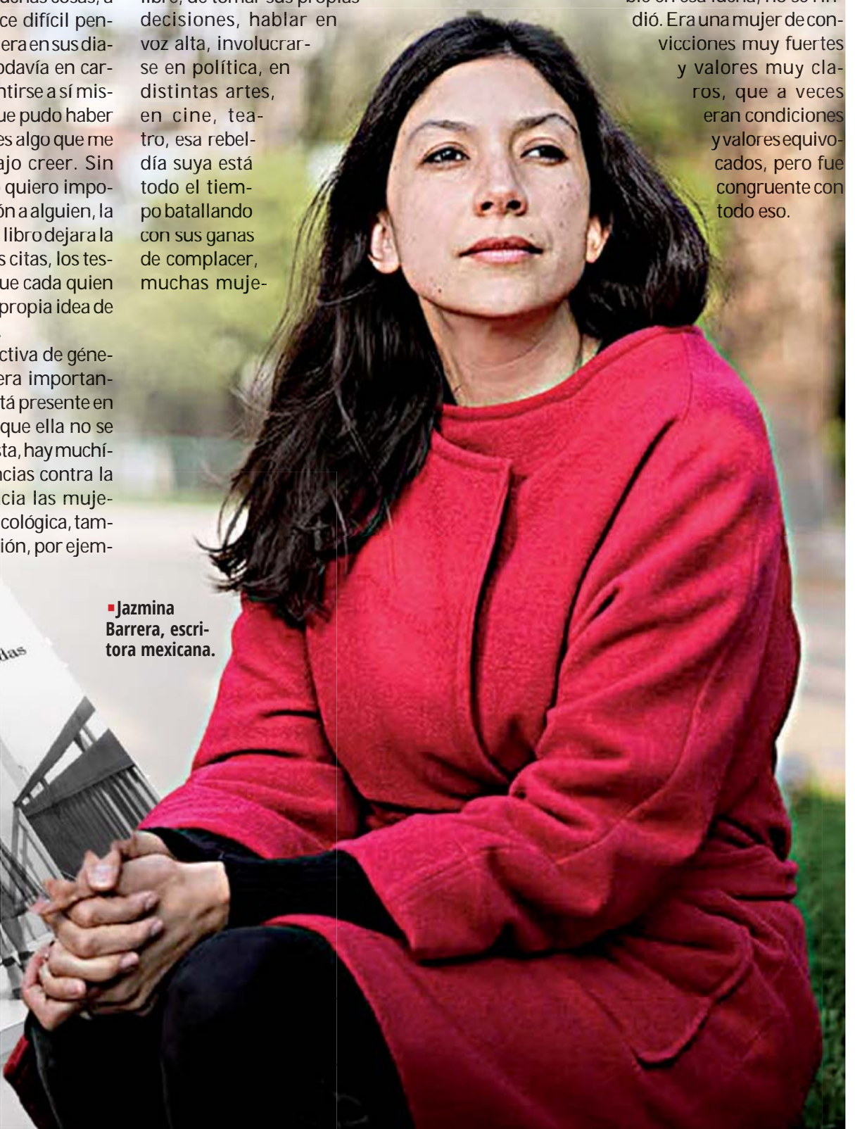
■ Jazmina Barrera, escritora mexicana.