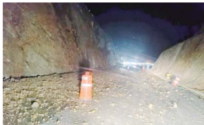
Los caminos de la Costa se vieron afectados por la caída de rocas y árboles.

El Regadío, en la colonia La Libertad de Puerto Escondido, donde dos vehículos fueron arrastrados por la corriente. Afortunadamente, uno de los vehículos no tenía personas a bordo, mientras que el otro, conducido por un hombre, fue recuperado junto con su conductor de manera inmediata.