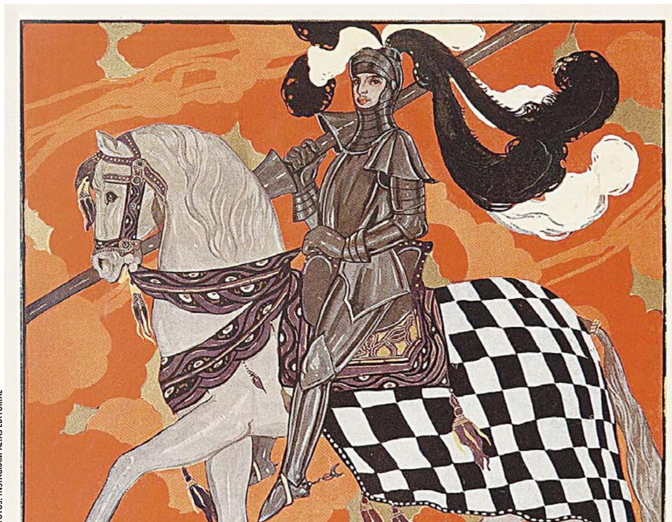
■ Las bellísimas ilustraciones originales corrieron a cargo de Roberto Montenegro y Gabriel Fernández Ledesma.