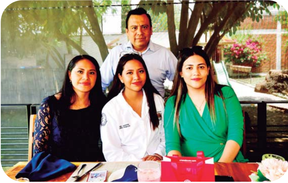
■ Sus padres y su madrina la acompañaron en este logro profesional; se mostraron muy orgullosos de ella.