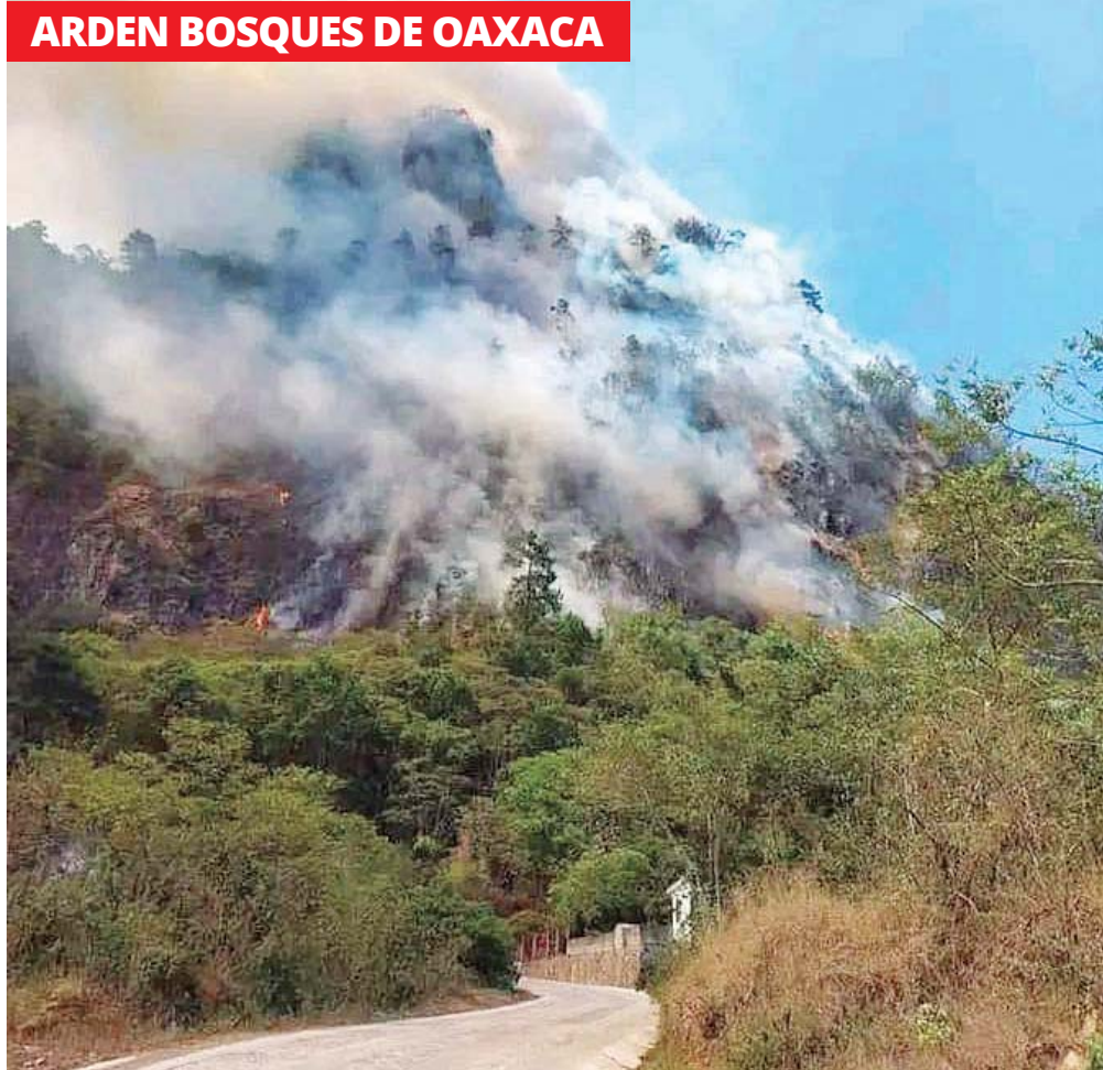
Al menos cuatro incendios arrasan con los bosques de Huautla de Jiménez y San José Tenango, en la Sierra Mazateca. Claman ayuda al Gobierno del Estado.

y dos reactivados en todo el territorio; entre los incendios activos estaba el de Tepelmeme Villa de Morelos con 33 días de duración y con un aproximado de 3 mil 400 hectáreas afectadas.