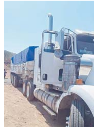
Estos sujetos trabajaban en cambiar la carga de vehículo.

Cuando los elementos de la AEI se aproximaron, fueron agredidos con disparos de arma de fuego, sin que resultaran personas lesionadas, en cambio se logró