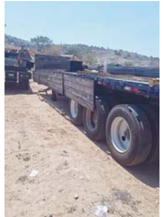
La policía aseguró un tractocamión, una camioneta y una retroexcavadora.

la detención de seis personas de sexo masculino.