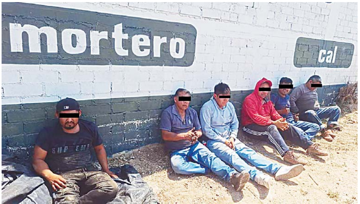
Los detenidos presuntamente pertenecen a de una banda dedicada al robo de vehículos.

Estas acciones forman parte del trabajo continuo que realiza la Fiscalía de Oaxaca para combatir la comisión de delitos de alto impacto en los Valles Centrales y garantizar la seguridad pública a favor de la ciudadanía.