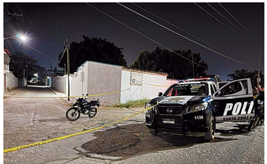
Las boletas fueron localizadas en la calle Camino al Mogote.