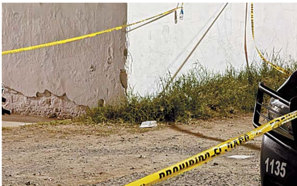
El descubrimiento de estas boletas se derivó de una denuncia recibida por la FGEO.