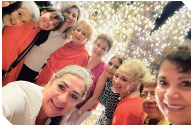
■ Ella y sus invitadas se mostraron divertidas al tomarse varias selfies.