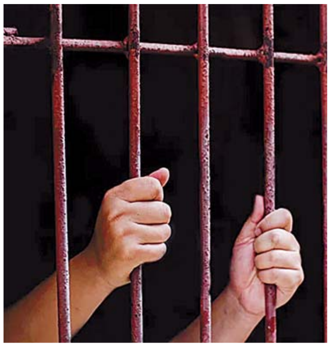
M.D.A.G. recibió la medida cautelar de prisión preventiva justificada.

La implementación de técnicas de investigación e inteligencia que realiza la Fiscalía de Oaxaca, contribuye a la efectividad en los resultados de los trabajos ministeriales a favor de las víctimas de delitos.