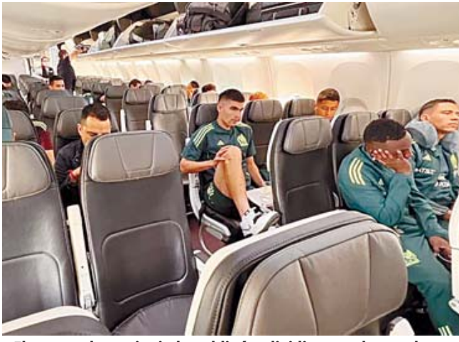
■ El exceso de equipaje los obligó a dividirse en dos vuelos distintos.