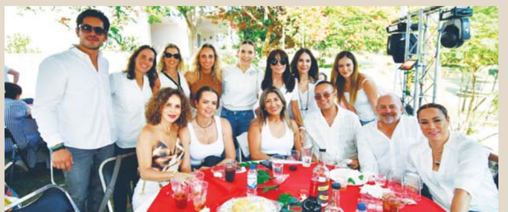
■ Con los amigos del pádel.