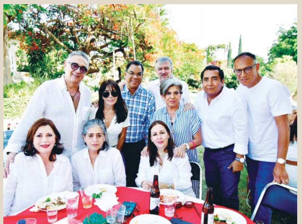
■ Se tomó fotos con todos sus invitados y convivió con cada uno de ellos.