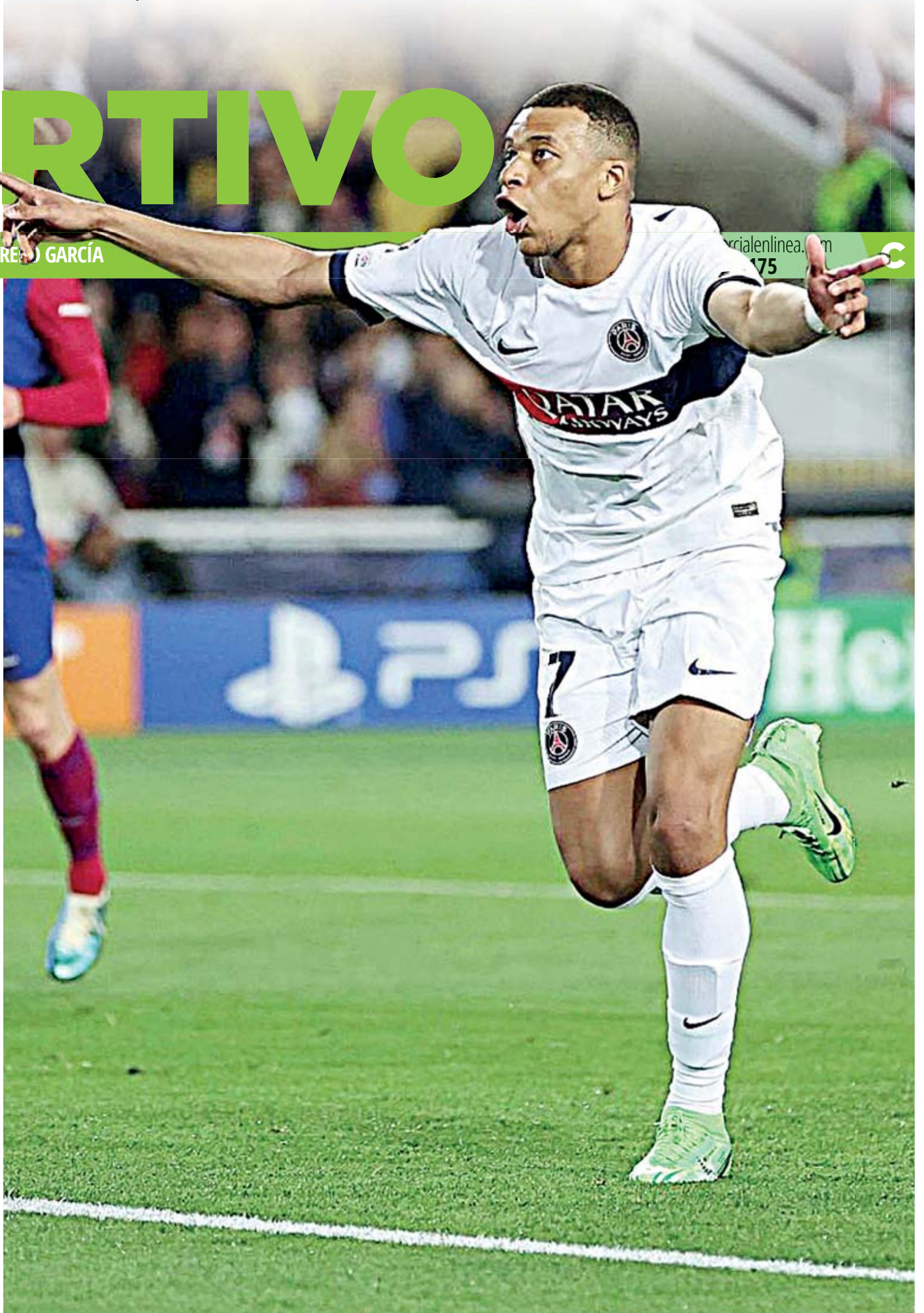
■ Considerado por muchos como el mejor jugador del mundo, el galo llegó a un acuerdo con el Real Madrid por cinco temporadas.

Editor: Diego MEJÍA ORTEGA/ Diseñador: Humberto GUERRERO GARCÍA