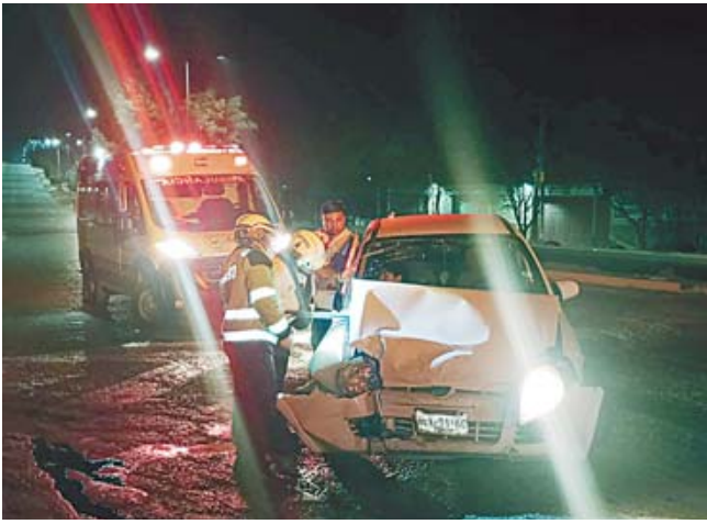
La colisión dejó lesionados a pasajeros del autobús y ocupantes del Chevy.