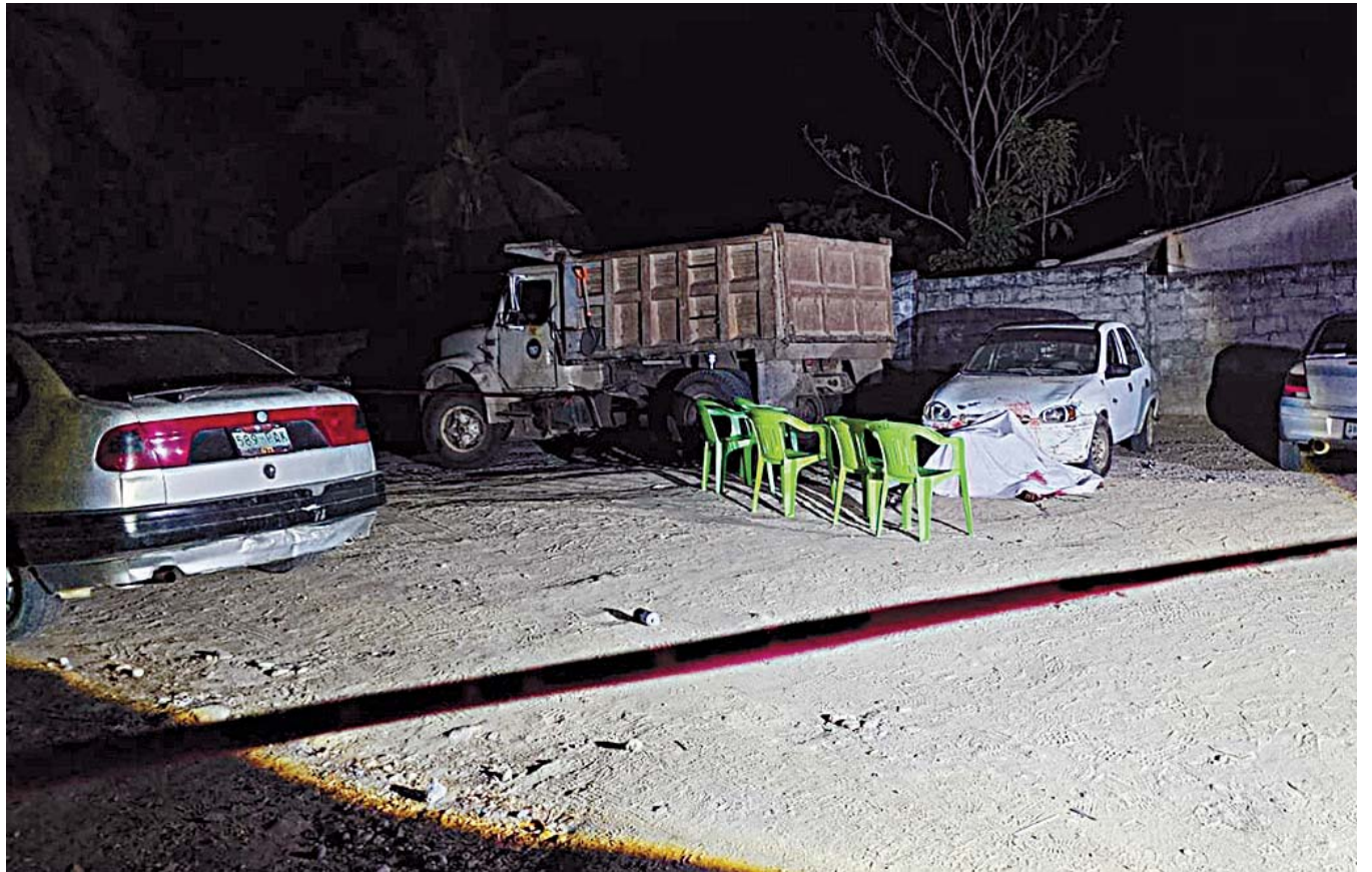
Al término de la jornada electoral, los agresores llegaron al domicilio ubicado en el Barrio Nuevo, donde dispararon en múltiples ocasiones.