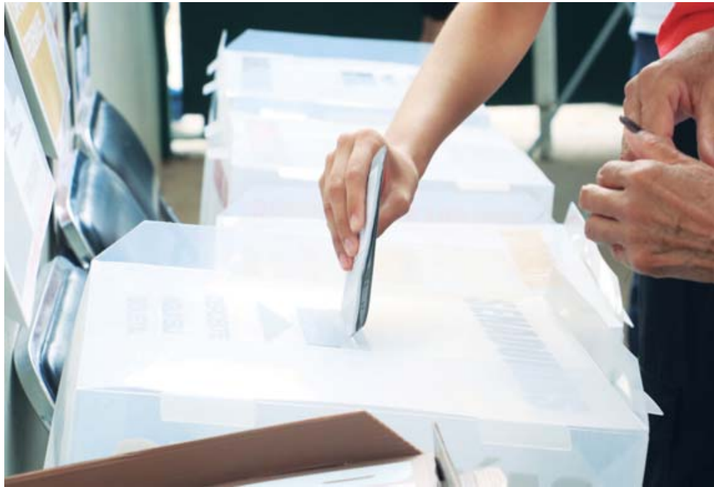
Con una histórica participación ciudadana de 64.26%, las y los candidatas de Morena ganaron en 50 municipios de la entidad.

Quien también se vería beneficiada con estos resultados, es la actual senadora Susana Harp, quien fue considerada en la lista de los plurinomi-