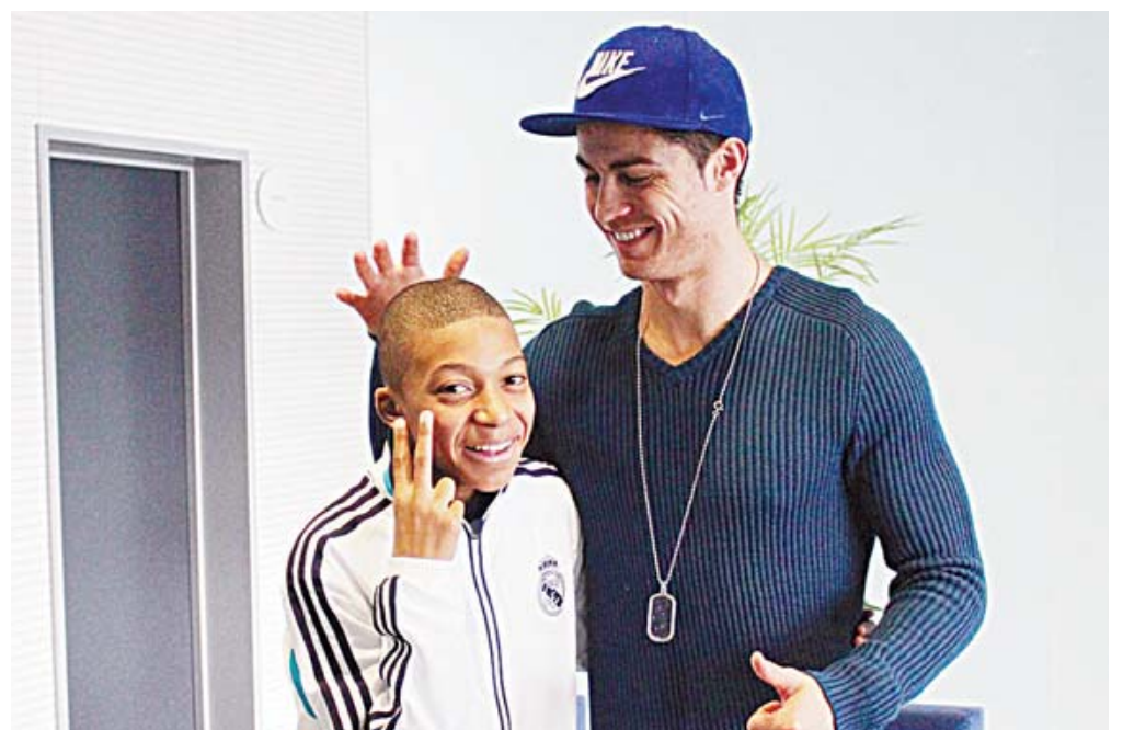
■ Mbappé acompañó su anuncio con una foto tomada en su infancia con su ídolo Cristiano Ronaldo.

A través de un comunicado, Real Madrid confirmó la noticia del traspaso de Kylian Mbappé, considerado por muchos como el mejor jugador del mundo en la actualidad. El galo era pretendido por el club español desde hace años e incluso presentó una oferta millonaria al PSG por sus servicios hace unas temporadas, pero el club francés la rechazó y ahora Kylian