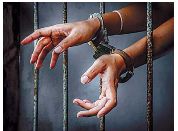
La Fiscalía determinó vincular a proceso a L.P.G. por violación equiparada.

De acuerdo con el expediente penal, la Fiscalía General del Estado de Oaxaca (FGEO) tomó conocimiento del caso y, a través de la Fiscalía Especializada para la Atención de Delitos Contra la Mujer por Razón de Género, inició las investigaciones