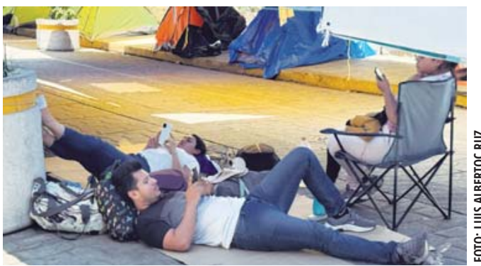
El plantón magisterial se mantiene en el Centro Histórico