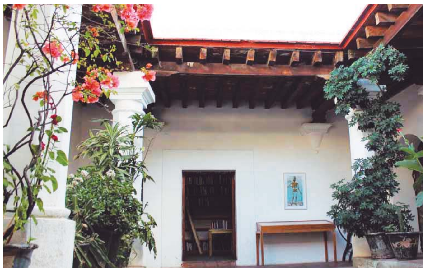
La muestra se llevará a cabo en la sede Juárez.