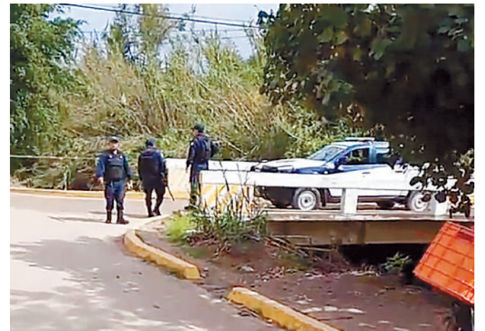
La rápida intervención de este familiar permitió detener al presunto agresor.

Un familiar del herido llegó justo a tiempo para desarmar al agresor y propinarle algunos golpes antes de que intentara huir del lugar. La rápida intervención de este familiar permitió detener al presunto agresor, quien se encon-