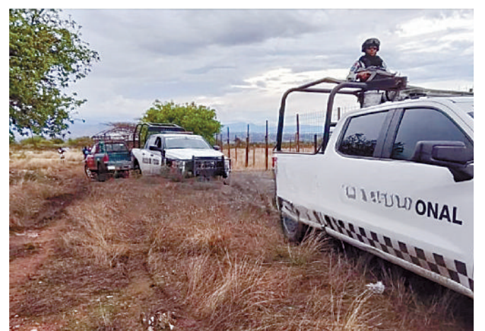
Hasta el momento se desconocen los motivos detrás del asesinato y no se reportan detenidos.

El cadáver fue trasladado al anfiteatro de Miahuatlán de Porfirio Díaz para realizarle la necropsia de ley. Hasta el momen-