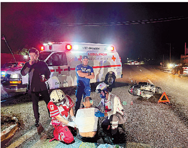
Derrapó sobre la vía federal 175 a la altura de los Tabachines.

Las autoridades locales están investigando ambos incidentes para esclarecer los ataques armados y dar con los responsables de estos actos violentos.