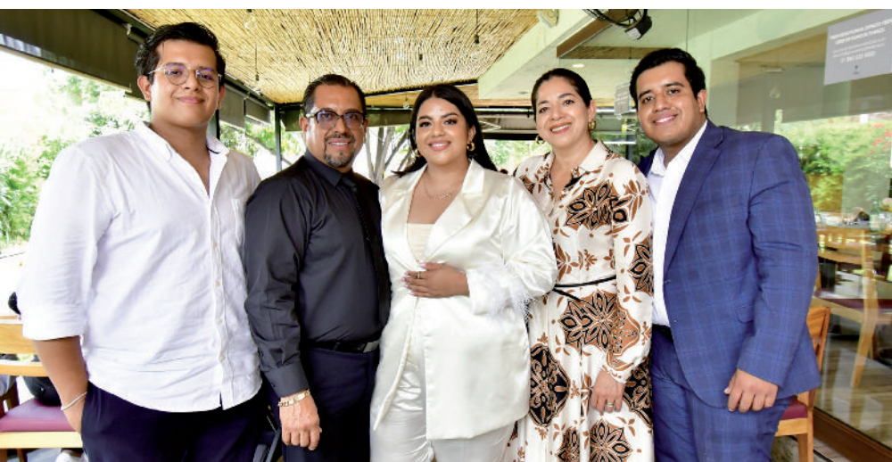
La joven escuchó los mejores deseos de sus padres y sus hermanos.

por esta fecha no pudieron faltar, y tanto la familia de la joven como sus amigos le desearon el mayor de los éxitos en la nueva etapa profesional que está por comenzar. ¡Enhorabuena!