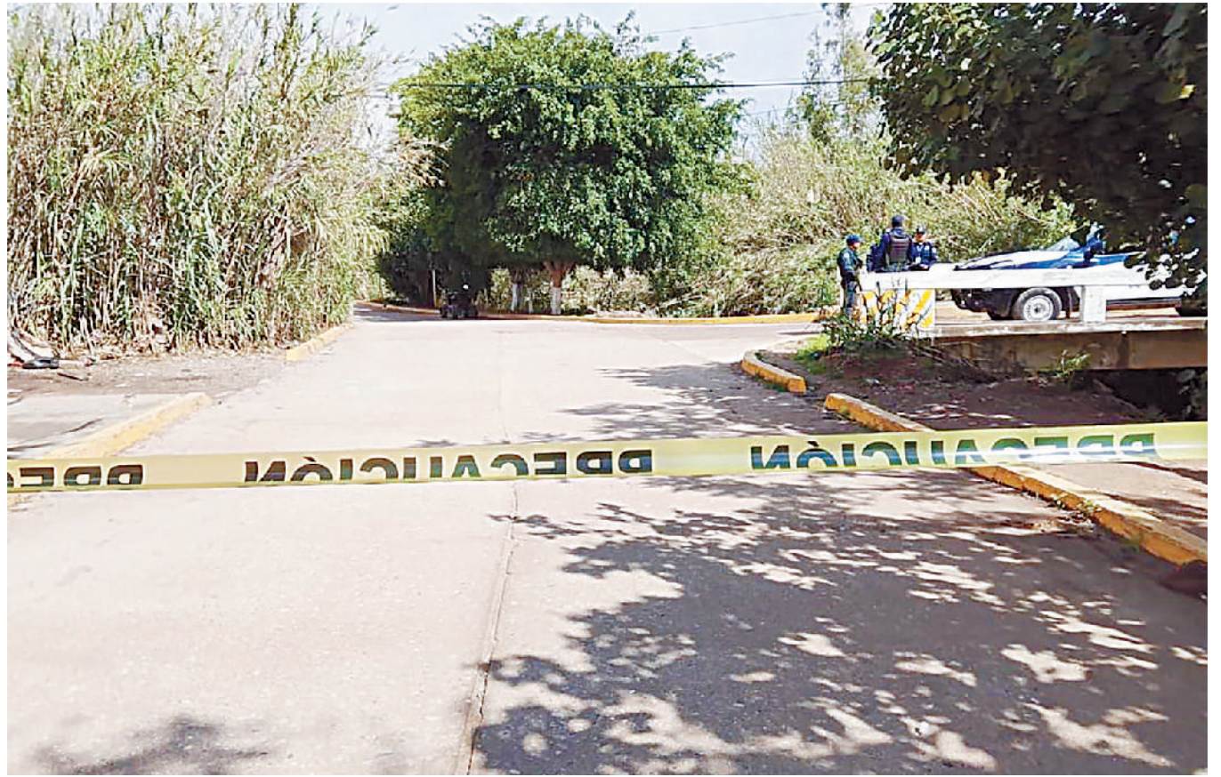
El presunto agresor fue golpeado por un familiar de la persona baleada y también resultó lesionado.

Hasta el momento, no se han proporcionado más detalles sobre las causas exactas del accidente ni el estado actual de salud del motociclista. Se espera que las autoridades continúen investigando para esclarecer el accidente.