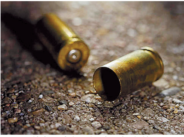
Las autoridades están investigando ambos incidentes para esclarecer los ataques.