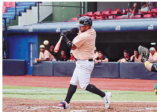
Quedaron empatados en el parque Lic. Eduardo Vasconcelos.