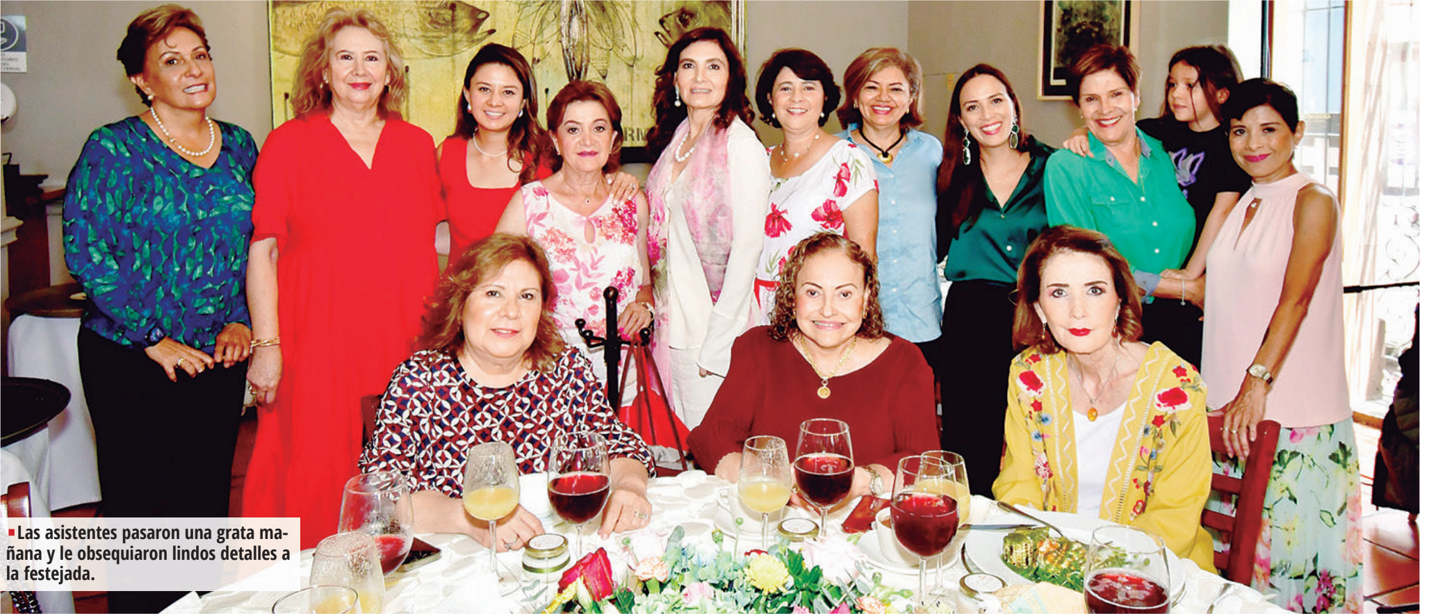
Las asistentes pasaron una grata mañana y le obsequiaron lindos detalles a la festejada.

Son ricas en antioxidantes, con buen aporte de fibra, contienen vitamina C y minerales como el potasio, cobre, hierro, calcio, fósforo, magnesio, manganeso, azufre y selenio. Gracias a su rica variedad en nutrientes tienen aportes múltiples beneficios para nuestra salud.