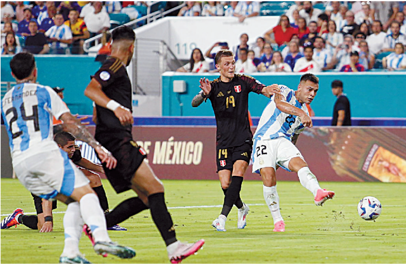
El doblete de Lautaro estuvo envuelto en polémica.

ALEMANIA SE APUNTA A CUARTOS Los germanos doblegaron a los daneses para avanzar a los Cuartos de Final de la Eurocopa 2024. INFORMACIÓN 4C