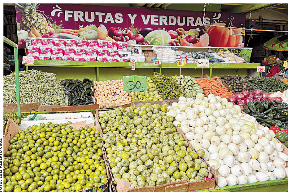
La carestía en frutas y verduras impulsan la inflación a 4.78% en la primera quincena de junio, a nivel nacional.

dedores del Mercado de Abasto, expusieron que dichos productos presentan variaciones a la alza en esta temporada de precipitaciones pluviales, dado que son muy delicados y se afectan rápidamente.