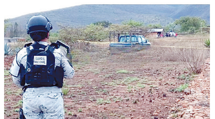
La víctima, de aproximadamente 43 años, se encontraba tirada entre la maleza.

to se desconocen los motivos detrás del asesinato y no se reportan detenidos.