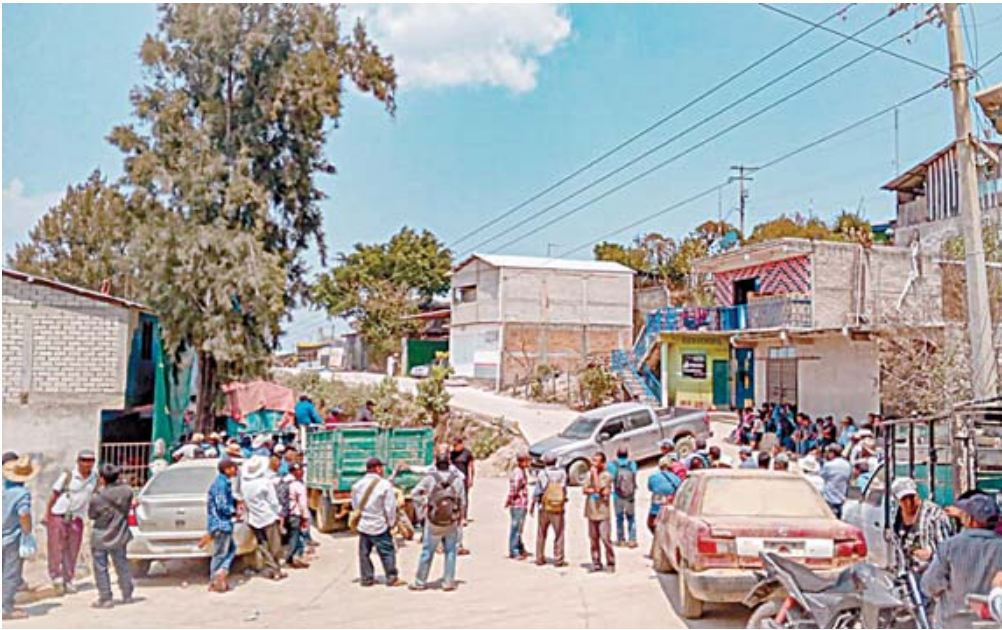
Se sospecha que este ataque se habría cometido debido a un operativo de decomiso de armas.