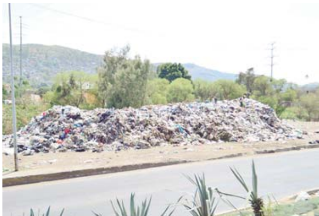
■ La crisis de basura ha dejado un boquete presupuestario al municipio.

de armamento, capacitación y obtención de vehículos, también se han creado comisiones auxiliares de seguridad en las colonias y así reforzar la seguridad junto con la policía.