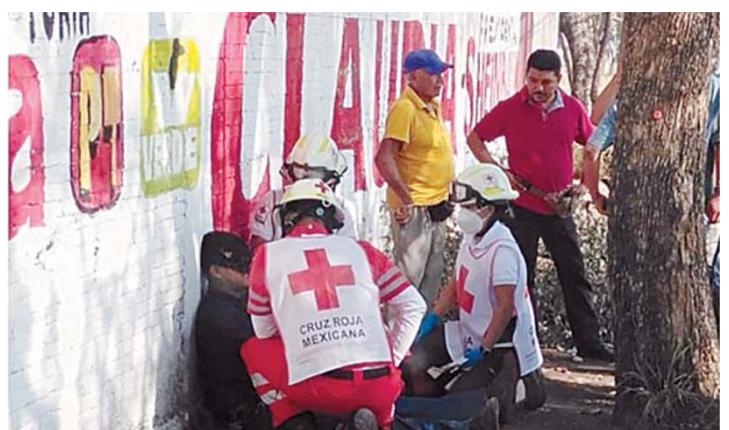
Afortunadamente, el motociclista de 25 años no ameritaba traslado a un hospital.

Las autoridades hicieron un llamado a todos los conductores para que extremen precauciones