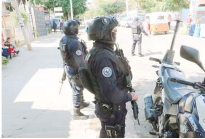
■ Rezago en equipamiento policiaco al destinar recursos hacia otras prioridades.

A decir de la concejal, aunado a la compra