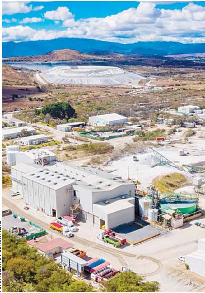
La mina San José opera desde el 2011 en el municipio de San José del Progreso, en Ocotlán.

“La Compañía Minera Cuzcatlán en el mayor empleador en la región de los Valles Centrales de Oaxaca, también