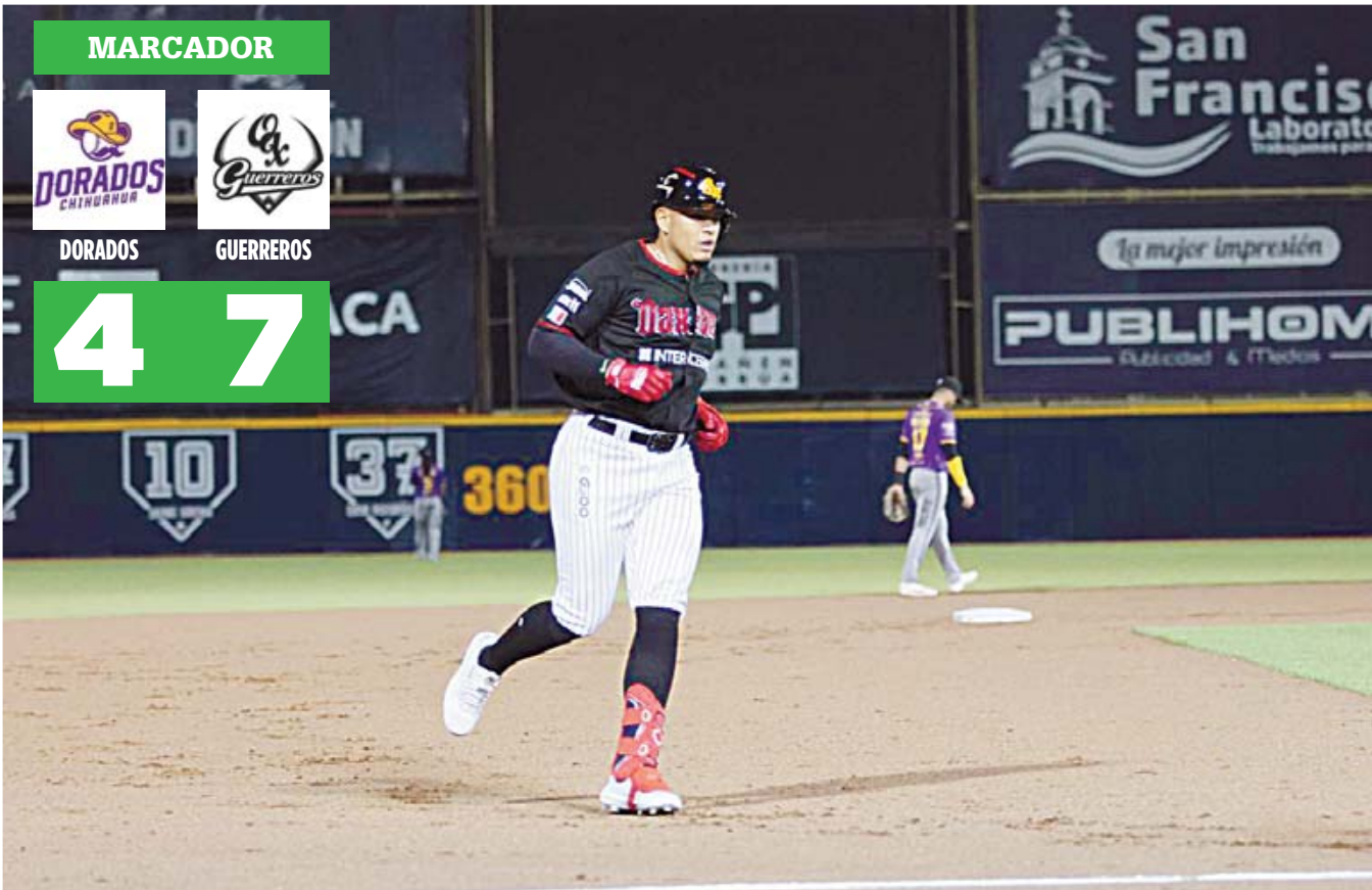
Los de Oaxaca se impusieron a Dorados en un juego donde los de Chihuahua siempre pisaron los talones a la Tropa.