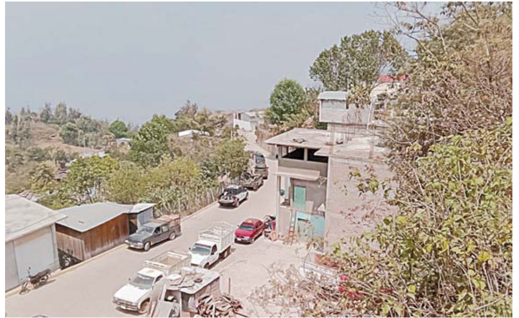
Autoridades aseguran que el ataque fue cometido por un grupo de personas de Piedra del Tambor.