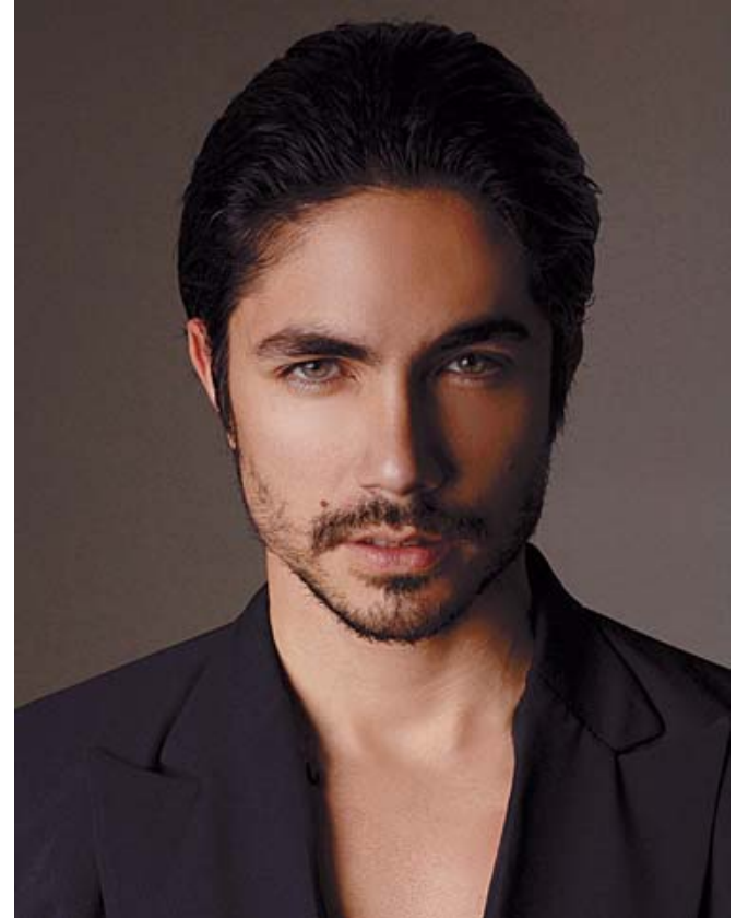
■ El actor Siang Chong planea una estancia en Huatulco con su servidor.

Un abrazo fuerte a todos; el día de mañana, jueves, se celebra el Día Nacional de la Donación de Órganos, ¡un gran acto de amor, que debemos de considerar!