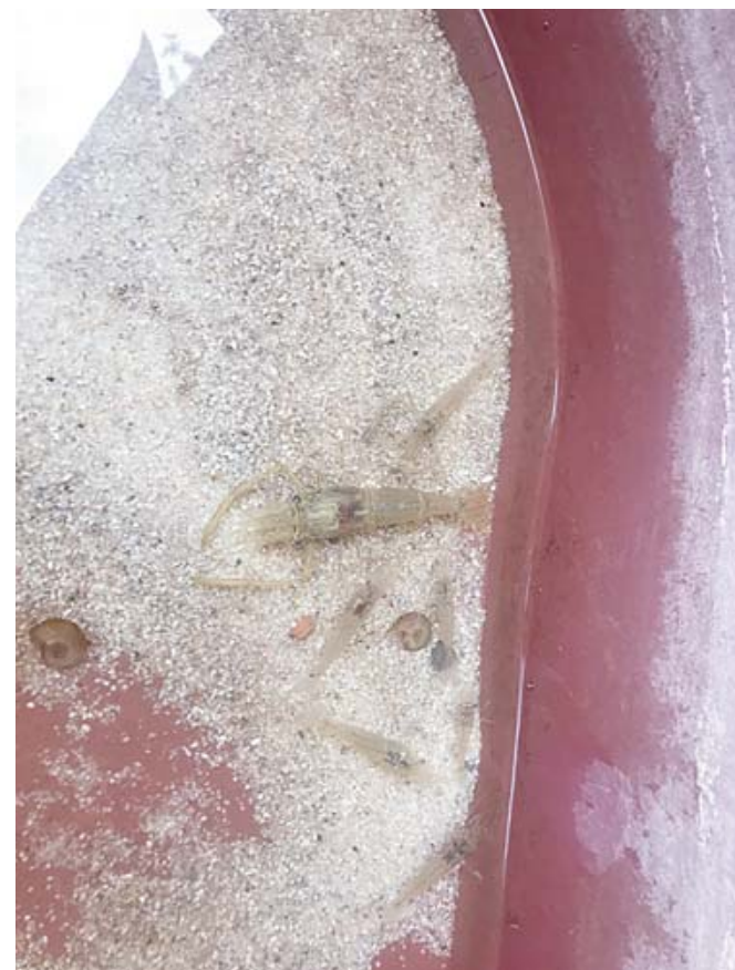
▪ Los langostinos, por el momento, sólo pueden ser cultivados en su etapa de engorda.