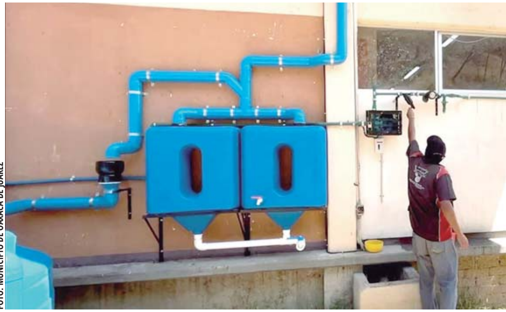
■ Captación de agua en escuelas.

“Hacer fosas, llenarlas de vegetación, porque esa agua que se capta es importante”, pero también promover sistemas de captación de lluvia a partir de los techos. De acuerdo con el especialista, la captación del agua es esencial