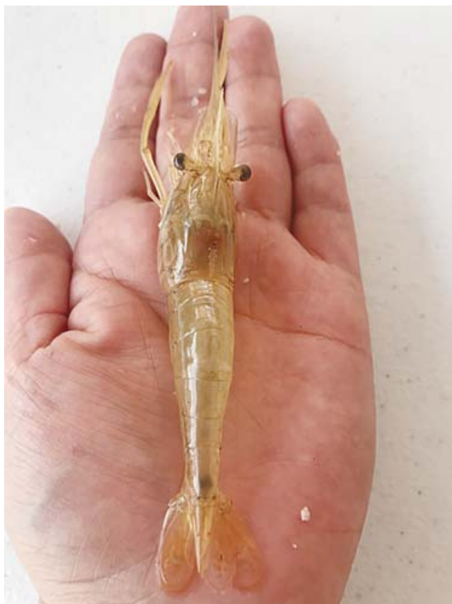
▪ El langostino tiene, entonces, una gran importancia ecológica, pero también económica.