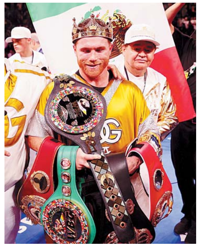
Canelo tiene hasta el 6 de junio para acordar una pelea con el mandatorio de la FIB.