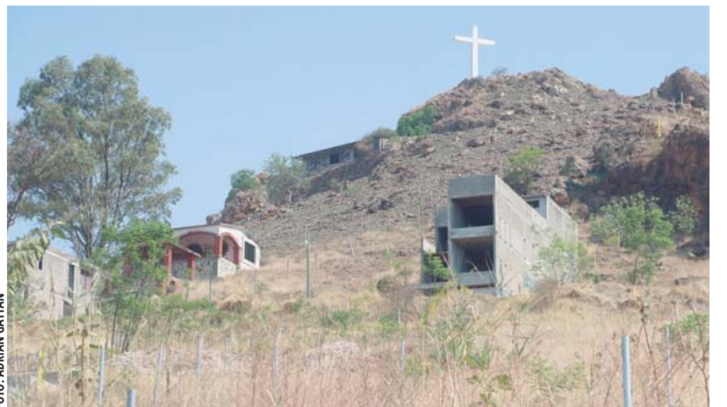
■ Asentamientos irregulares, dolor de cabeza por la prestación de servicios públicos.

Sobre estos casos, expuso que se han presentado en Trinidad de Viguera, ya que por su forma de organización y administración, con comités de agua, de festejos u otros, la recaudación de recursos es a través de la misma autoridad.