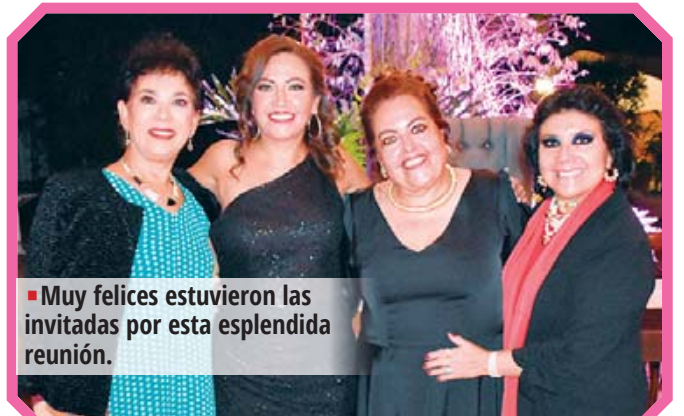
Muy felices estuvieron las invitadas por esta espléndida reunión.