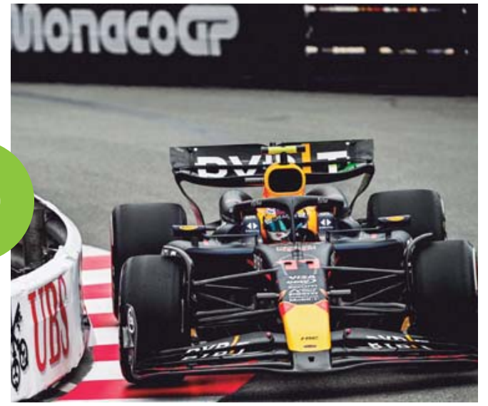
Los de Milton Keynes tuvieron dificultades en las prácticas que fueron dominadas por Ferrari.

marca de 14 triunfos por 22 descabros, y espera que en la Verde Antequera su promedio de victorias pueda mejorar.