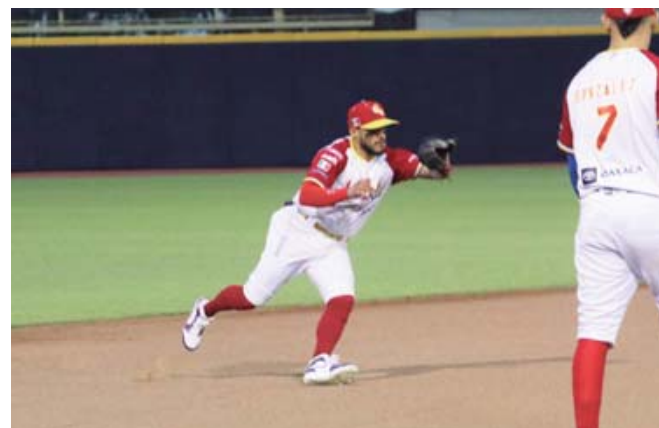
Guerreros de Oaxaca ganó su primera serie por barrida.

Guerreros regresa a las acciones el martes 28 de mayo, recibiendo a Dorados, serie que se prolongará hasta el jueves en las instalaciones del parque Lic. Eduardo Vasconcelos de esta ciudad de Oaxaca, las actividades darán inicio a partir de las 19:00 horas, esperándose que la presencia de la