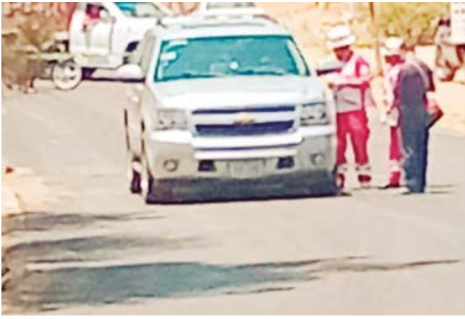
El empresario viajaba en su camioneta cuando fue atacado con disparos de arma de fuego.