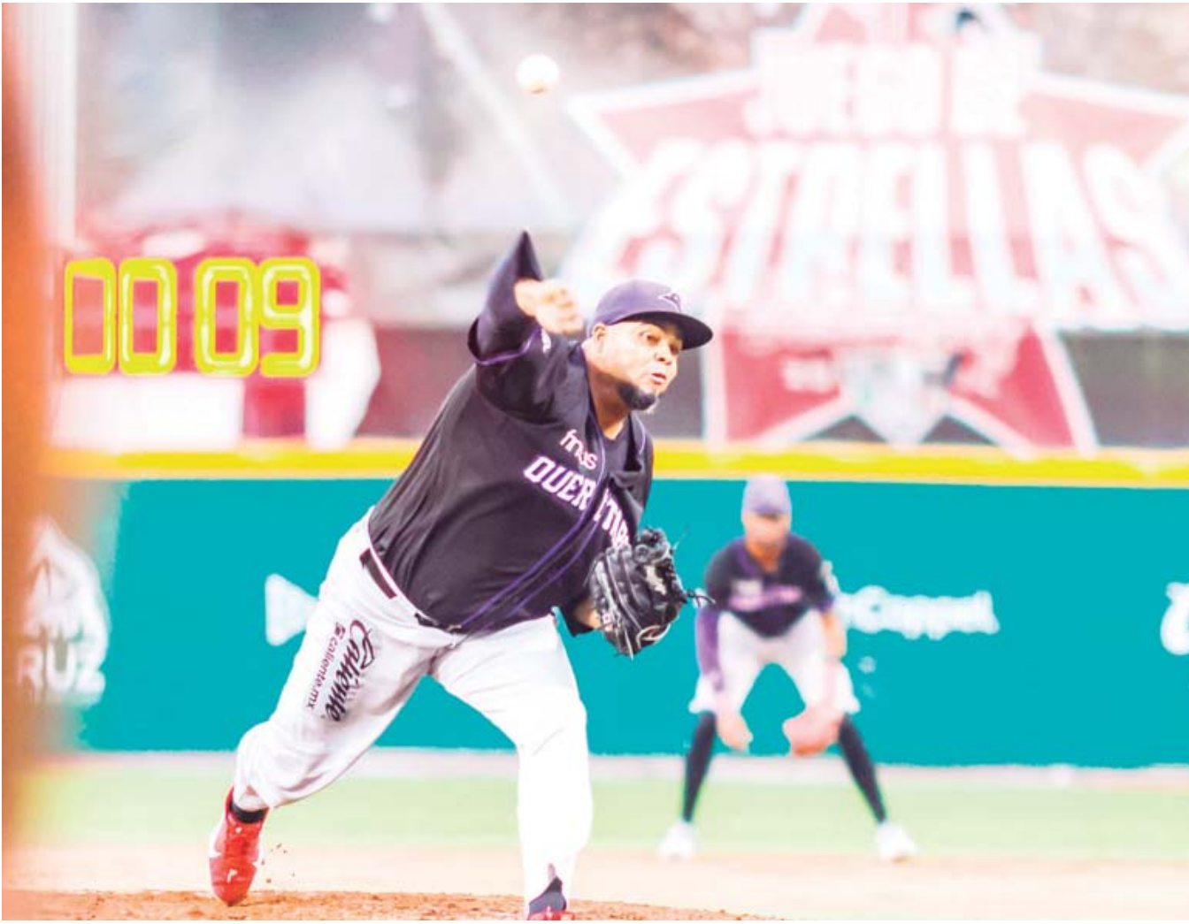
El Juego de Estrellas 2024 se jugará cuando más a nueve episodios sin extrainnings.