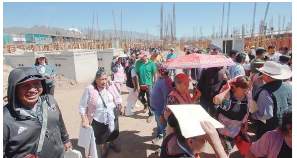
Locatarios en las obras de remodelación en la Central de Abasto.