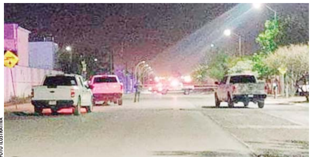
Ismael R. C. fue encontrado tirado junto al camino tras haber recibido un impacto de bala.

Las autoridades continúan con las investigaciones para esclarecer el asesinato y dar con los responsables de este trágico suceso.