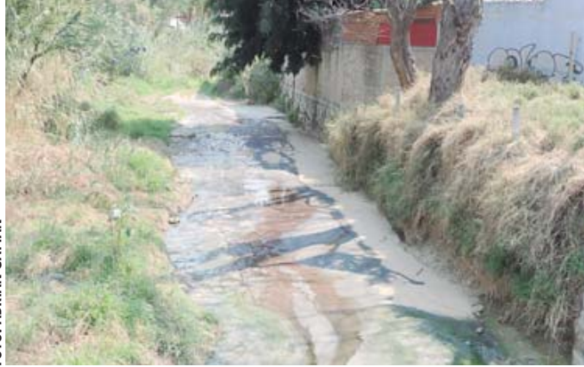
Desazolvar el cauce del río San Felipe, vital para la zona norte de la ciudad.

“El objetivo de este tequio es limpiar el cauce del río, quitar los residuos sólidos, quitar la maleza que no corresponde al río y sacar un poco de tierra