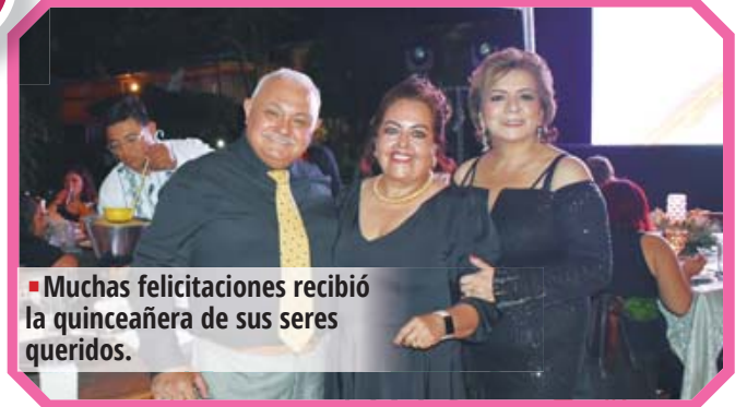
Muchas felicitaciones recibió la quinceañera de sus seres queridos.