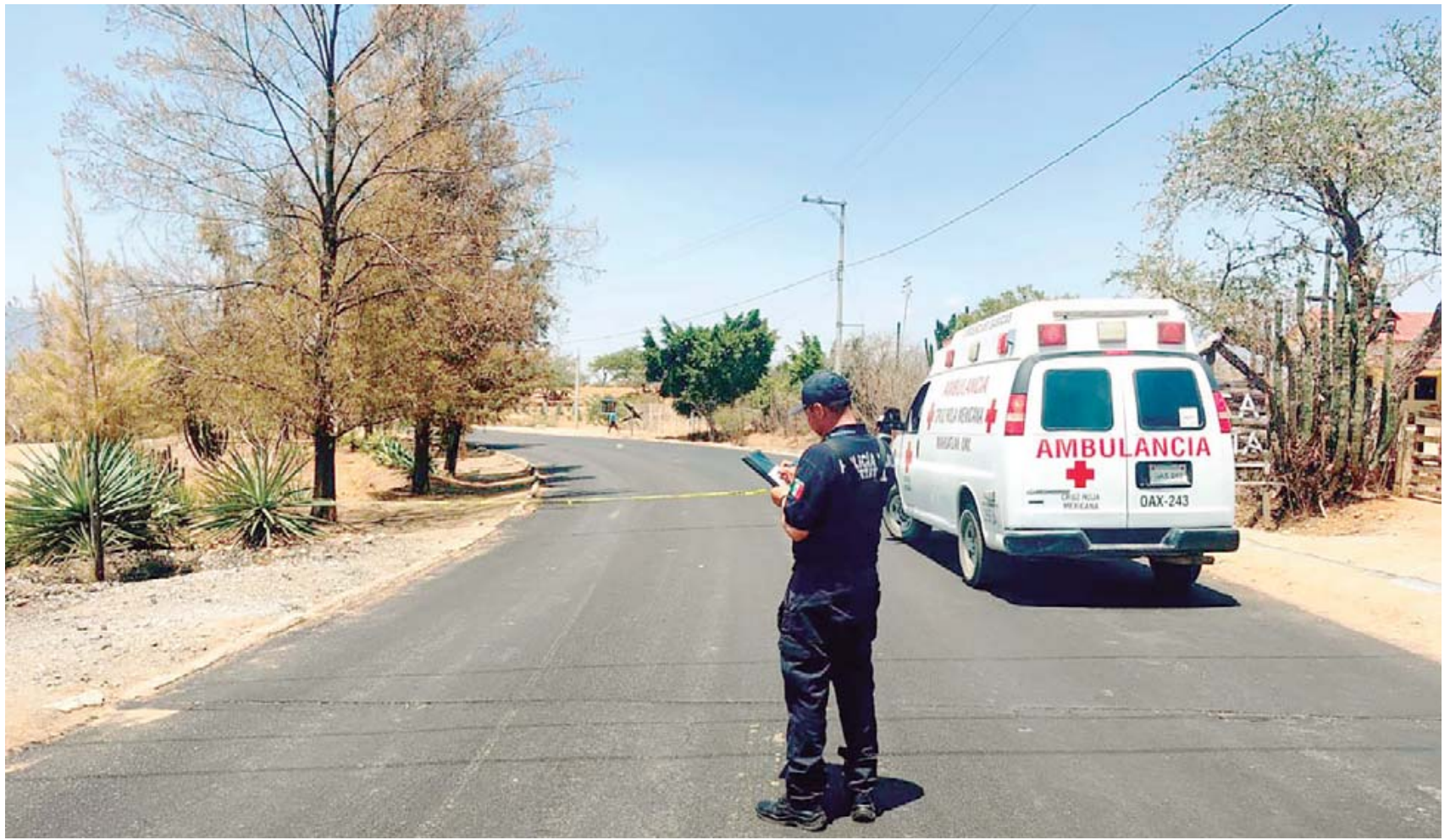
Personal de la Cruz Roja no pudo hacer nada para ayudar a la víctima que perdió la vida en el lugar.

del mezcal junto con sus colegas productores.