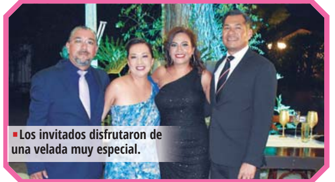
Los invitados disfrutaron de una velada muy especial.