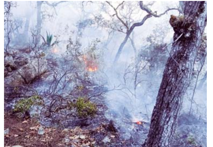
El incendio forestal en Tepelmeme Villa de Morelos, ha consumido más de 2 mil 700 hectáreas de bosque.