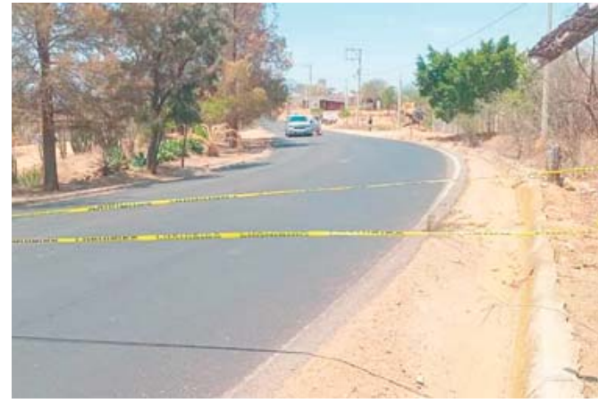
Este hecho ocurrió antes de llegar al paraje Casa Vieja donde fue alcanzado por sicarios.