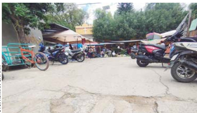
Calles de la agencia municipal de San Martín Mexicápam.