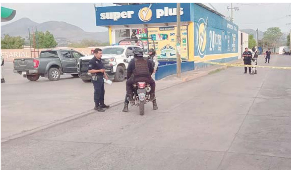
El lesionado de 24 años fue trasladado al Centro de Especialidades Jardines del Sur.

Las autoridades continúan trabajando para esclarecer este homicidio y llevar a los responsables ante la justicia.