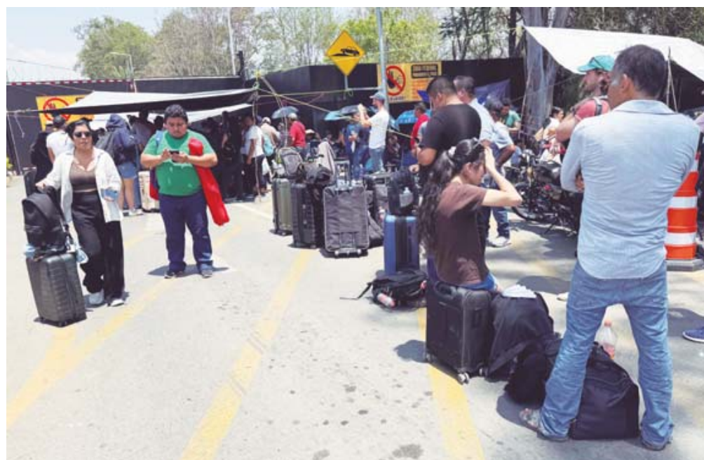
Miles de turistas fueron afectados por el bloqueo de la Sección 22 en el Aeropuerto de Oaxaca; al menos seis vuelos fueron cancelados.

“Es difícil que regrese con estas situaciones, por-