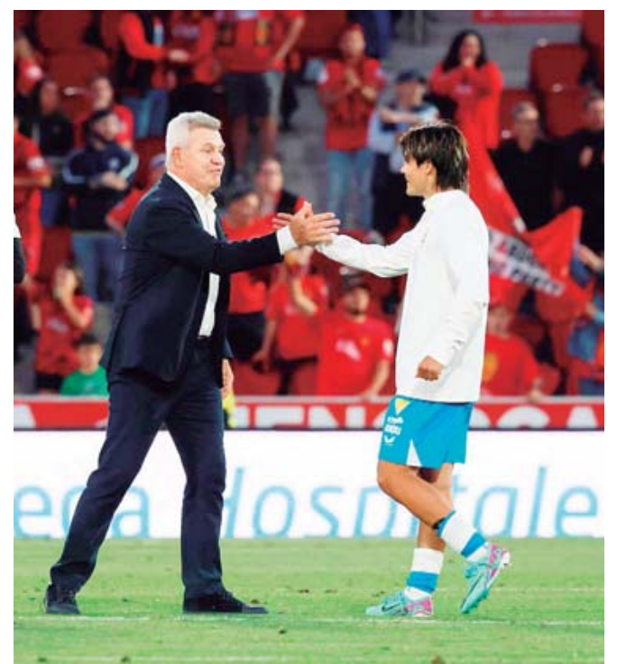
El Mallorca decidió no renovarle y, ni siquiera, le ofreció una oferta de renovación.

"Parece que estamos un poco lejos, pero lo daremos todo en la clasificación. ¡Vamos con todo!", escribió el tapatío en redes sociales.