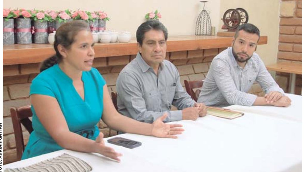
Vecinos convocan a un gran tequio en favor del río San Felipe.

Además de que el colector construido por el gobierno estatal ya presenta fugas. Escamilla recordó que hace poco más de 2 años junto con otra organización se detectaron 96 descargas residuales que caen directo al río y que se ubican desde el Ejido Guadalupe Victoria hasta la calzada Porfirio Díaz. Ante ello, también llamó a