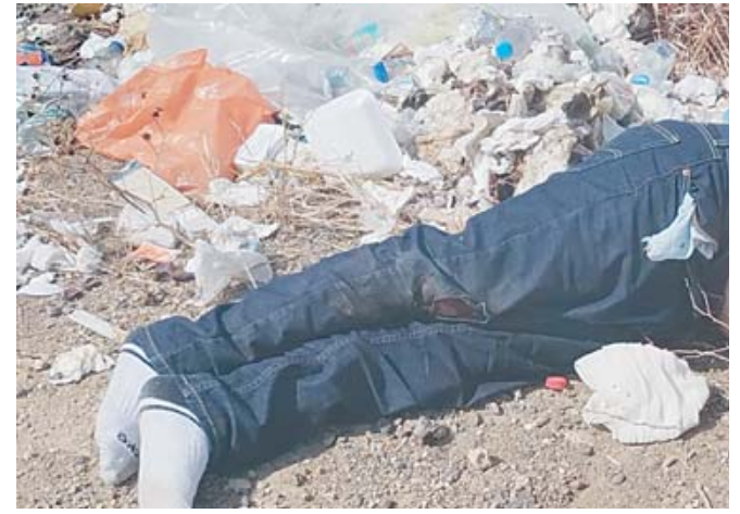
La víctima tenía alrededor de 30 años en el momento de su muerte.