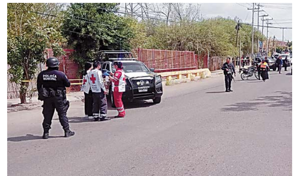
El ataque armado ocurrió cerca de la planta de la Comisión Federal de Electricidad.

La investigación está en curso, y se espera que los resultados de la misma determinen las responsabilidades del accidente.