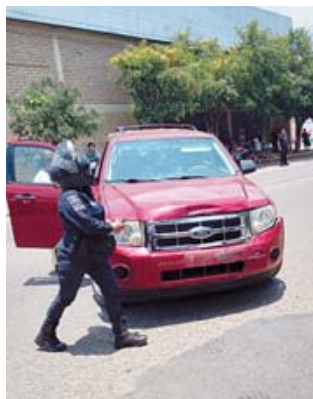
La conductora de la camioneta fue detenida por las autoridades en el lugar de los hechos.

Al lugar del siniestro llegaron agentes estatales de investigaciones para llevar a cabo las primeras diligencias. Entre las acciones realizadas, se incluyó la inspección ocular del sitio y el traslado del cuerpo sin vida de Octaviano al anfiteatro, donde se le practicará la necropsia de ley.