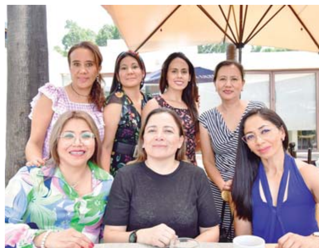
Compartieron las experiencias que les deja la crianza de sus hijos que estudian en el Liceo Federico Froebel.

El lente de Estilo Oaxaca captó este momento mientras realizaba su recorrido por los principales restaurantes de esta Verde Antequera, ellas dijeron sentirse muy felices por este momento familiar que esperan repetir próximamente. ¡Felicidades!