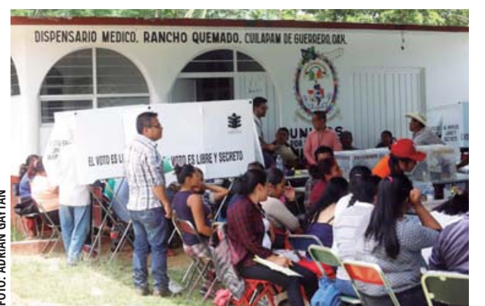
Votación en Rancho Quemado, Cuilapam de Guerrero. Se encienden las disputas políticas.

como dé lugar quiere heredarle el cargo a su sobrino, pero sabemos que la gente de Cuilápam no lo va a permitir, por eso se dedica ahora a utilizar recursos públicos para apoyar a su familiar”.