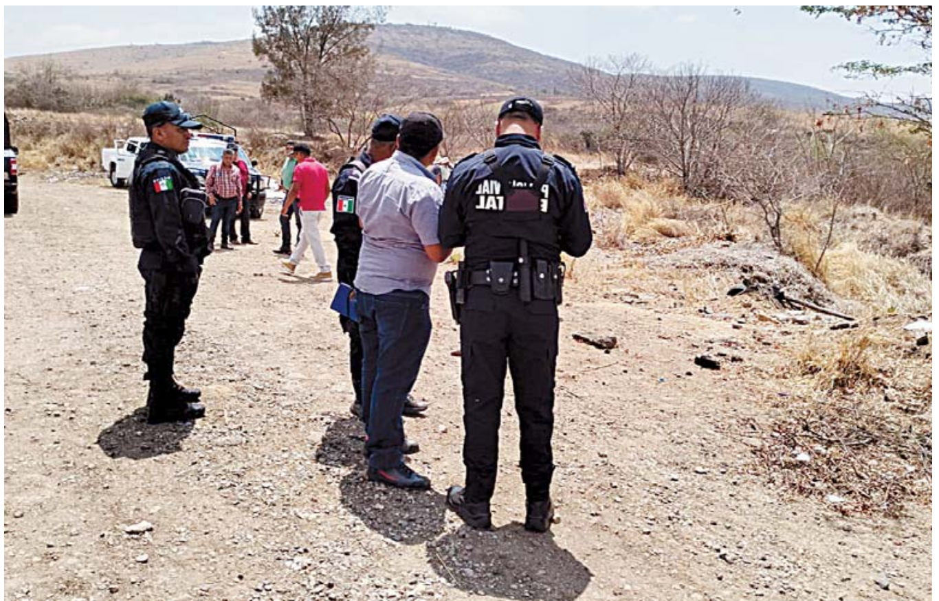
Este hallazgo fue llevado a cabo en la Cuesta de Ocotlán en la Carretera Federal 175.

Poco después, elementos de la Agencia Estatal de Investigaciones (AEI) se presentaron en el sitio para llevar a cabo las diligencias y ordenaron el traslado del cuerpo al anfiteatro, donde se le practicará la necropsia de ley con el objetivo de determinar las