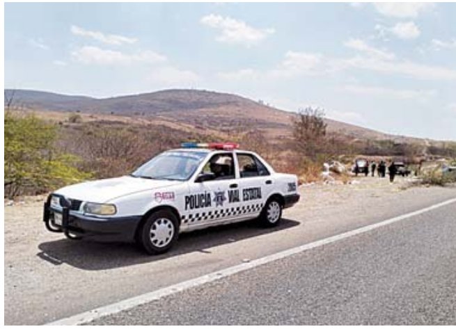
Hasta el momento, la identidad del fallecido no ha sido establecida.