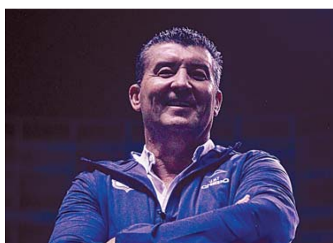
De la Torre se enfrenta al desafío de revitalizar al Puebla y llevarlo a nuevas alturas.

Chepo de la Torre, quien ha ganado tres campeonatos en la primera división del fútbol mexicano, vuelve al banquillo tras su última experiencia dirigiendo al Toluca entre enero y septiembre de 2020. En esa segunda etapa con los Diablos Rojos, logró ocho victorias en 28 partidos antes de ser relevado de sus