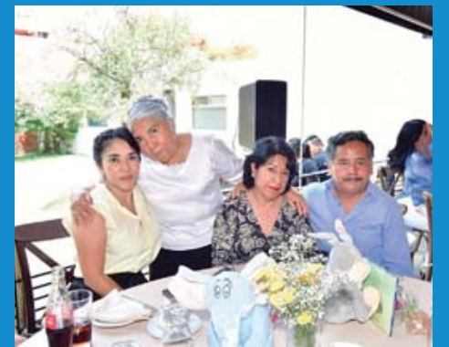
La familia de la futura mamá estuvo presente para celebrar este acontecimiento.