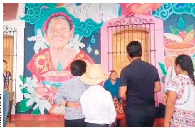
En la tierra del tejate le dicen no a la comida chatarra.

Precisó que el daño por el consumo de los productos chatarra, no sólo afecta la salud de las personas, sino además ocasionan grandes problemas de contaminación, destrucción del planeta y acaparamiento de recursos naturales para su producción,