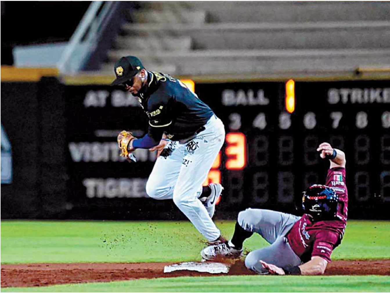
Hoy, los Guerreros buscarán sellar la barrida ante los de Quintana Roo.