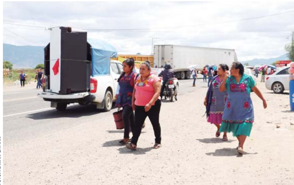
Habitantes del fraccionamiento Rancho Valle del Lago en múltiples ocasiones han bloqueado en demanda de mejoras en servicios del lugar.

“Estamos muy molestos porque el actual presidente municipal que es del Partido del Trabajo