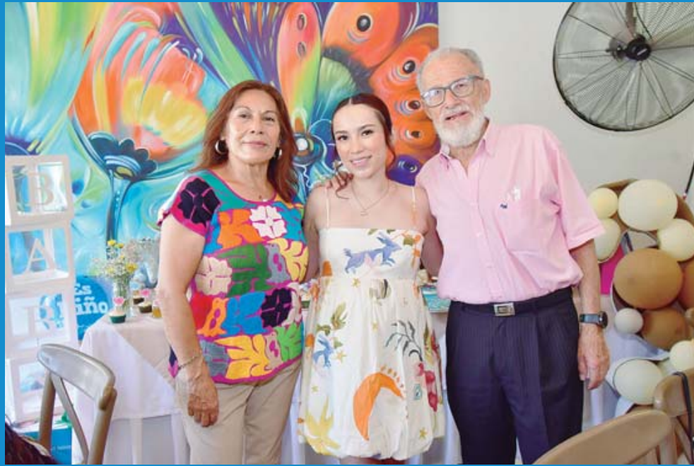
La futura mamá disfrutó de este momento con sus suegros.

Es por excelencia un cuarzo mental, y al pertenecer a esta categoría, garantiza un sueño mucho más profundo. Su energía ayuda a eliminar los pensamientos negativos en positivos, creando una especie de filtro que evita las pesadillas al dormir.