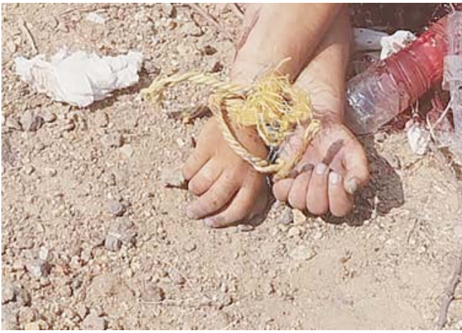
El cuerpo se encontraba atado de manos y con huellas de tortura.