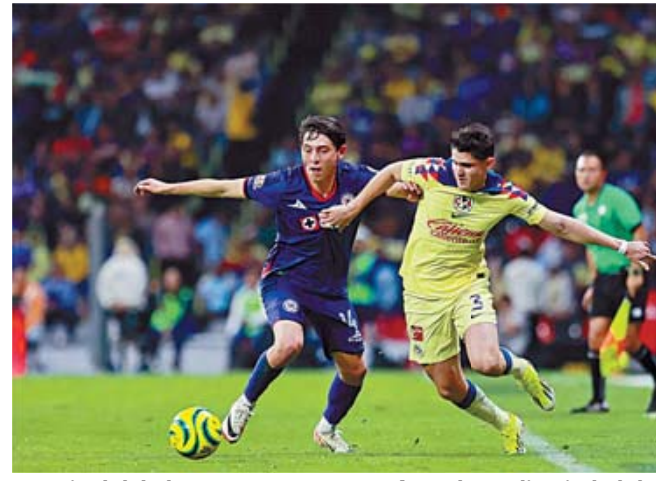
La Final del Clausura 2024 arrancará en el Estadio Ciudad de los Deportes a las 20:00 horas.