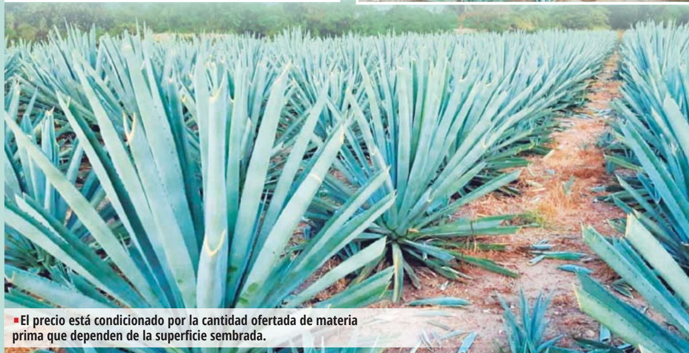
■ El precio está condicionado por la cantidad ofertada de materia prima que dependen de la superficie sembrada.

cias a esta bonanza mezcalera, zonas como Yautepec y colindantes están viviendo un momento de prosperidad que no se tenía hace mucho.