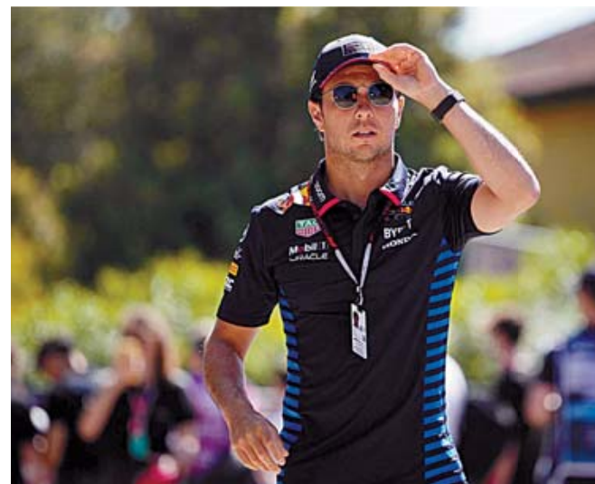
■ Red Bull envió contrato de renovación a Checo, pero no fue aceptado por el mexicano.

Sin embargo, aún con este estira y afloja, se cree que las negociaciones pueden llegar a buen puerto siempre y cuando se ofrezca un año, con opción a uno más, mismo que sería en función de lo que Pérez pueda hacer durante la temporada 2025, y también lo ocurrido en 2024, en donde tendrá que repetir o mejorar lo realizado el año anterior.