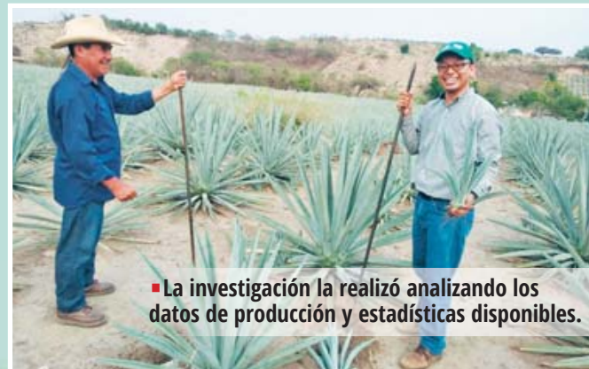
■ La investigación la realizó analizando los datos de producción y estadísticas disponibles.