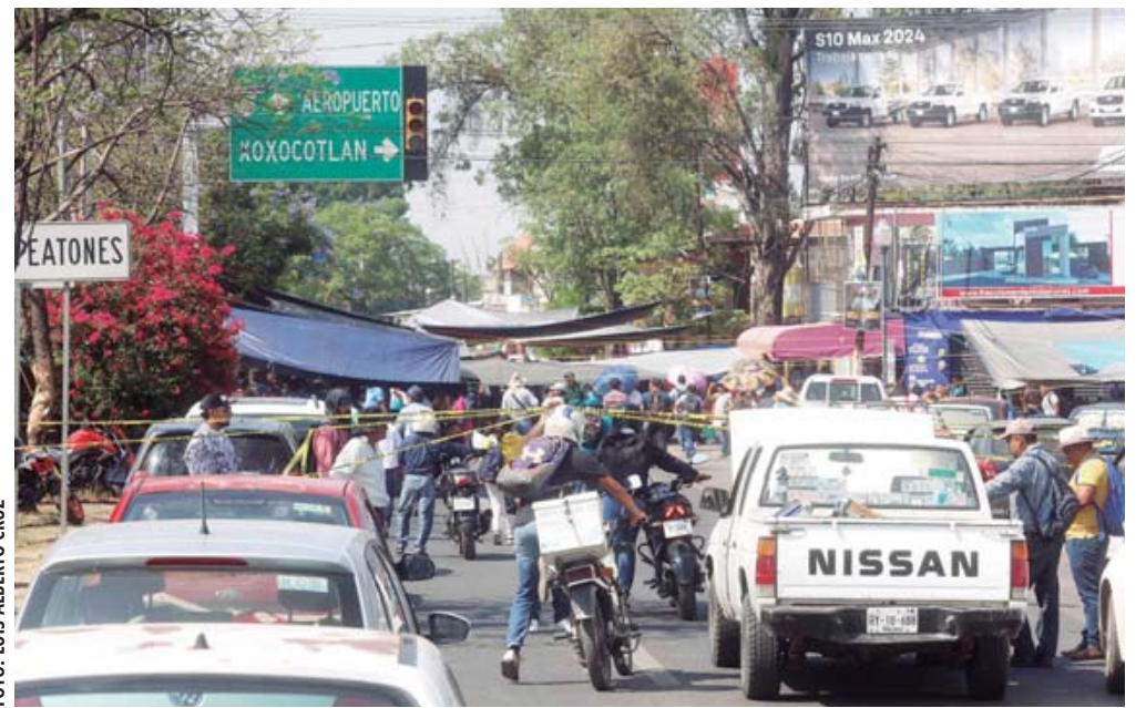
■ Imagen del cruce al aeropuerto al mediodía del martes.

a la terminal aérea, se vieron afectados decenas de turistas y entre ellos, Kevin quien aterrizó en inmediaciones de Santa Cruz Xoxocotlán para llegar a la capital del estado por cuestiones de negocios.