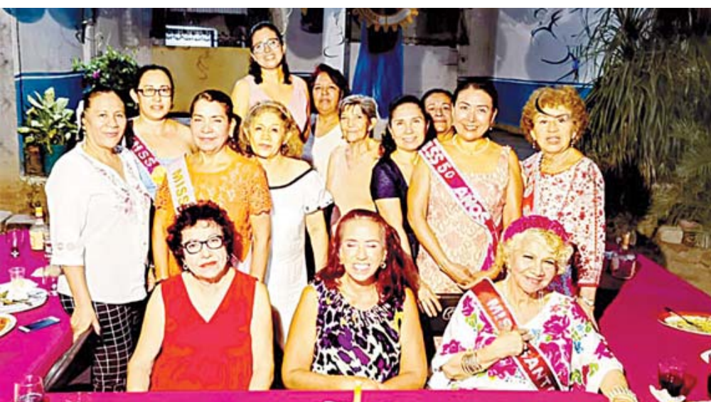
■ Festejaron el 32 aniversario del Club Rotario Zicatela en Puerto Escondido.