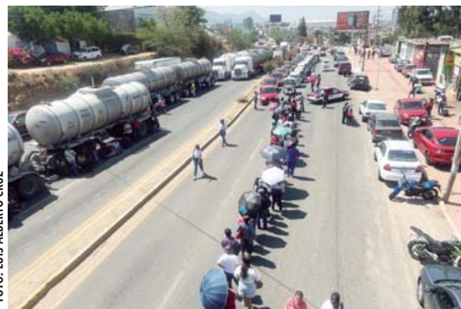
■ Largas filas para transbordar en la zona de Hacienda Blanca. Los ciudadanos, principales afectados.

Y es que ayer, los maestros se concentraron en los cruceros de comunidades pertenecientes a la región de Valles Centrales y por eso, provocaron que cientos de personas cargaron sus bultos de cosas en el hombre, caminaron varios metros de distancia para transbordar sobre la carretera federal 190 por el cie-