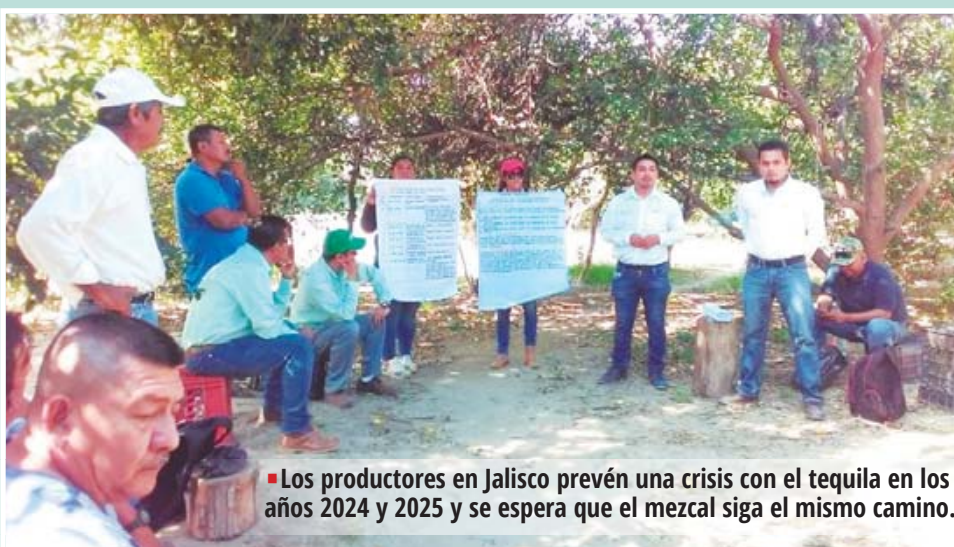
■ Los productores en Jalisco prevén una crisis con el tequila en los años 2024 y 2025 y se espera que el mezcal siga el mismo camino.