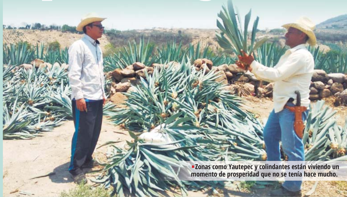
■ Zonas como Yautepec y colindantes están viviendo un momento de prosperidad que no se tenía hace mucho.