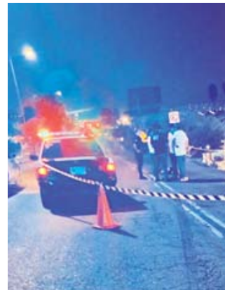
■ El joven fallecido, era vecino de Trinidad de Viguera.

Tras el levantamiento del cuerpo, el amigo de la