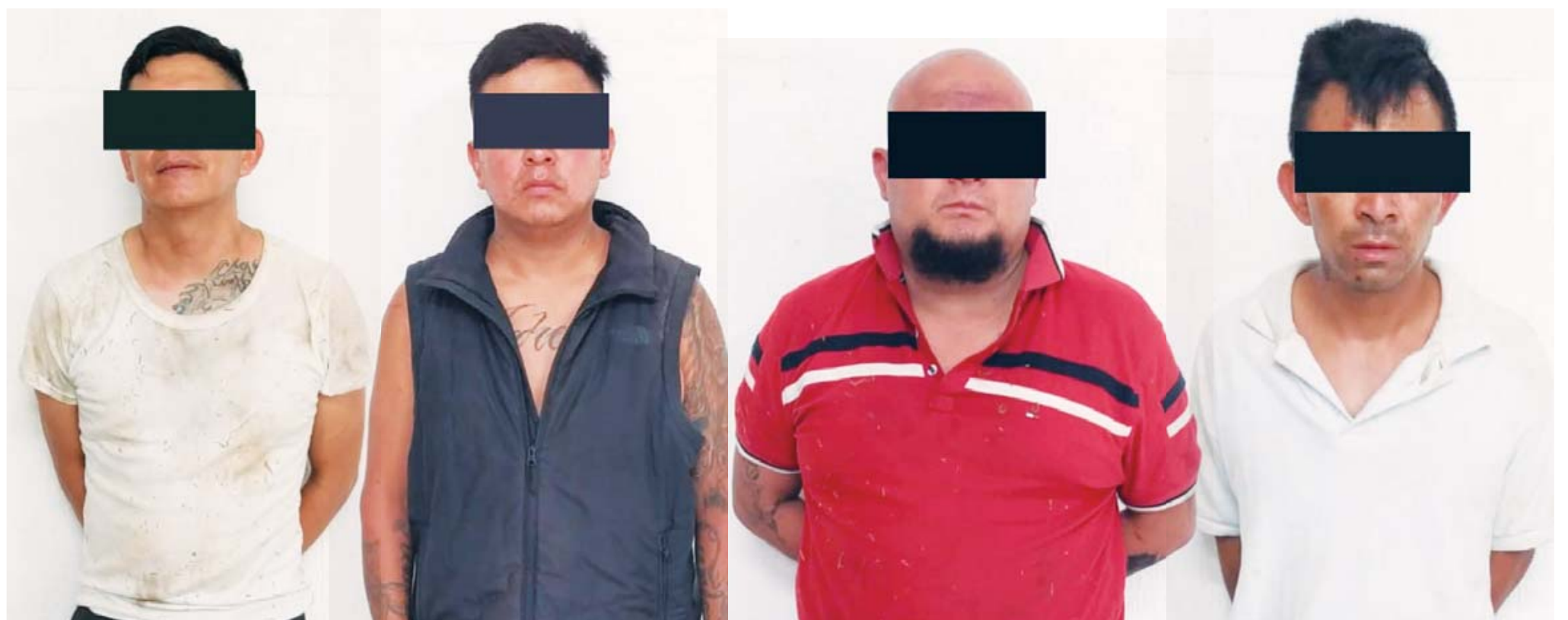
■ Los cuatro señalados fueron detenidos en posesión de armas de fuego, un vehículo de motor y diversas maletas con dinero.

La Fiscalía de Oaxaca, en su compromiso con la justicia, realiza investigaciones exhaustivas en delitos de alto impacto para identificar y presentar ante la justicia a los responsables, aplicando todo el rigor de la ley.