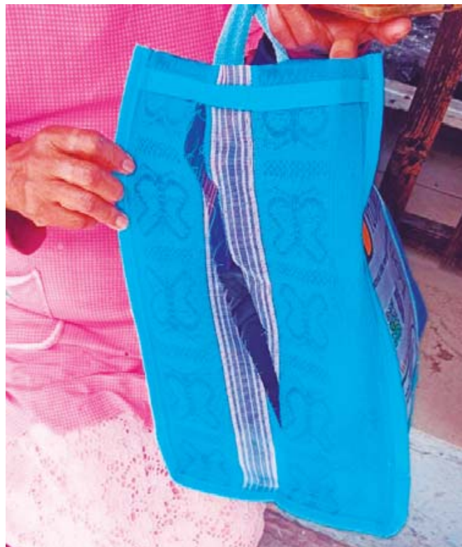
■ Los ladrones cortaron la bolsa de la ciudadana para extraer el dinero que acababa de retirar.

Cabe destacar que este accidente se suma al que hubo el domingo por la mañana en la parada de autobús de Bodegas Aurrera, por un conductor bajo los influjos del alcohol.