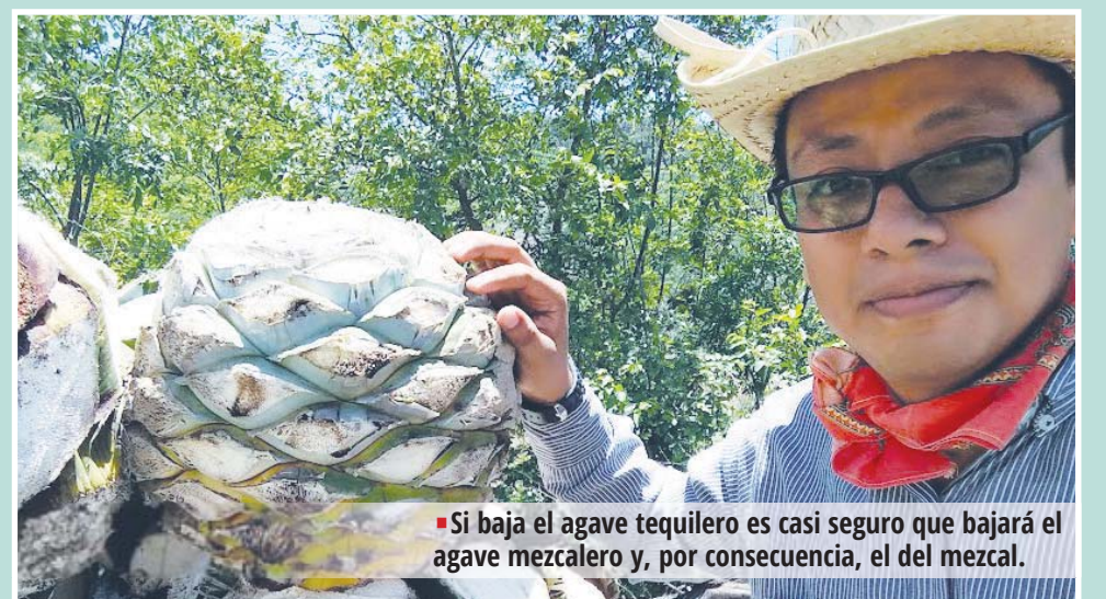
■ Si baja el agave tequilero es casi seguro que bajará el agave mezcalero y, por consecuencia, el del mezcal.