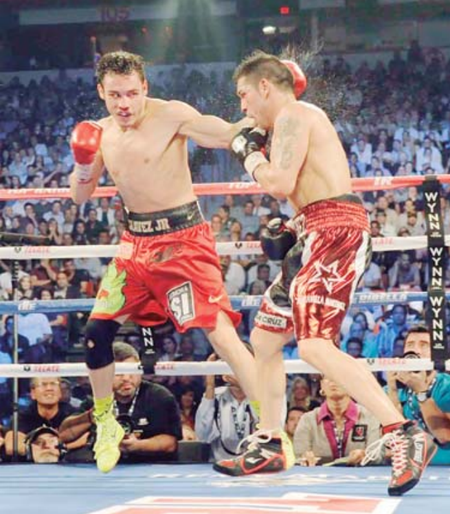
La batalla sería de ocho rounds y en la categoría de las 190 libras.

Editor: Diego MEJÍA / Diseñador: Juan Manuel RODRÍGUEZ