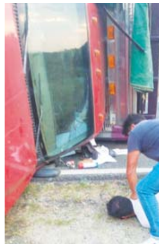
La persona presuntamente responsable resultó detenida.