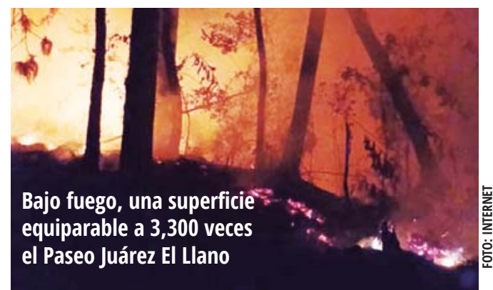
Bajo fuego, una superficie equiparable a 3,300 veces el Paseo Juárez El Llano

Reporta Conafor 24 incendios activos en Oaxaca.