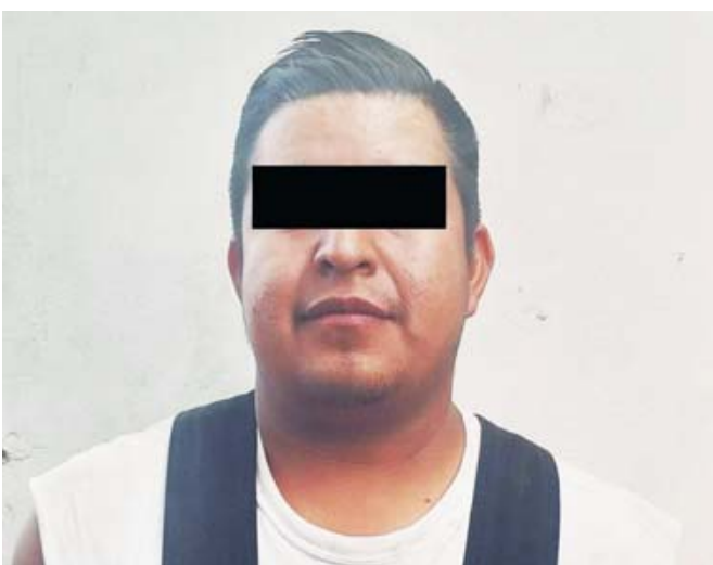
El conductor fue identificado como Erick S. L., de 29 años de edad.

El vehículo localizado se trata de una camioneta marca Toyota, tipo Tacoma, color negro, con placas de circulación de Oaxaca,