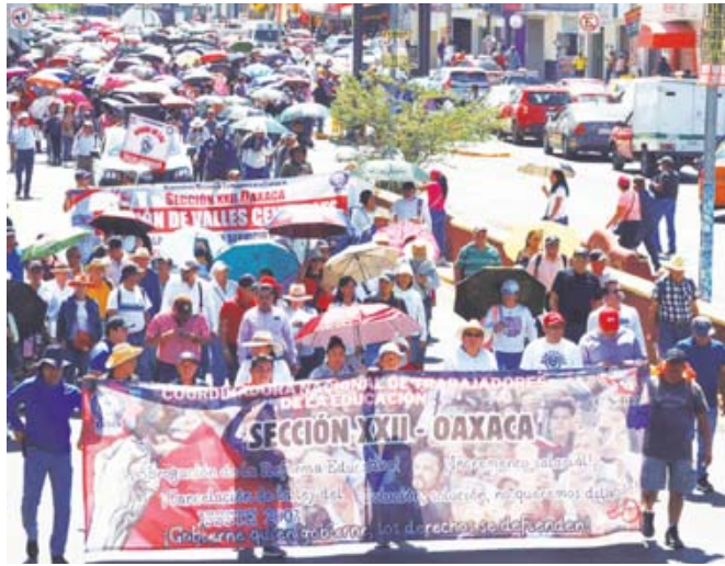
La Sección 22 alista una marcha y el inicio del paro indefinido, para este miércoles 15 de mayo.

Mientras tanto, el 20 de mayo se realizará la próxima