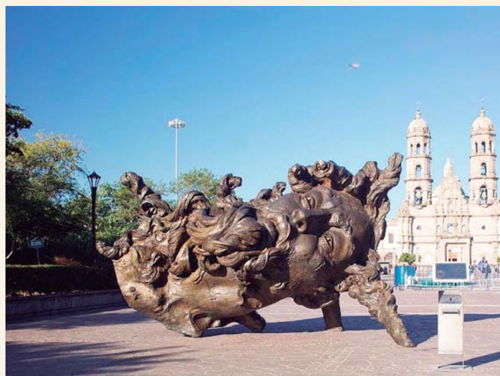
■ Escultura "Cabeza vainilla" (2008), de Javier Marín.

Existen diversos tipos de colecciones en México: el Museo Soumaya, de Carlos Slim, con grandes artistas mundiales del mercado secundario,