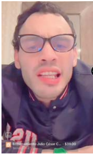
Ha atravesado problemas de adicciones que han requerido rehabilitación.

Formaría parte de la cartelera protagonizada por Mike Tyson y Jake Paul, su primera pelea desde 2021