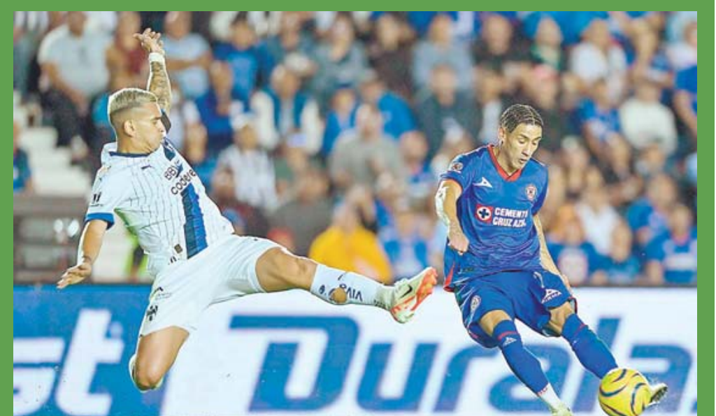
Cruz Azul ha chocado con Monterrey en 64 juegos, de liga y liguilla, con balance positivo para los capitalinos.

La primera ocasión que América y Chivas se enfrenta-