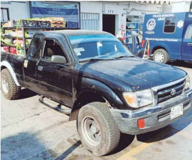
La unidad de motor fue localizada durante un operativo para la detección de vehículos irregulares.