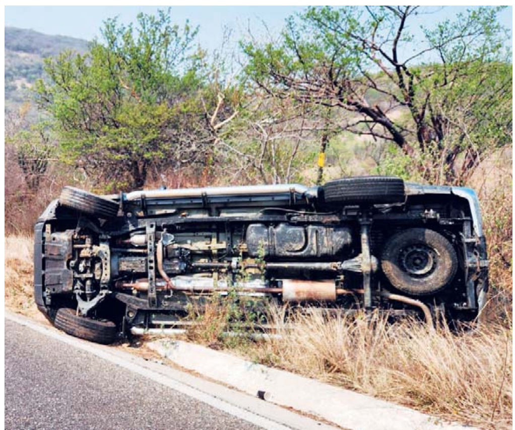
El vehículo tipo Hilux terminó recostada en la orilla de la cinta asfáltica.

Elementos de la Policía Vial Estatal tomaron conocimiento del percance, posteriormente fue asegurada la camioneta trasladándola al cuartel de la corporación.