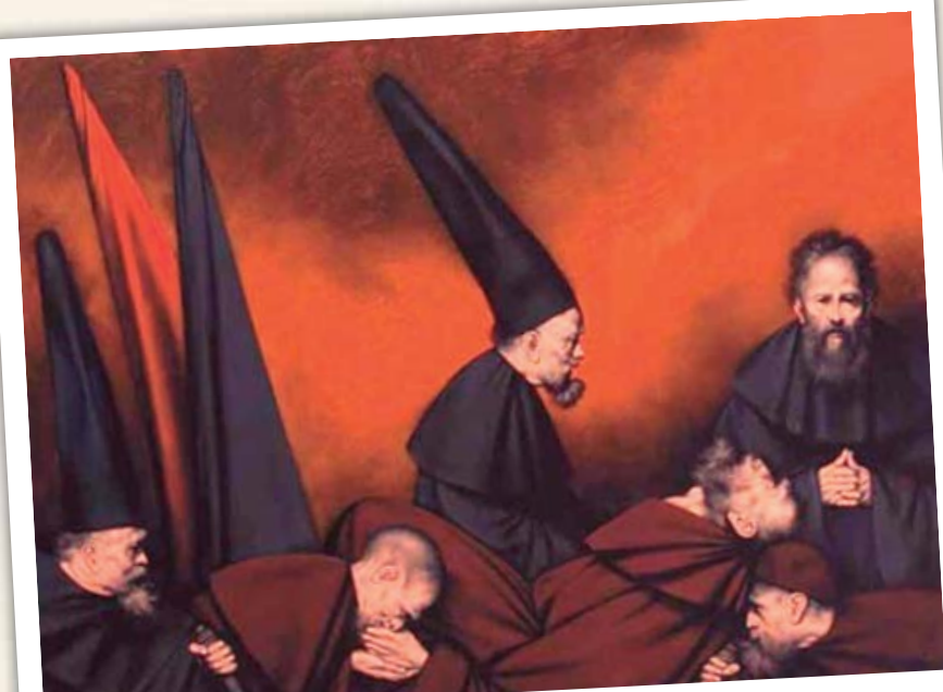
■ Obras de Rafael Coronel, en el acervo del Minart.