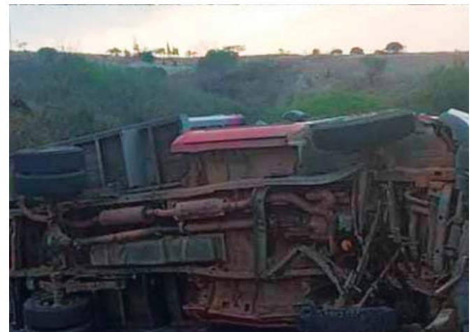
La camioneta Ford involucrada terminó volcada junto a la carretera federal.

tor presuntamente responsable quedó retenido.