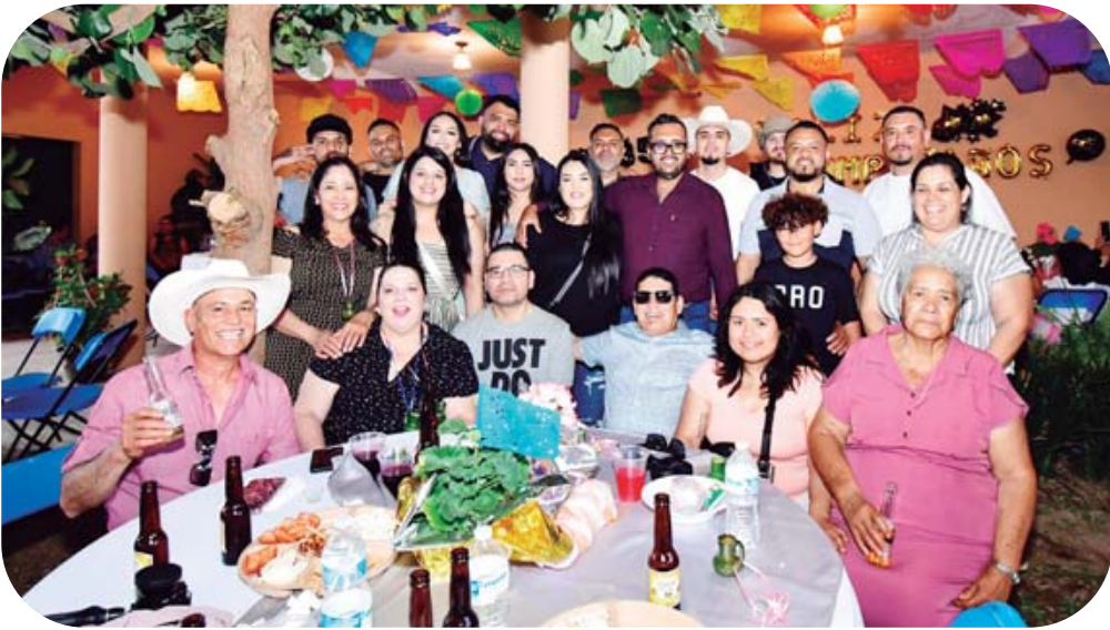
Con su familia de Tejas de Morelos y de Estados Unidos.

estilo@imparcialenlinea.com Tel. 501 8300 Ext. 3174