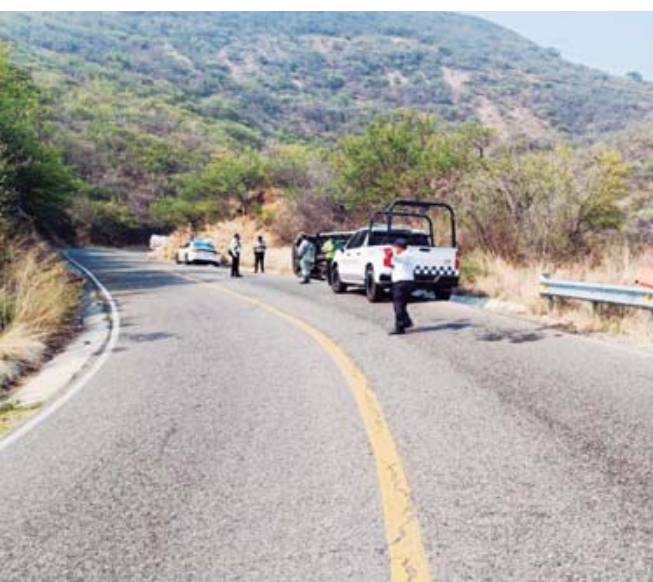
Elementos de la Policía Vial Estatal tomaron conocimiento del percance.

de Agua del Higo, cuando perdió el control de la camioneta, volcando aparatadamente, la cual terminó recostada en la orilla de la cinta asfáltica.