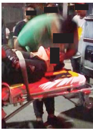
Los lesionados fueron atendidos por paramédicos voluntarios del grupo Halcones.

La unidad de dos ruedas circulaba sobre la intersección de la avenida Montoya con la calle Patria y libertad de la Agencia Municipal de Montoya, donde el chofer de un motocarro se incorporó a la vialidad principal.