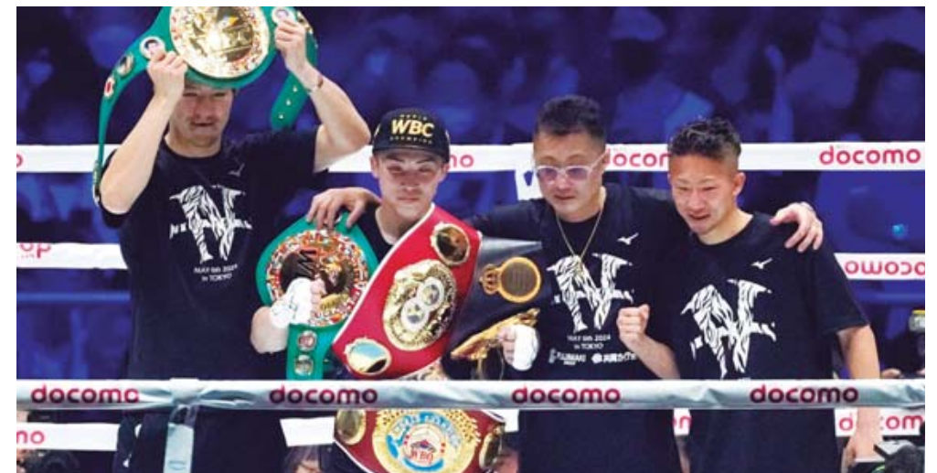
Esta fue la primera defensa de Inoue de sus cuatro títulos en las 122 libras.