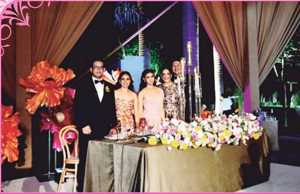
La feliz festejada estuvo acompañada de sus papás y padrinos.