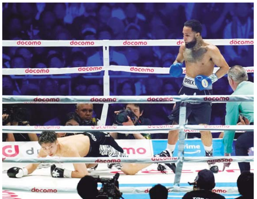
Luis Nery sorprendió en Tokio al mandar al japonés a la lona durante el primer asalto.

Pese a mandar a la lona al campeón indiscutido de peso súpergallo, el mexicano Luis Nery no fue capaz de aguantar el ritmo del japonés y cayó por nocaut en el sexto asalto