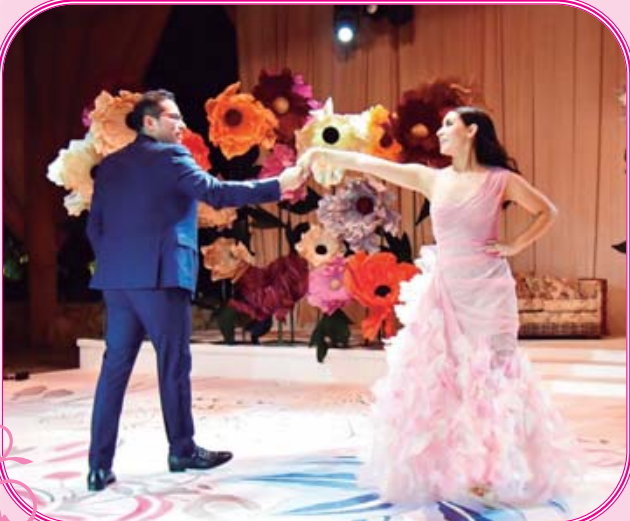
El papá de la quinceañera abrió la pista para bailar con su querida hija.