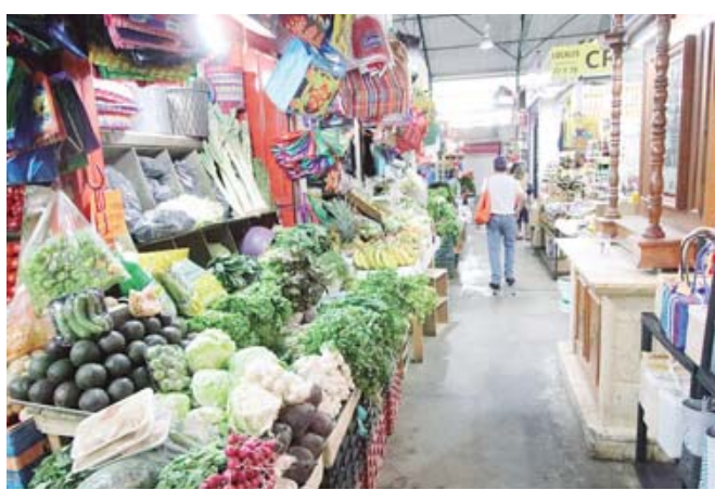
Interior del mercado Benito Juárez