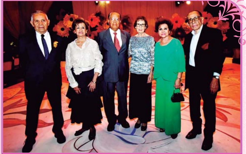
Especiales felicitaciones recibió la quinceañera de sus abuelitos y sus amigos.