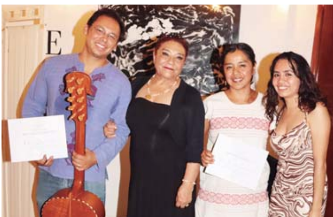
La noche estuvo muy amena con la presencia de la artista y los músicos.