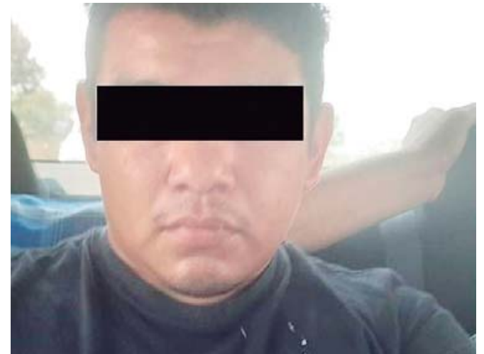
A. V. S. de 38 años fue detenido por el delito de robo en agravio de una persona mayor.

En tanto, el conductor, al ver que la mujer se alejaba, avanzó un poco, detuvo la marcha y se agachó por el monedero y emprendien-