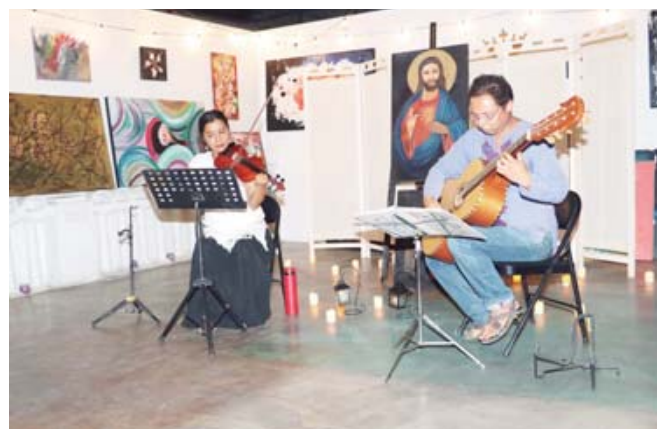
Previo a la entrega, se realizó un evento musical llamado "Trazos Melódicos".