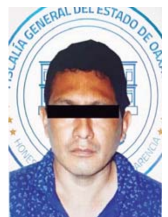
J.M.M.O. fue detenido el 18 de septiembre 2020 por la policía municipal de Xoxocotlán.

Ante estos hechos los uniformados lo detuvieron y presentaron ante el ministerio público en donde las víctimas, cuyas identidades se mantienen reservadas, se mantienen en guardias de seguridad entre 2019 y 2020 a través de anuncios en redes