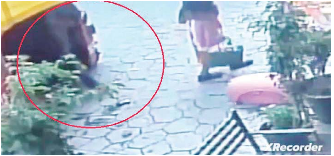
El conductor tomó el monedero y emprendiendo la huida, hecho que quedó grabado en una cámara.

de 38 años de edad, por el delito de robo en agravio de una persona mayor, por lo que fue puesto a disposición de la Fiscalía General del Estado de Oaxaca (FGEO).