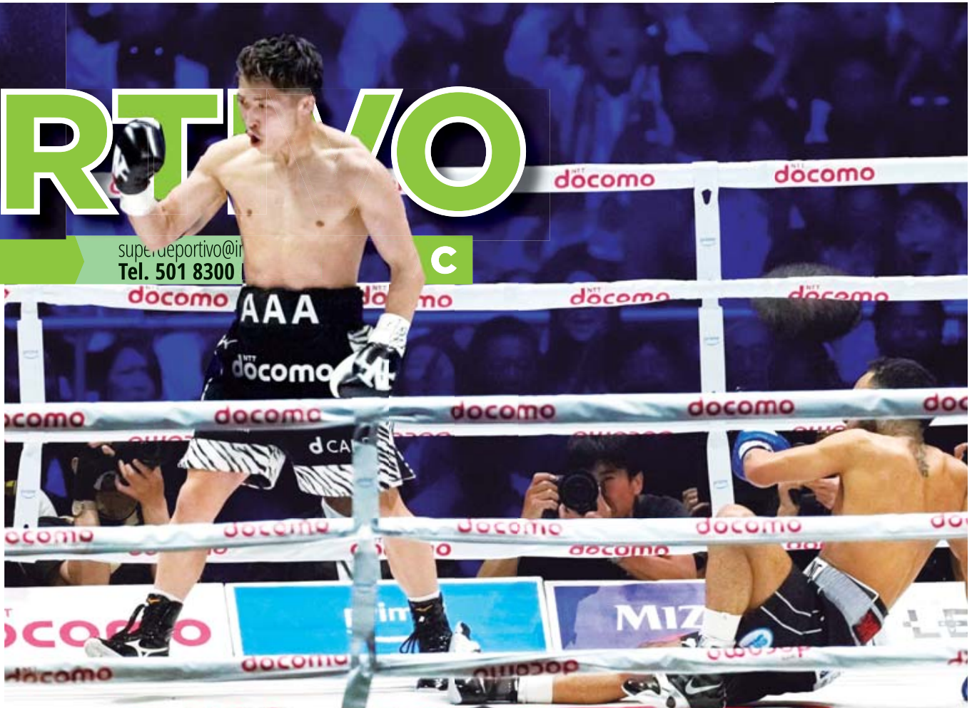
El Monstruo Inoue mandó a Luis Nery a la lona tres veces para llevarse la victoria por nocaut en el sexto episodio.