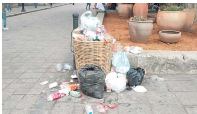
Con cestos suplieron la falta de papeleras que fueron retiradas en el Centro Histórico.

no de residuos ya era una constante incluso antes de la crisis, pero se agravó en los primeros meses, cuando los montones de bolsas con desechos mezclados, vasos desechables de bebi-