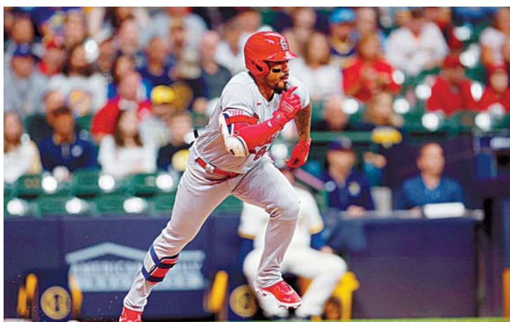
■ El venezolano es el nuevo refuerzo para los béticos.

Profesional (LVBP), siendo ya un estandarte de esta organización con quien ha tenido grandes tempora-