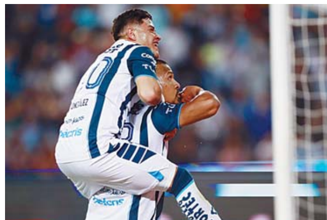
■ Pachuca consigue el último boleto a la Liguilla y enfrentará al América.

El legado de César Luis Menotti perdurará en la historia del fútbol argentino y mundial, recordado por su contribución al deporte y su pasión por el juego bonito y por ser un hombre que escribió su nombre en letras de oro. QEPD.