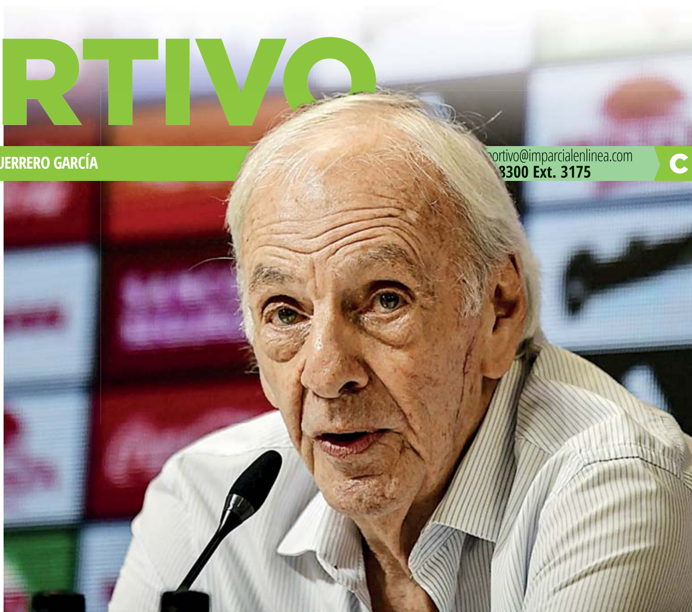
■ César Luis Menotti era el actual director de Selecciones Nacionales de Argentina.