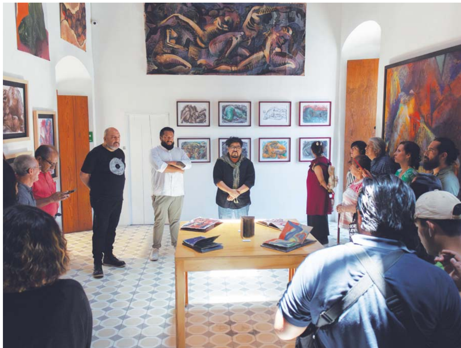
El artista plástico presenta la exposición Encuentros Notables en el Alacrán, un espacio del Instituto de Artes Gráficas de Oaxaca (IAGO).

La descendencia pedagógica de Chopin llegó hasta pianistas como Maurizio Pollini y Alfred Cortot. Disfruta su música.