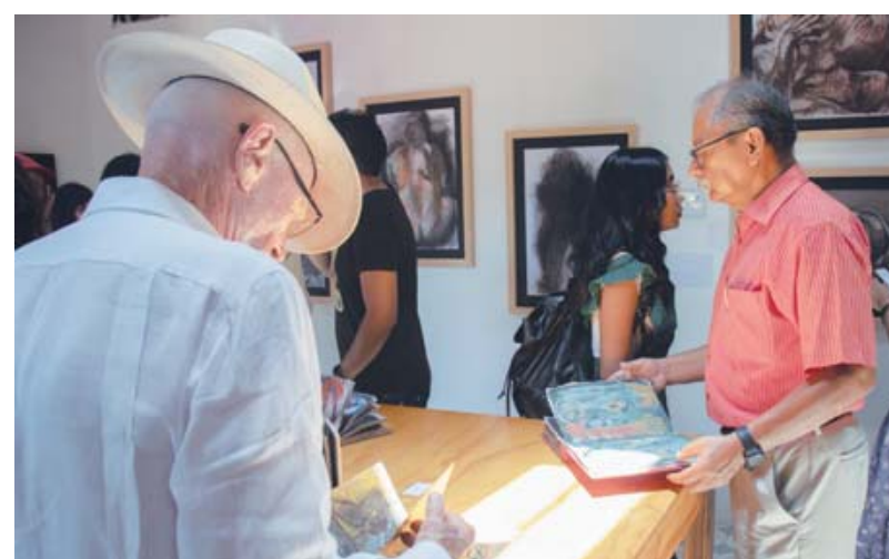
Al artista le gusta pensar el dibujo como algo profundo.