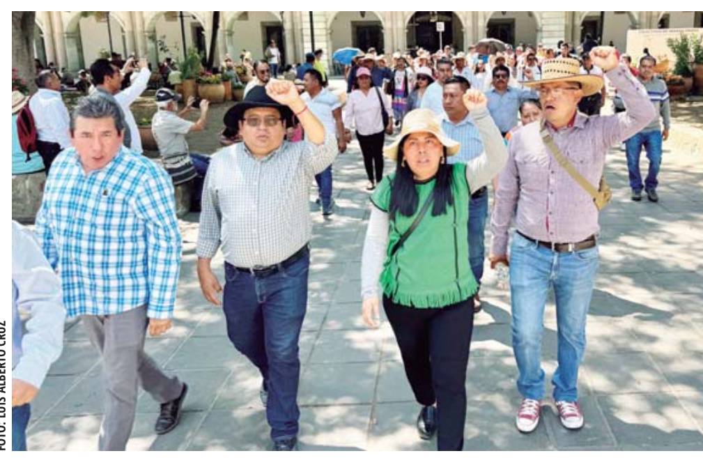
■ A partir del 15 de mayo, la Sección 22 inicia el paro indefinido de labores.

El calendario de la SEP marca 21 días de actividades, pero se "atravesan" días festivos, suspensión de labores... y el paro SAYRA CRUZ HERNÁNDEZ