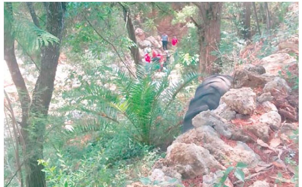
Se requirió de buzos para rescatar al niño de una poza profunda.

Sin embargo, en la madrugada del domingo