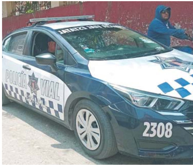
La colisión resultó fatal para la niña.

el menor fue localizado al fondo de una de las pozas, por lo que requirieron del apoyo de buzos de la capital oaxaqueña. Ellos realizaron las labores de rescate del cuerpo del pequeño.