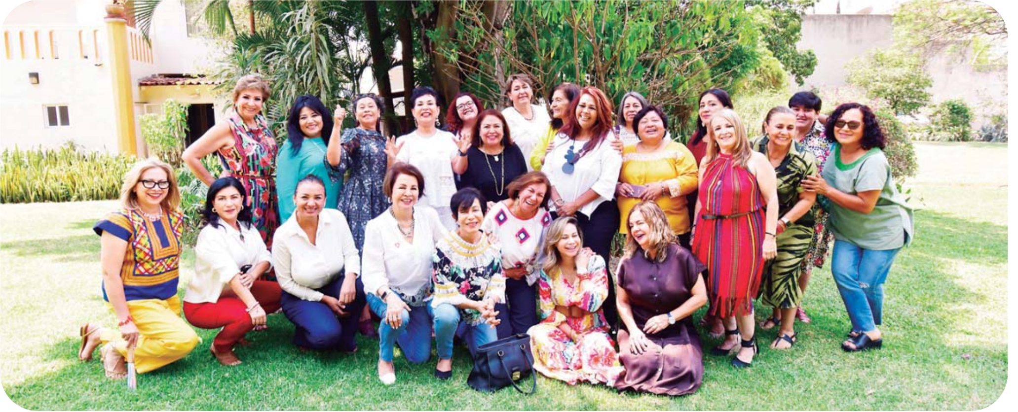
La cumpleañera organizó un festejo especial en un conocido restaurante en San Felipe del Agua, para convivir con sus seres queridos.