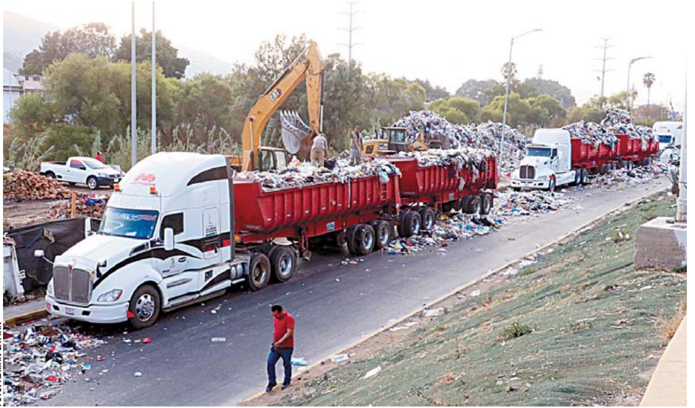
Desde que se cerró el basurero municipal en Zaachila, el playón del río Atoyac funciona como centro provisional de transferencia de residuos.

En esta zona en donde diariamente se depositan los desechos recolectados de manera separada en el casco municipal y en las agencias. Asimismo, se tritura y compacta lo orgánico e inorgánico. Además de que lo que no se puede aprovechar en composta, reciclaje u otro fin, se deposita en camiones que posteriormente se llevan los residuos a depósitos en otros estados.