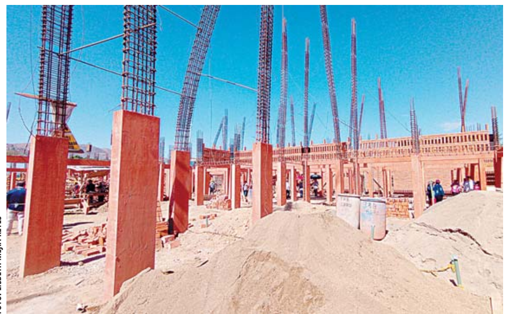
Crece la inconformidad de comerciantes del Mercado de Abasto, por el retraso en las obras que lleva a cabo Sedatu.

Así como en esta zona, el dictamen refiere que no pueden ser objeto del programa los llamados "puestos flotantes" o ambulantes que están en los mercados, como tampoco las