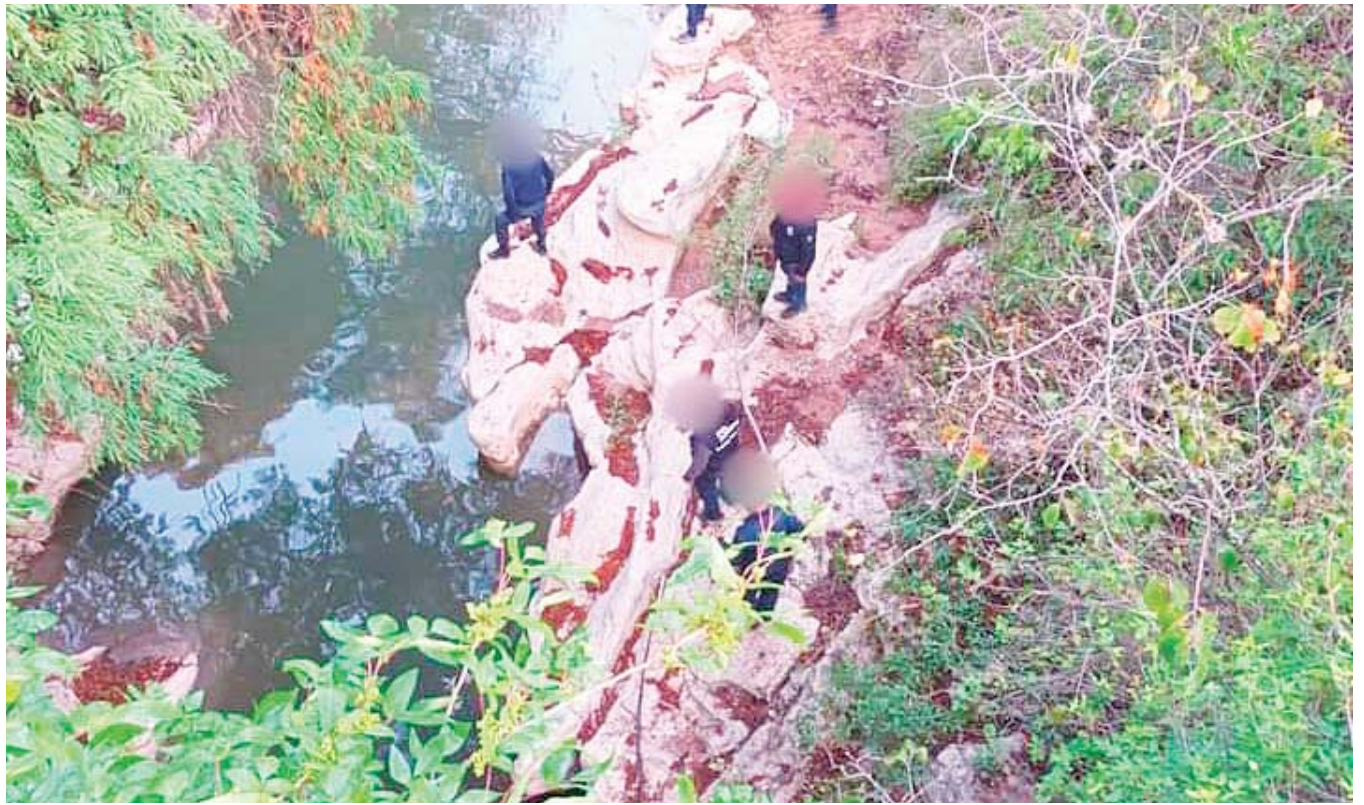
Vecinos y autoridades realizaron brigadas de búsqueda.