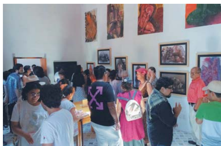
Las piezas ahondan en la exploración que ha hecho con el dibujo.

bién suceden en otros universos, en las plantas, en los animales y eso lo hace todavía más amplio, en este caso enfocarse solamente en la figura humana, no como un dibujo de representación, sino una interpretación no naturalista de las poses, los gestos y las corporeidades involucradas", detalla.