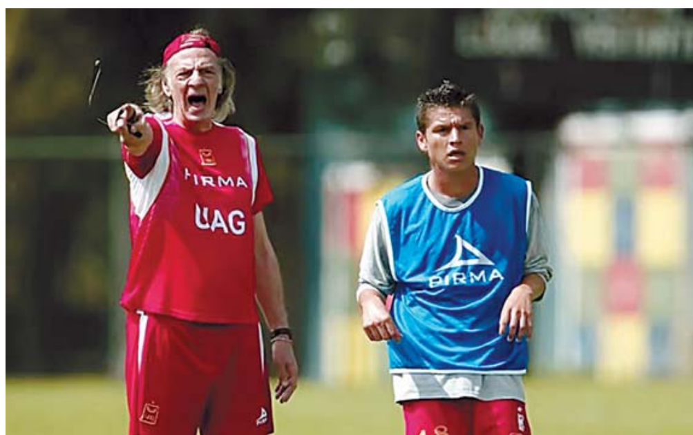
■ En México, Menotti dirigió a Tecos y Puebla, además de la selección mexicana.

Además, Menotti también fue parte de la Selección Nacional de México por un breve momento durante 1991, aunque tam-