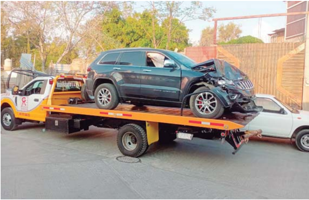
El Jeep fue asegurado para las investigaciones correspondientes.