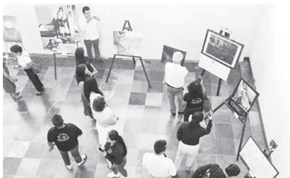
■ La muestra colectiva fue inaugurada en las instalaciones del Congreso de Oaxaca.

Por medio de esta exposición pictórica, los autores quieren recordar a quienes se encuentran padeciendo