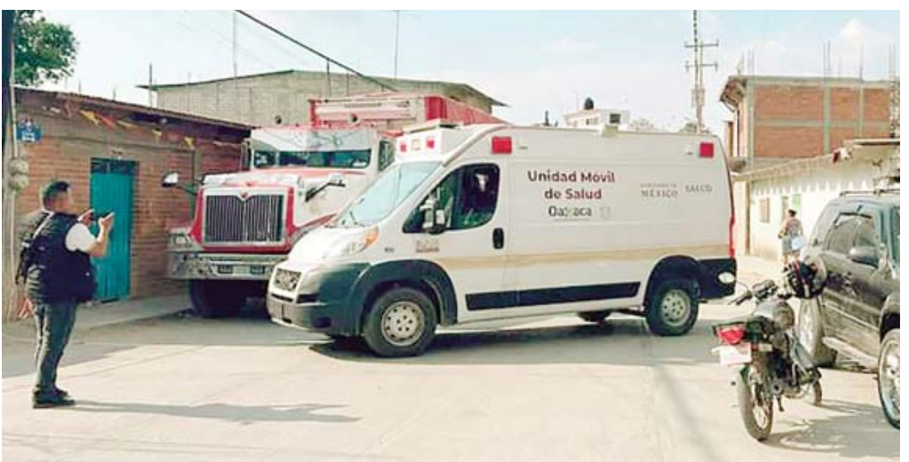
Una ambulancia llegó para intentar auxiliar a la mujer.

El dolor y la rabia se hicieron sentir en la comu-