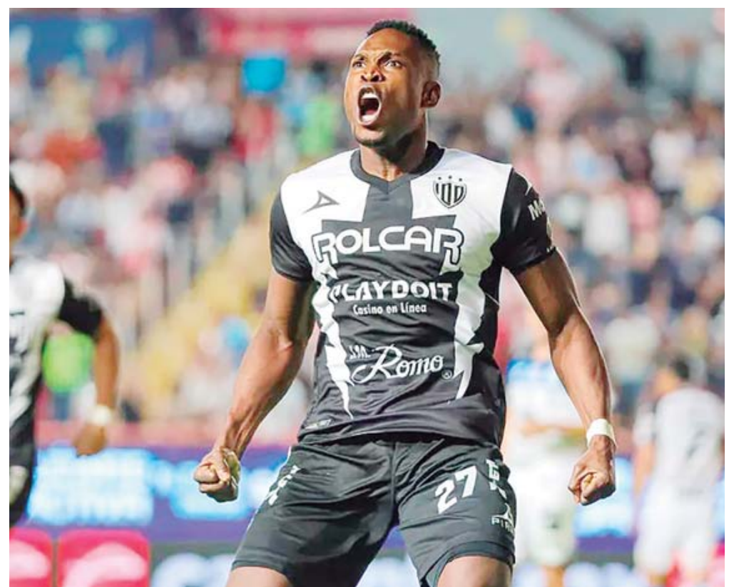
■ Necaxa aprovechó su localía y dejó en la lona a Querétaro.