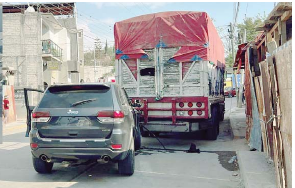
La mujer perdió la vida al instante, ante la mirada de varios testigos.

tos que culminaron en la tragedia, mientras exigían justicia para la víctima y castigo para el responsable.