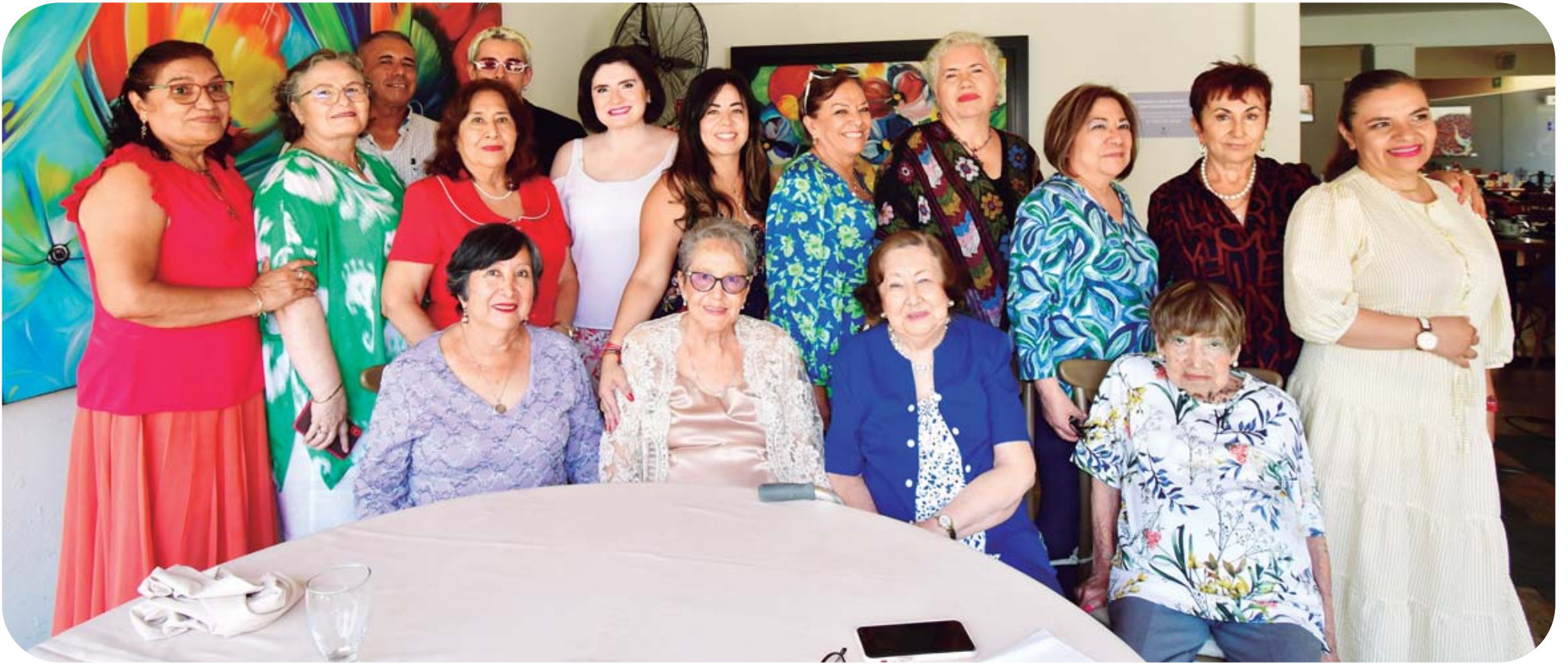
Los invitados se dieron cita en un restaurante del norte de esta bella ciudad, donde disfrutaron de un rico desayuno.

El bambú de la suerte es una de las plantas para la abundancia que no requiere mucho mantenimiento y se adapta perfecto al interior. Es uno de los favoritos en el feng shui para atraer buena suerte y energía positiva, pero también es económico y requiere cantidades moderadas de luz y agua, por lo que es muy fácil de cuidar.