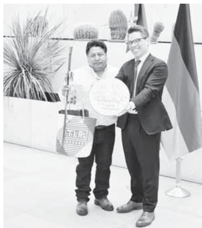
■ Los directivos del Museo Etnológico agradecieron a los delegados su visita.

de sus gobernantes. Su particular historia se encuentra registrada en 13 lienzos y códices, pero debido a una historia de saqueo, únicamente 5 de ellos se encuentran bajo el resguardo de algunas comunidades. Durante la época colonial, la lengua ngigua-ngiba o chocholteca, fue una de las cuatro lenguas de Oaxaca con tradición de escribas, aunque paradójicamente, hoy se encuentra en vías de