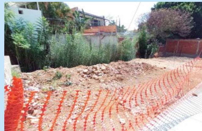
■ Terreno invadido junto a la capilla.

denta del comvive, refirió que aunque han acudido con el ayuntamiento, áreas como Agencias y Colonias, así como Obras Públicas, han sido omisas e incluso han respaldado a la supuesta propietaria al señalar que tiene permiso para construir.