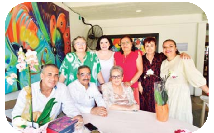
Muy contenta escuchó las felicitaciones de sus seres queridos.