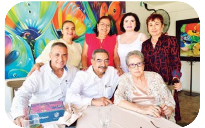
Recibió muy contenta los apapachos de toda su familia.