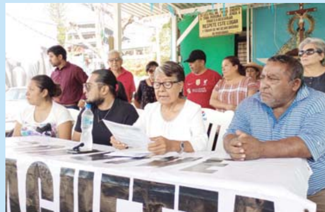
■ Vecinos de la colonia Guelaguetza.

De acuerdo con el comité, hace unos meses que una particular de