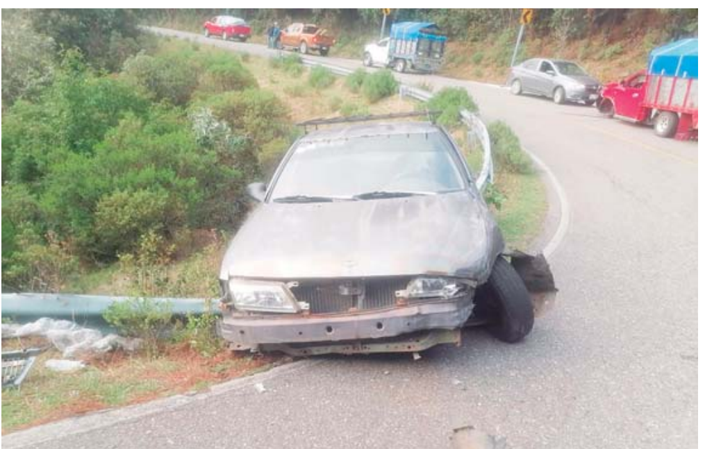
El accidente ocurrió en una curva.