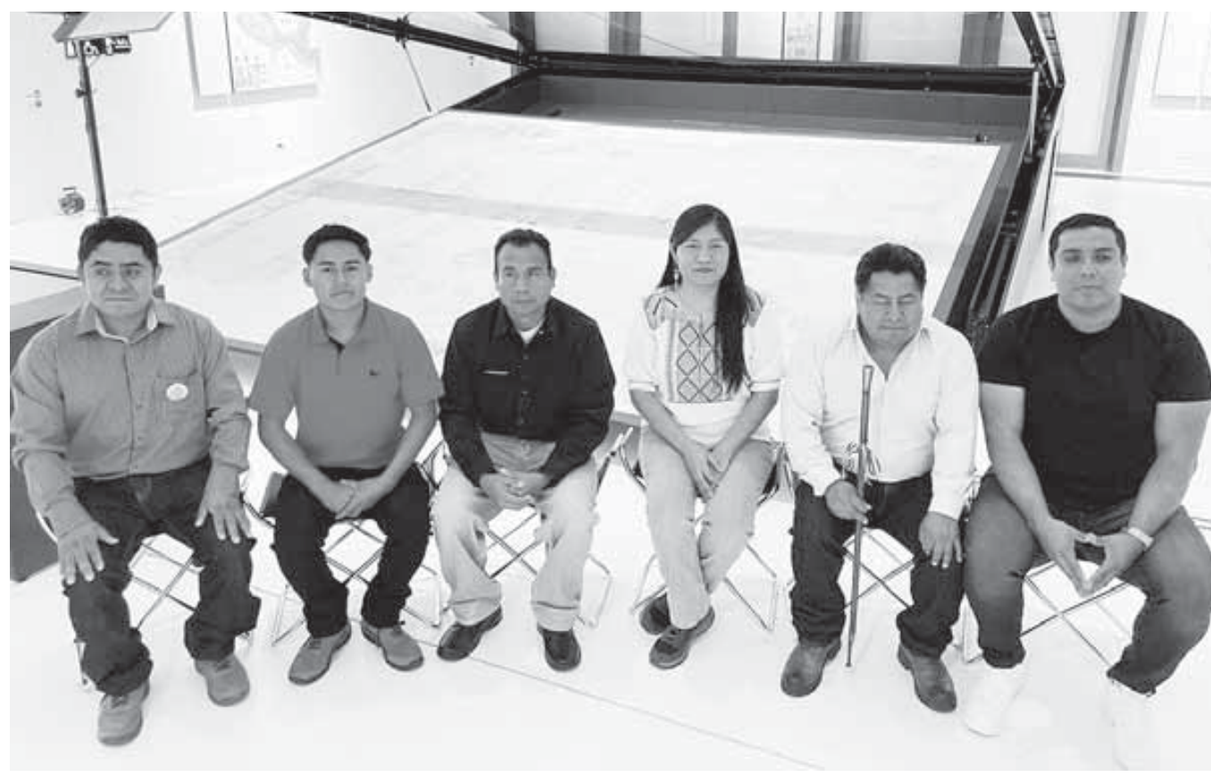
■ El lienzo da la certeza de lo grande que fue la cultura chocholteca.

El Pueblo Indígena Chocholteco se conforma de 19 municipios y 67 comunidades ngiguangiba. En tiempos prehispánicos, Coixtlahuaca fue una de las ciudades más grandes de Oaxaca, México, llegando a su mayor extensión hacia mediados del siglo XV. Fue famosa por su gran mercado y por el prestigio tolteca