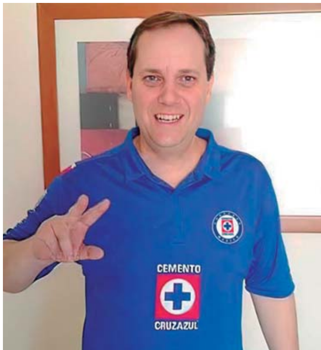
■ El comentarista deportivo perdió la vida tras una larga lucha contra un cáncer agresivo.