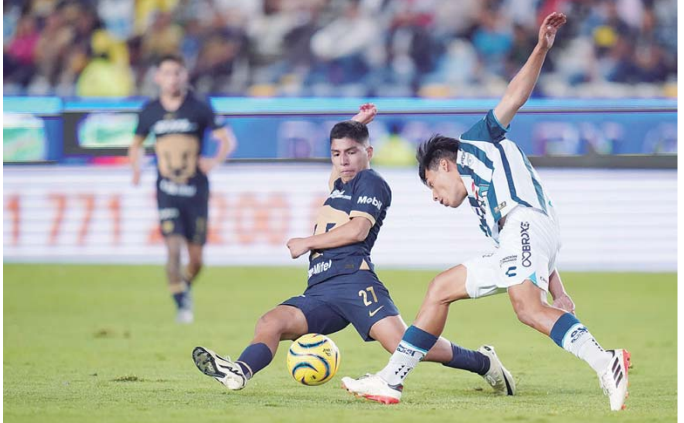
■ Pumas se convirtió en el séptimo invitado a la Liguilla.