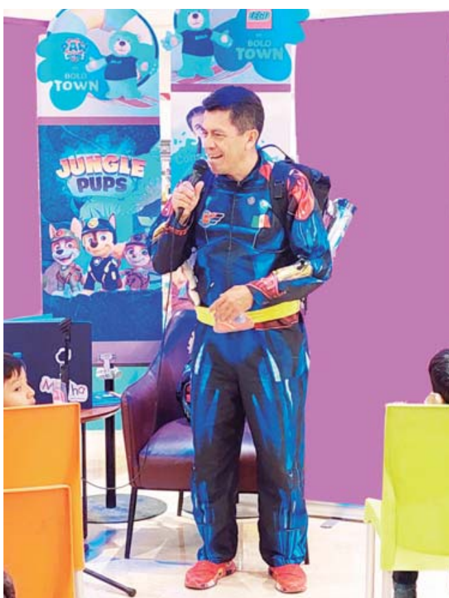
El Capitán de la Nave de Tik Tak deleitó a los pequeños con la lectura de cuentos y actividades lúdicas.

Entre risas y mucha diversión, los niños celebraron su día con la mejor compañía y el cariño de sus