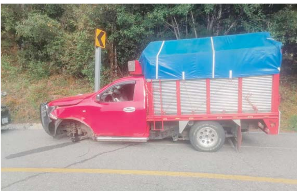
La camioneta perdió un neumático por el fuerte golpe.