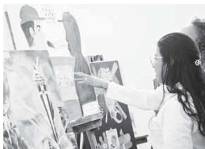
■ La exposición está abierta al público y el acceso es gratuito.

Se trata de piezas elaboradas con la técnica de acuarela, óleo y lápiz, a través de las cuales las y los jóvenes que están en rehabilitación hacen énfasis en el proceso de restauración