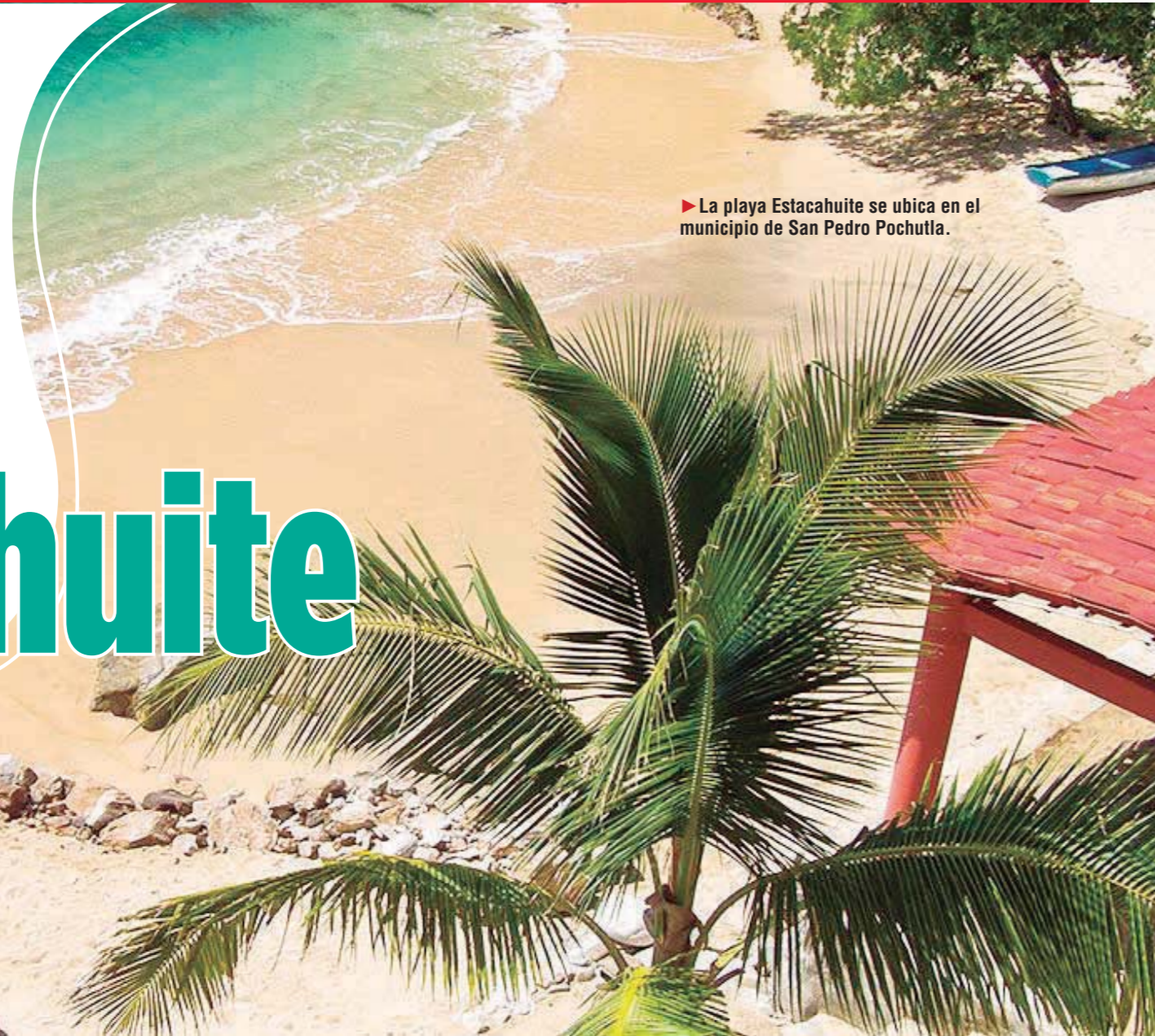
► La playa Estacahuite se ubica en el municipio de San Pedro Pochutla.