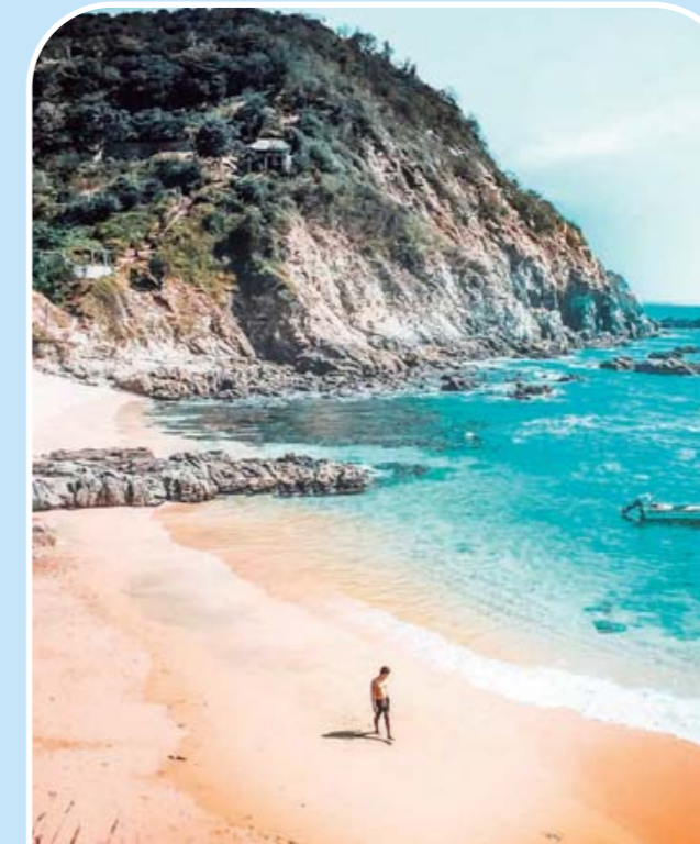
► Caminar por su playa es el momento más reconfortante, mientras observas el atardecer sobre el tibio manto de arena.