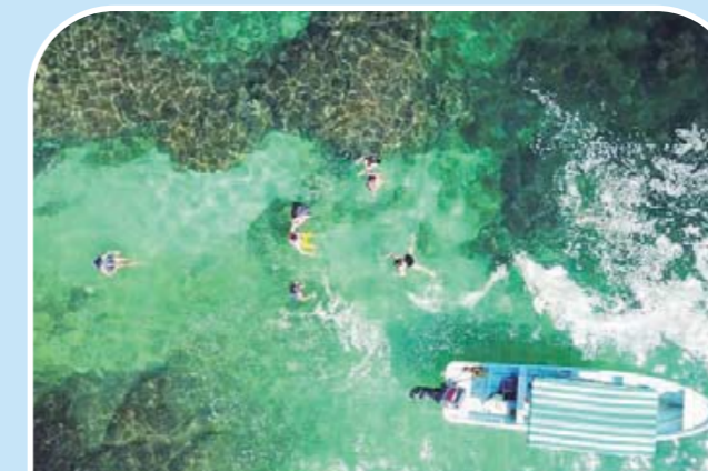
► Aquí podrás nadar, ver peces de colores, pasear en lancha y relajarte hasta que la tensión se vaya de tu cuerpo.