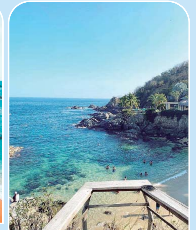
► ¡Sin duda, un lugar paradisiaco!