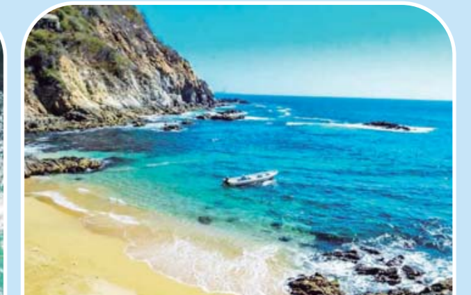
► Se trata de un sitio tranquilo donde podrás ver, respirar y sentir todo lo que la playa en su conjunto te brinda.