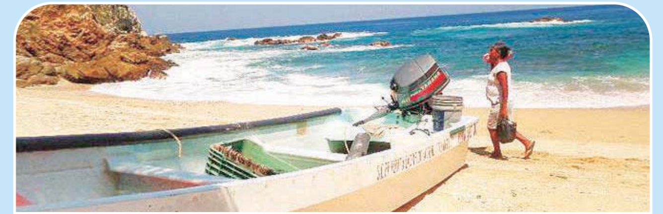
► Los paseos en lancha o kayak son populares entre los visitantes.