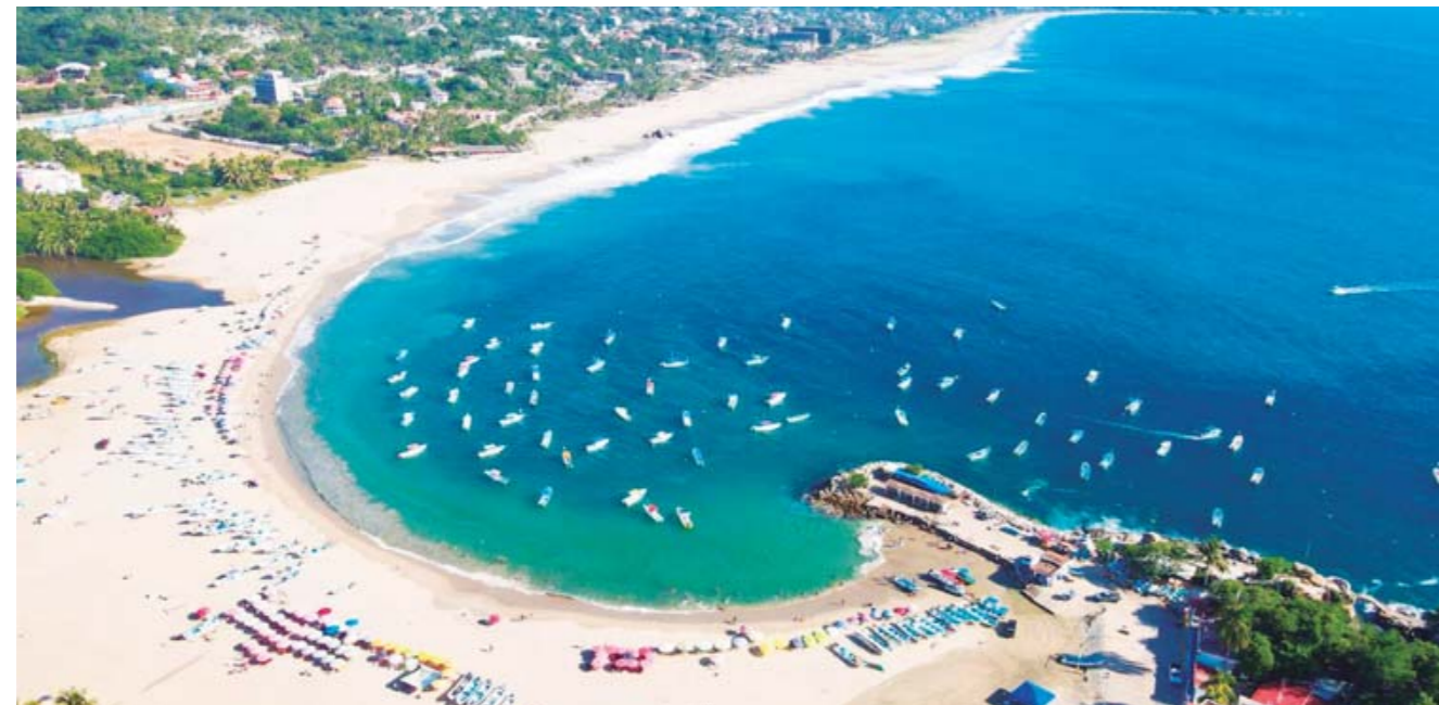
► Las altas temperaturas registradas en los últimos días en todo el estado han generado varios casos de insolación.

ciones propicias para sufrir insolación. Al regreso del recorrido, el guía turístico notó que una mujer y un menor de edad comenzaban a mostrar signos de insolación, como mareos y sudoración excesiva.