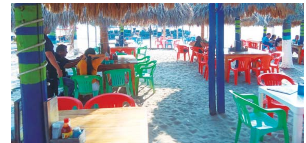
► Los turistas fueron resguardados bajo una palapa, donde se les proporcionó hidratación.

Finalmente, este incidente subraya la importancia de tomar precauciones frente a las altas temperaturas para evitar situaciones de emergencia.