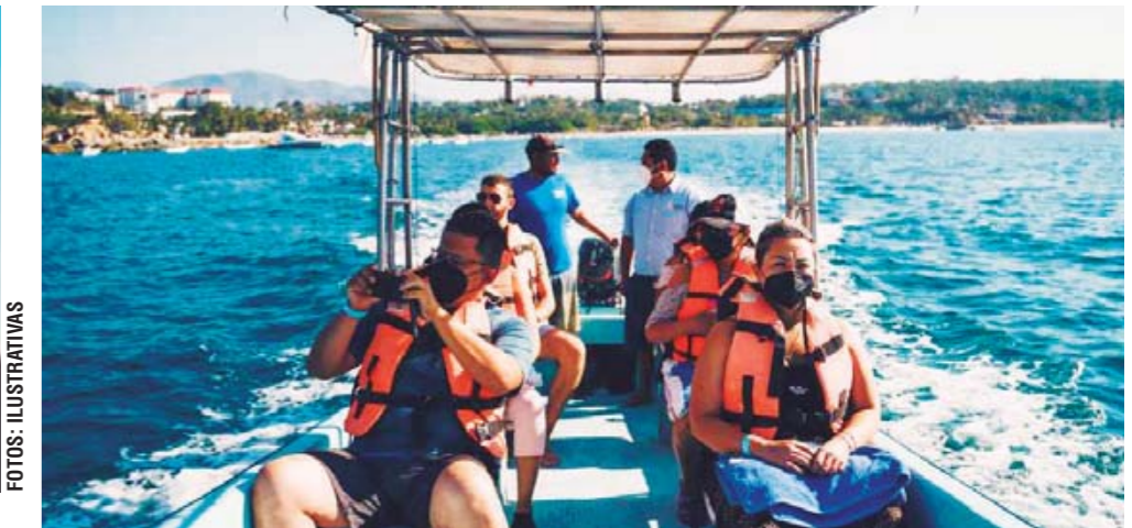
► Las dos personas afectadas viajaban en una embarcación cuando sufrieron de insolación.

ger la salud de la población y de los turistas: *Evitar la exposición a los rayos solares, sobre