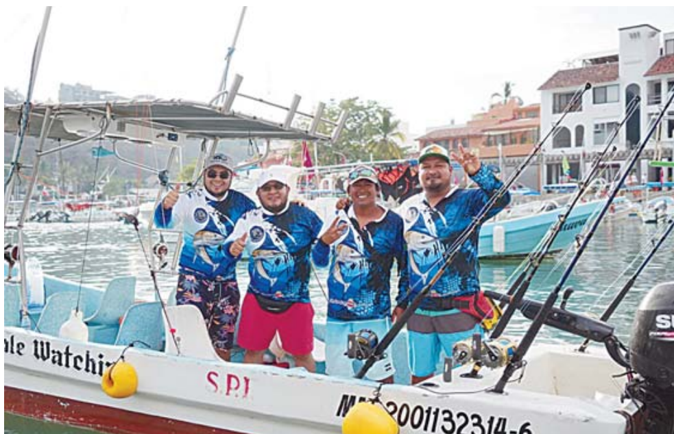
► Participaron equipos locales, nacionales e internacionales.