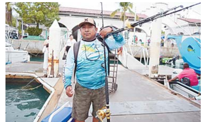
► Reafirman sus compromiso para continuar promoviendo un deporte respetuoso con el medio ambiente.

El torneo no sólo promueve la pesca deportiva,