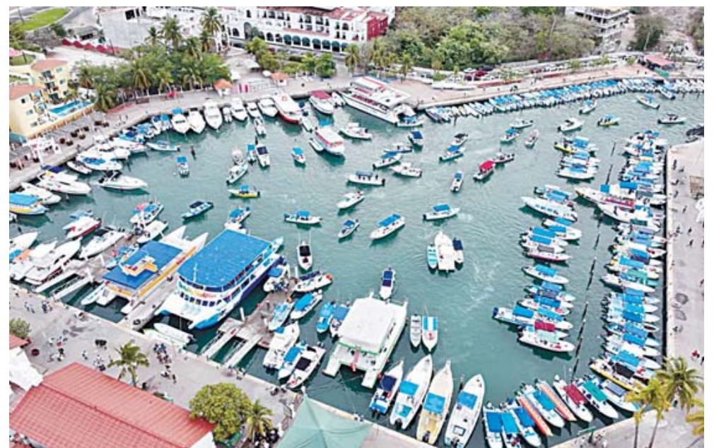
► Este torneo, que se ha convertido en un referente a nivel mundial.