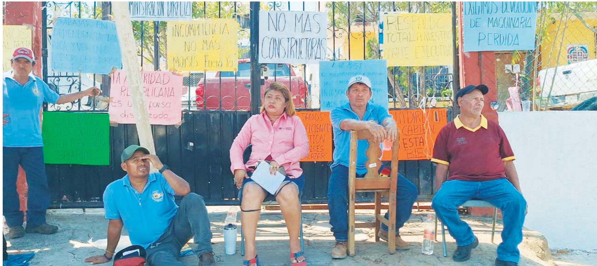
▶ Trabajadores de Caminos Bienestar realizó una jornada de brazos caídos en forma de protesta.

Tercera Poniente No. 303 Col. Centro Puerto Escondido Oax. Tel. 58 201 30 5821894 mafepsa_92@hotmail.com