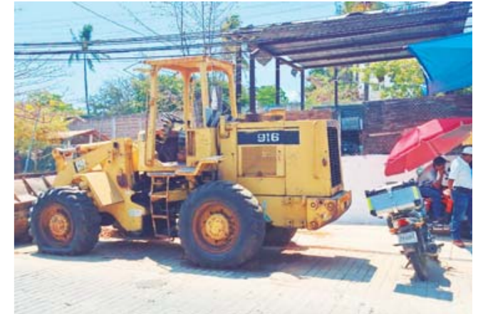
▶ La maquinaria que quedó ya luce obsoleta.

continuarán con su jornada de brazos caídos hasta que el gobierno estatal los escuche y les brinde una