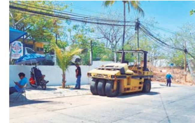
▶ Exigen que les sea devuelta la maquinaria que se llevaron.