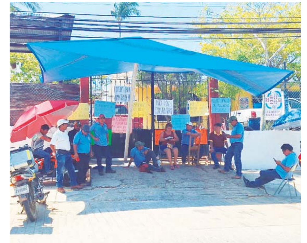
▶ Mantendrán su forma de protesta hasta que el gobierno estatal los escuche.

¡NOS MUDAMOS! AHORA NOS PUEDES ENCONTRAR EN CALLE TERCERA PONIENTE LOCAL 7, ESQUINA CON CARRETERA COSTERA CENTRO, CP 71983 PUERTO ESCONDIDO, OAXACA