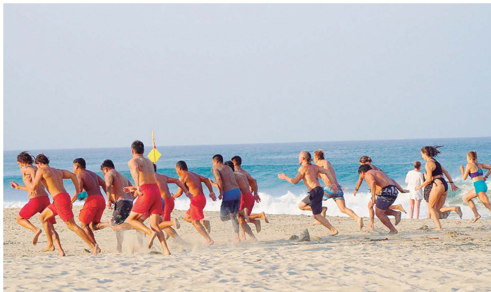
► Los salvavidas de Puerto Escondido cuentan con poco material de rescate para realizar su labor.

niña, la moto acuática dejó de funcionar. Un salvavidas continuó a nado, y otro más