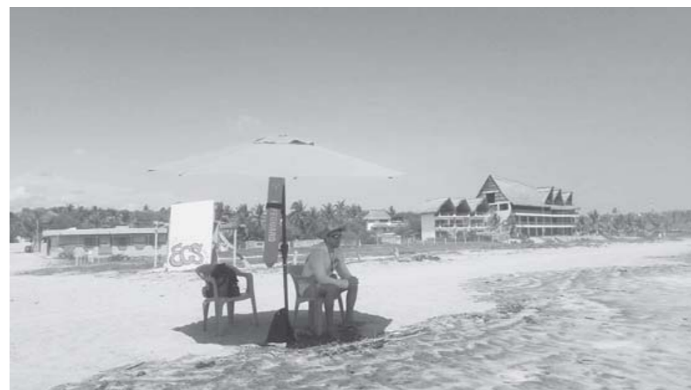
► Vigilan las playas de manera austera, pues el gobierno no los ha apoyado.