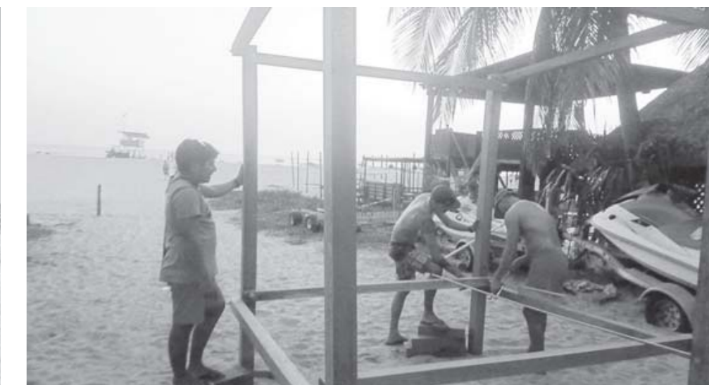
► Sólo cuentan con una moto acuática, la cual se encuentra descompuesta.

por lo que se acercó al lugar con su embarcación y apoyó a los salva-