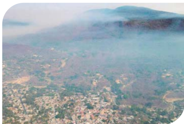
► Comunidades de Huatulco, Pochutla y Pluma Hidalgo se ven