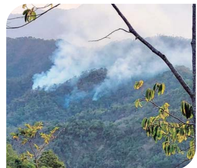
► El humo logra verse desde distintos puntos.

De acuerdo al reporte emitido por Protección Civil y Bomberos Huatulco, continúan con los trabajos de control, combate y liquidación del incendio ubicado en dos frentes: uno en el paraje