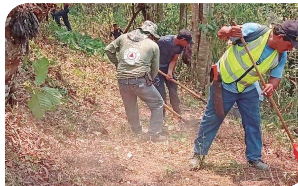
► Se coordinan acciones en la lucha contra el fuego.