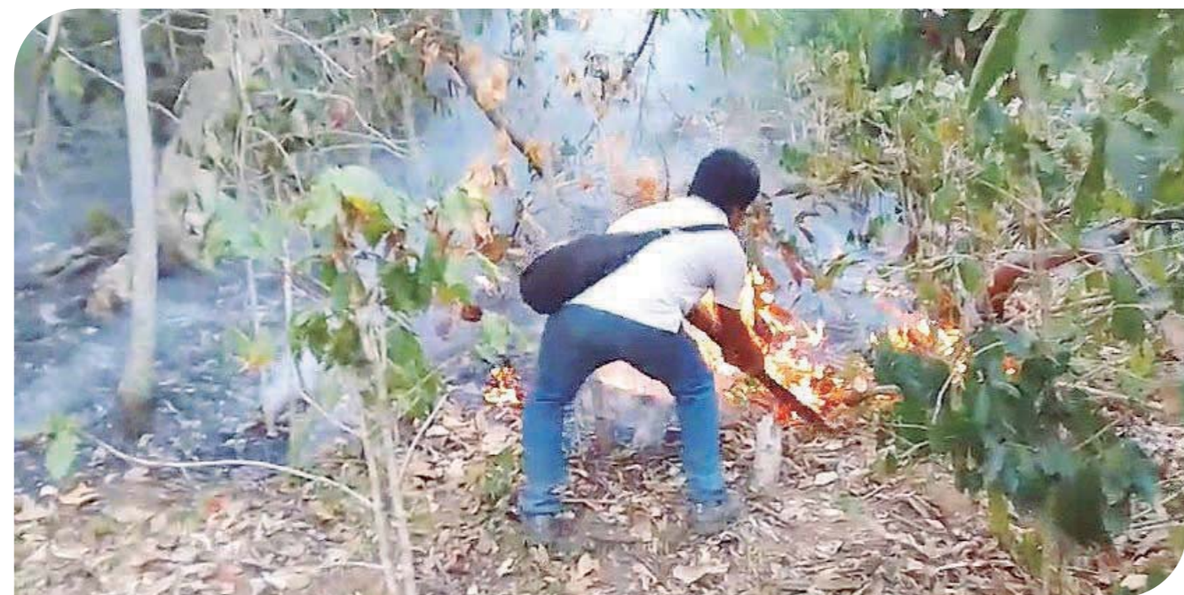
► El fuego revivió el pasado sábado.

El intermunicipal se ubica en Santa María Huatulco, en la zona de Apan-