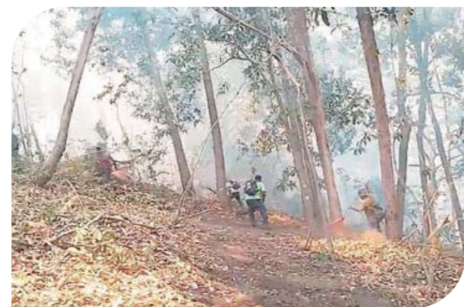
► La lumbre destruye flora y fauna endémica.