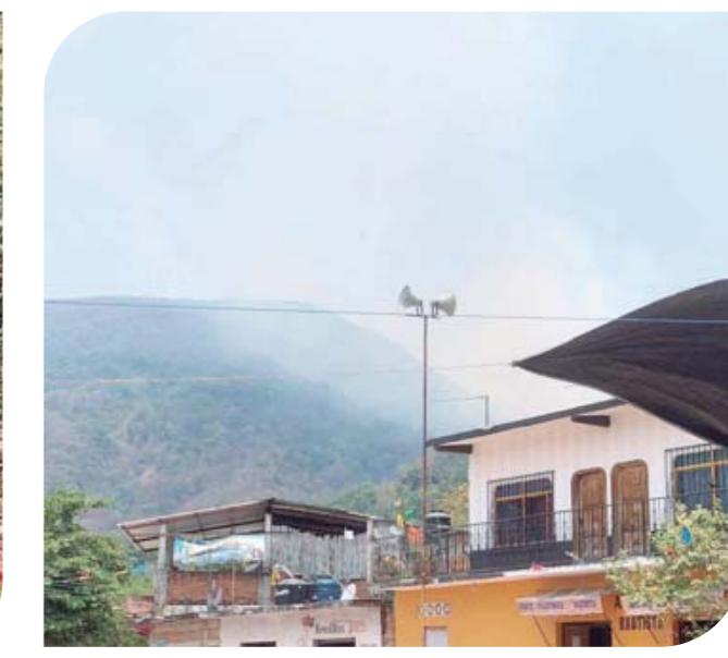
► Piden a la población no alarmarse.

conocido como Apanguito (rumbo a la comunidad de Magdalena) y el frente de la comunidad de Benito Juárez.