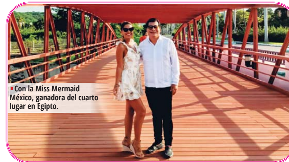
■ Con la Miss Mermaid México, ganadora del cuarto lugar en Egipto.

¡NOS MUDAMOS! AHORA NOS PUEDES ENCONTRAR EN CALLE TERCERA PONIENTE LOCAL 7, ESQUINA CON CARRETERA COSTERA CENTRO, CP 71983 PUERTO ESCONDIDO, OAXACA