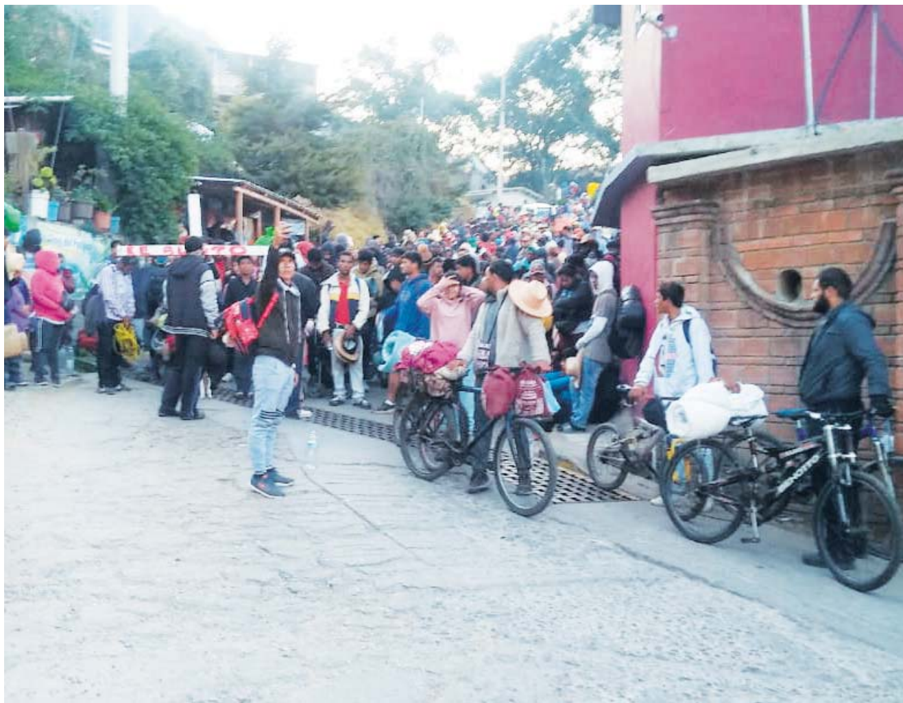
► En el contingente hay presencia de niñas, niños y adolescentes.

presencia de niñas, niños y adolescentes, a quienes se les ha brindado aten-