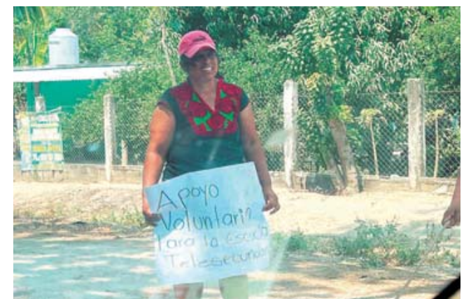
► Piden el apoyo de automovilistas y ciudadanía.