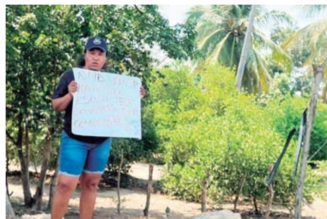
► Portaron pancartas en mano.