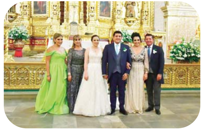
■ Los familiares de los enamorados otorgaron su bendición a este feliz matrimonio.