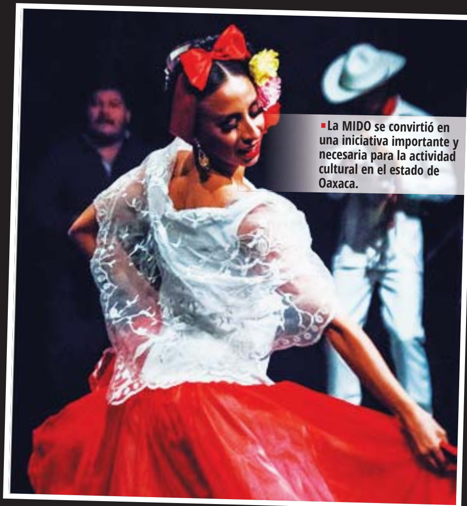
La MIDO se convirtió en una iniciativa importante y necesaria para la actividad cultural en el estado de Oaxaca.

"La Casa del Pueblo abre sus puertas, de la mano de nuestro instructor, para apoyar a la danza y seguir abonando a la riqueza cultural de nuestro estado", se leía en la publicación de la Casa de la Cultura el 11 de enero del año pasado.