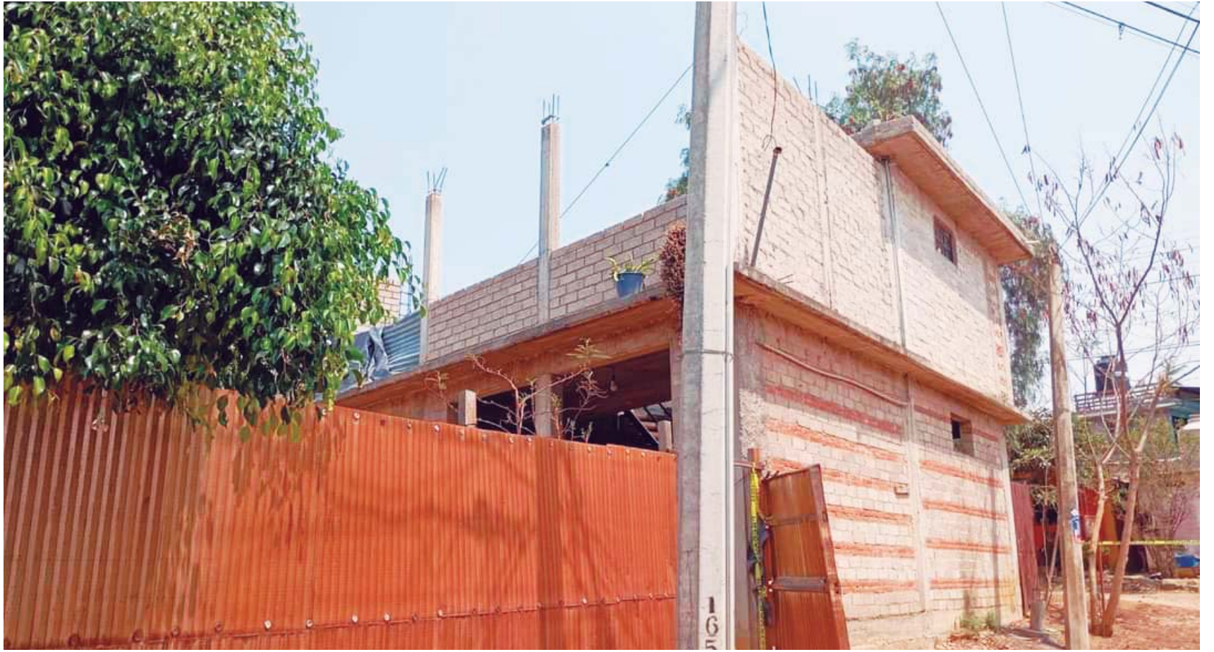
La familia vivía en el paraje La Cortina, en Trinidad de Viguera.