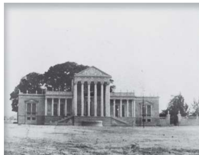
La escuela llegó a la ex Hacienda de Aguilera en febrero de 1968.