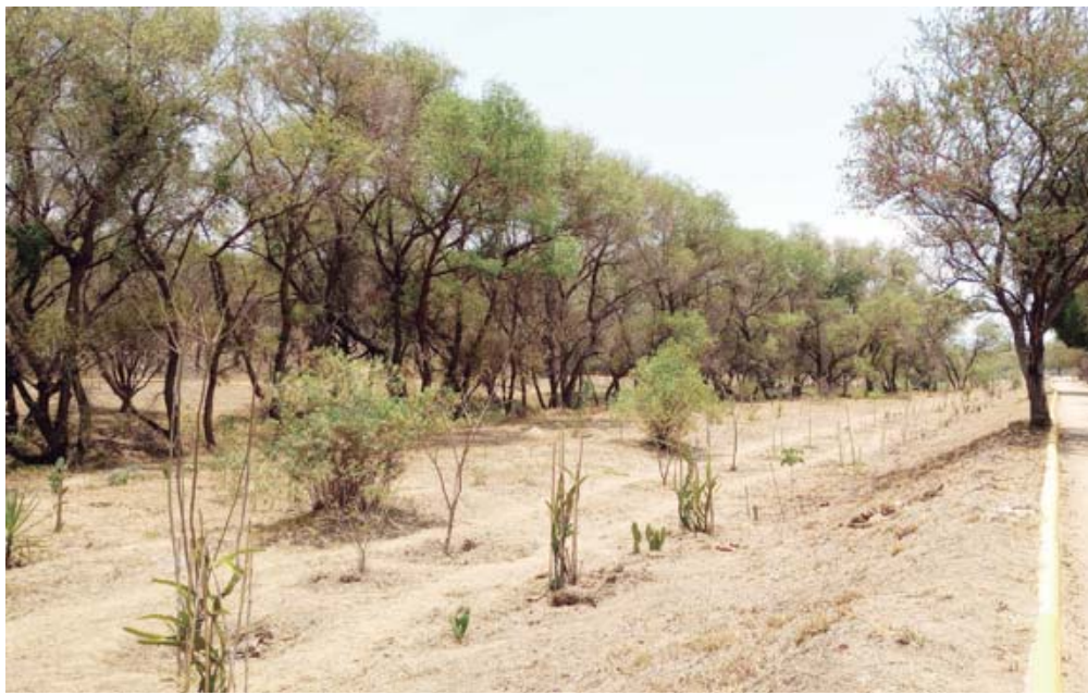
Integrantes de la asociación civil La Voz de la Montaña Ancestral y del colectivo Hacer Tequio, reforestan las riberas del río Atoyac.

El compartir los alimentos, el bordado y la convivencia fueron parte de esta jornada en torno a la presentación de la pieza colectiva y textil “Memorias de un río que no perece, Atoyac -Oaxaca”, con la que durante varios meses se efectuaron sesiones en