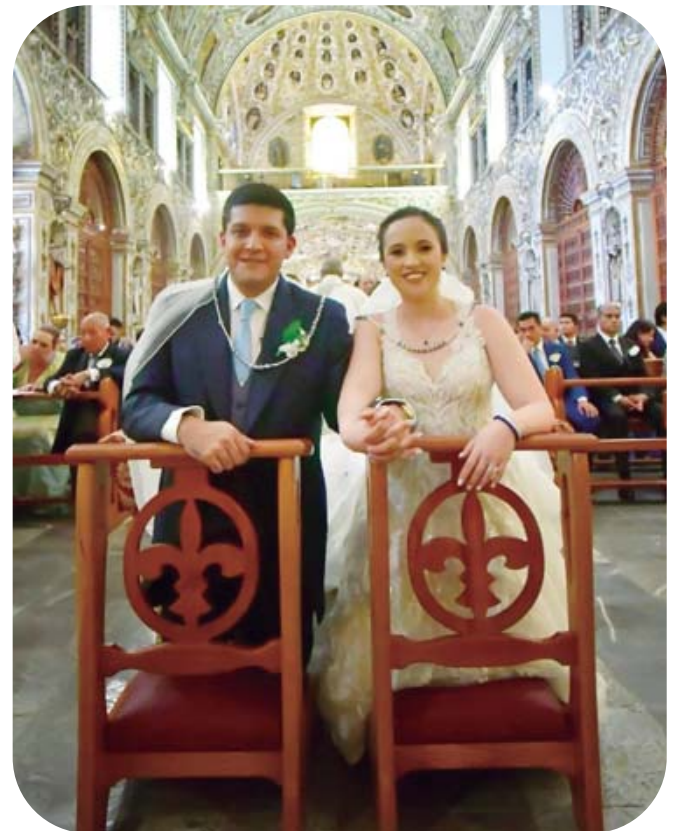
■ Muy felices los novios recibieron el sacramento del matrimonio.

La recepción se llevó a cabo en el Jardín etnobotánico, donde los recién casados recibieron las felicitaciones y buenos deseos de sus seres queridos.