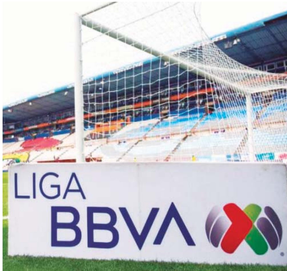
■ La Liguilla ya está a la vuelta de la esquina.

Trás de ellos se hallan Rayados, Tigres y Chivas, quienes lograron también colarse a la Liguilla, mostrándose como los últimos tres candidatos serios al título, en espera de los dos que puedan avanzar en el Play In