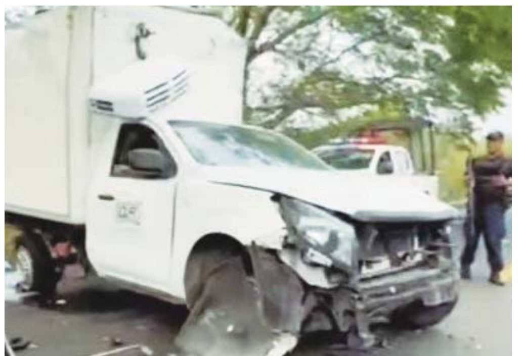
El saldo fue de dos heridos de gravedad y cuantiosos daños materiales.

rápida intervención de los paramédicos del Heroico Cuerpo de Bomberos de Juchitán. Además, elementos de la Policía Vial Municipal y Vial Estatal llegaron al lugar para brindar asistencia a las víctimas. Especialmente a los ocupantes de la camioneta azul, una familia residente en la novena sección, Cheguigo de Juchitán de Zaragoza. Cuyos dos integrantes más afectados fueron trasladados de urgencia a un hospital cercano.