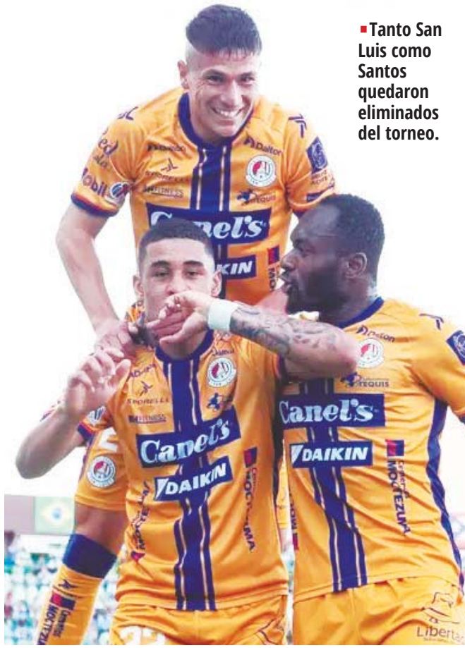
■ Tanto San Luis como Santos quedaron eliminados del torneo.

de un nuevo estrategia, mientras que Santos Laguna buscará levantarse de la mano de Nacho Ambríz, quien llegó a mitad de temporada y no pudo hacer mucho por rescatar al equipo.