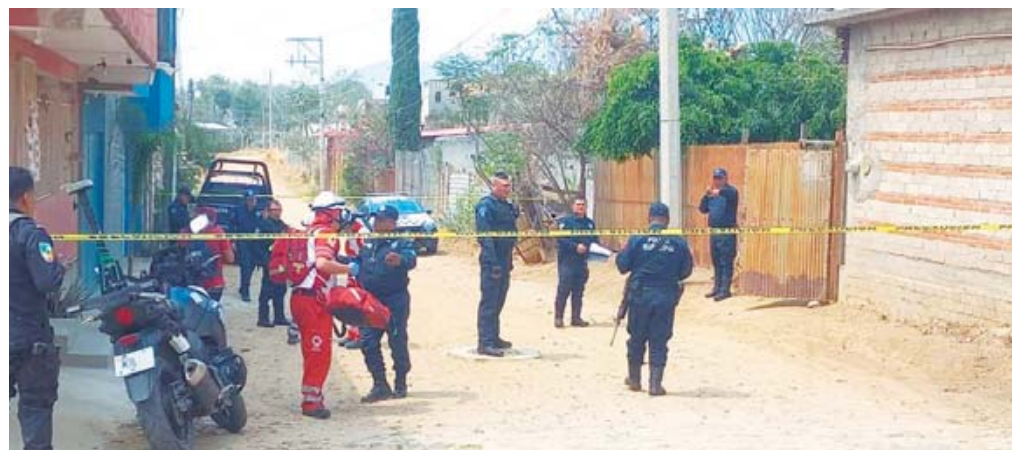
Se investiga ya el caso.

La Fiscalía General del Estado de Oaxaca (FGEO) están desplegando todos sus recursos para esclarecer los hechos y brindar respuestas a la familia devastada por la pérdida repentina de una familia entera dedicada al comercio en la Central de Abasto.