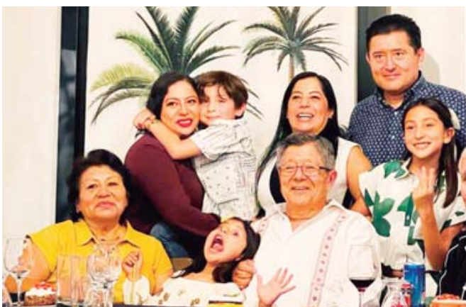
■ El festejado estuvo arropado por su hermosa familia.