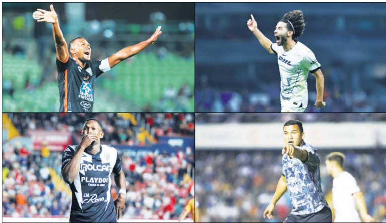
■ Cuatro equipos (Pachuca, Pumas, Necaxa y Querétaro) jugarán los Play-In.