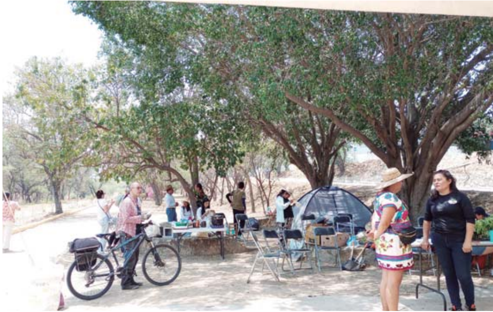
Presentan obra colectiva sobre las memorias del río Atoyac.

El colectivo Hacer Tequio y la asociación civil La Voz de la Montaña Ancestral realizan una jornada informativa, artística y cultural en la ribera del río Atoyac