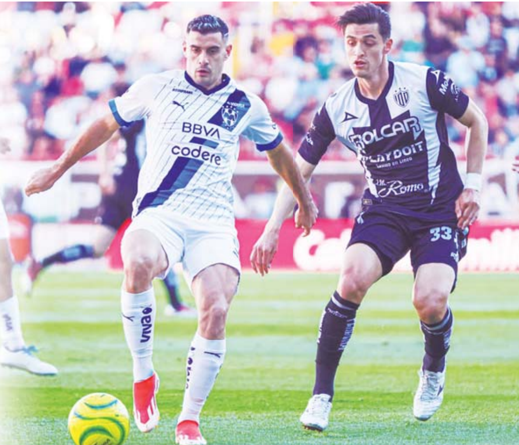
■ Monterrey mostró un soberbio nivel de juego.