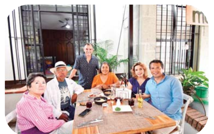
Amigos del artista pudieron admirar su obra llenas de texturas y colores que estarán expuestas en el restaurante El Capitán, ubicado en San Felipe del Agua.