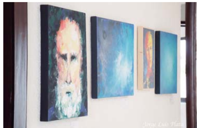
Creo realismos con dibujos bien definidos y con trazos.

"Descubrí que hay mucha tela de donde cortar", narra el artista con mucha emoción, "y es ahí donde aprendí que hay