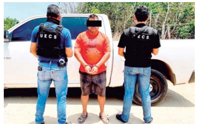
La Fiscalía ejecutó una orden de aprehensión contra E.L.M. y D.C.C.

La víctima fue interceptada por un grupo de personas el 18 de enero de 2023, en inmediaciones del paraje Cerro de la Vieja de Bajos de Chila en San Pedro Mixtepec.