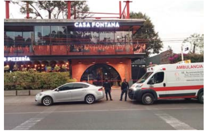
Uno de los proyectiles lesionó a otra persona con un rozón en la pierna.

Minutos después, al lugar arribaron paramédicos acudieron a bordo de la ambulancia de San