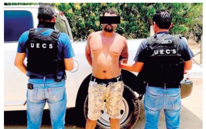
Exigieron una suma de dinero no especificada a los familiares de la víctima.

orden de aprehensión contra E.L.M., y D.C.C., quienes fueron detenidos para