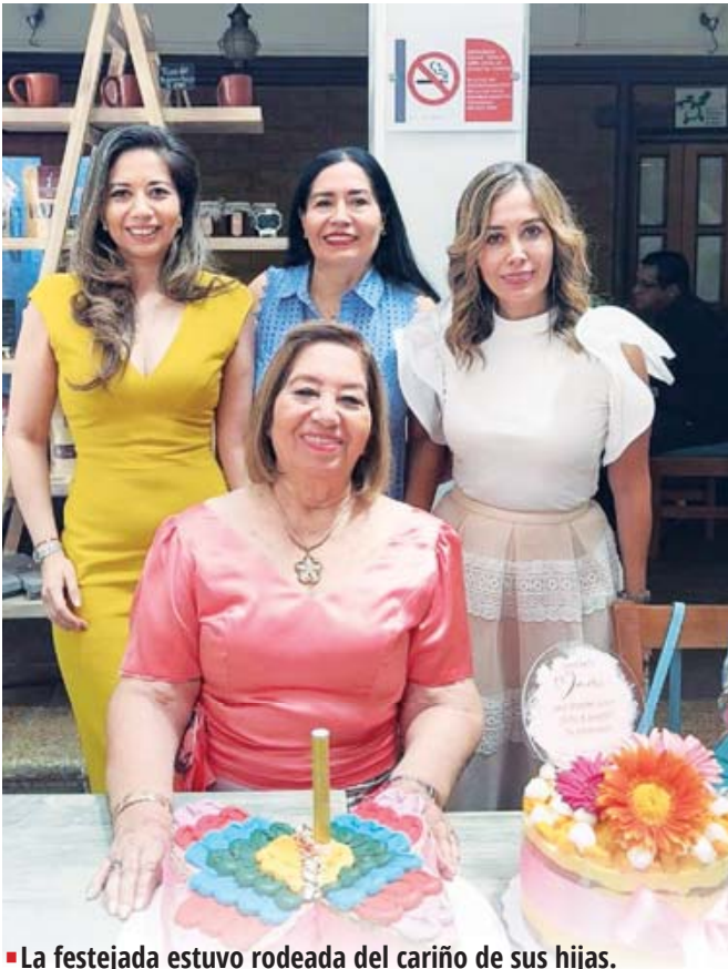
La festejada estuvo rodeada del cariño de sus hijas.