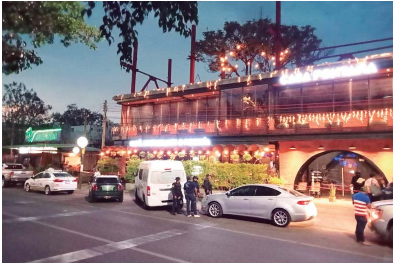
El hombre de 59 años fue asesinado a tiros en el interior del restaurante Casa Fontana en la Vía Federal 190.

A petición de la parte afectada, el detenido fue consignado a la autoridad ministerial para determinar su situación jurídica.