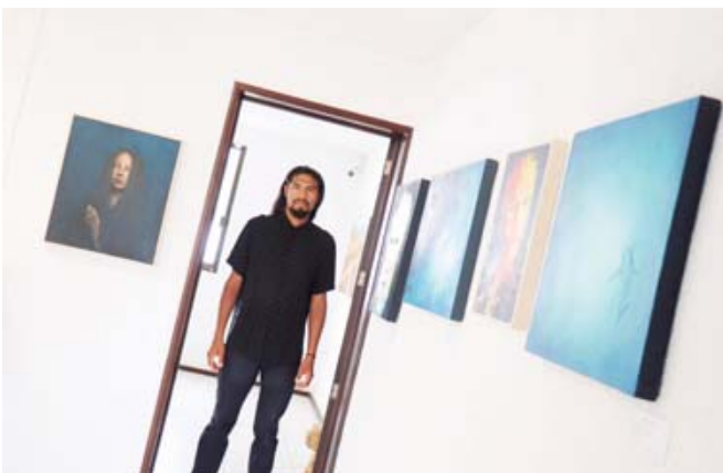
Desde muy joven el artista gusta mucho de experimentar con distintos estilos.

to Juárez de Oaxaca y en la Casa de la Cultura, donde aprendió del maestro Carlos Rubio, desde ahí nació su fascinación del mundo del arte desde sus orígenes, su admiración por los primeros pintores y por conocer los conflictos y métodos para crear imágenes que al