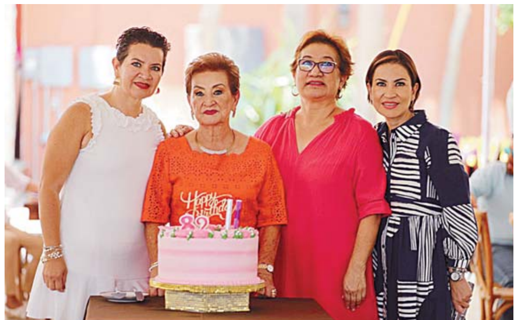
■ Un ramillete de hermosas mujeres, madre e hijas.