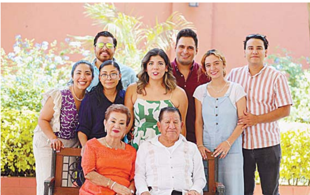
■ Hermosa foto familiar con algunos de sus nietos.