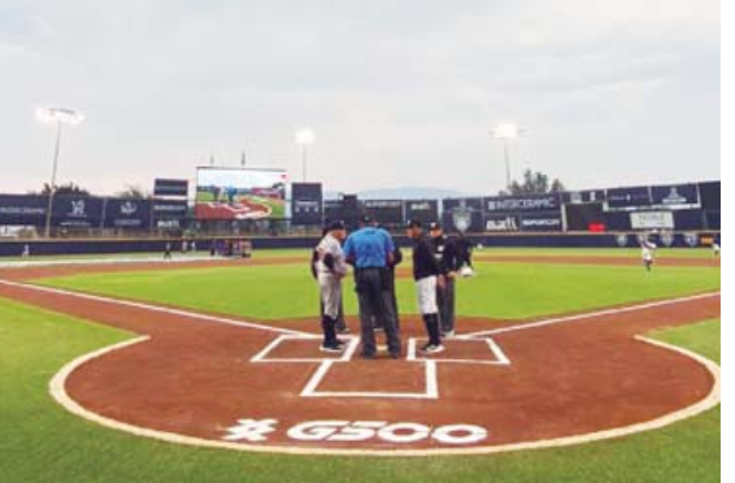
Las acciones recibieron una buena asistencia de la afición que se hizo presente en el Eduardo Vasconcelos.

Guerreros buscó la reacción, pero ésta ya no llegó, quedándose los felinos con la victoria.