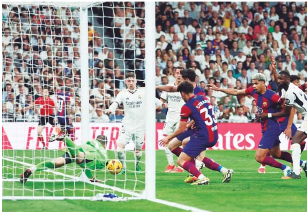
El Barcelona salió derrotado con la anulación polémica de un presunto gol.

encontrar la igualdad con Vinícius, que aprovechó una discutida falta en el área de los visitantes sobre Lucas Vázquez para cambiarla por gol desde el punto del penal. Un 1-1 rápido que empujaba al Merengue a ir por más.