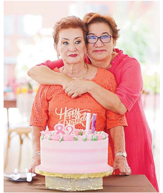
■ Con su hija Carmelita

En familia y con sus amistades más cercanas fue como celebró su cumpleaños