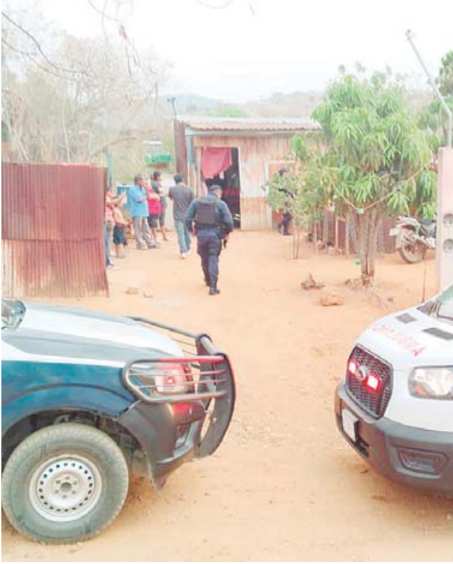
■ Fue atacado a un costado de la cancha de la colonia La Gotera, Zaachila.