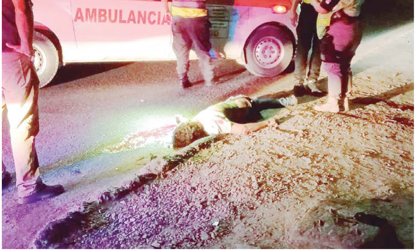
■ Personal médico confirmó que el hombre ya no presentaba signos vitales.