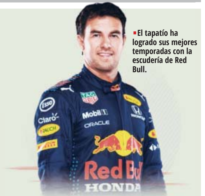
El tapatío ha logrado sus mejores temporadas con la escudería de Red Bull.

El triunfo del Madrid termina casi que sentencia La Liga, dándole una ventaja de 11 puntos al Merengue sobre el Barcelona a falta de 18 por jugar.