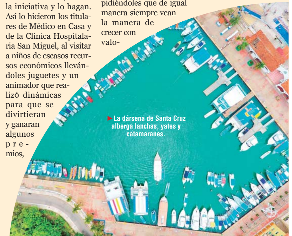
► La dársena de Santa Cruz alberga lanchas, yates y catamaranes.