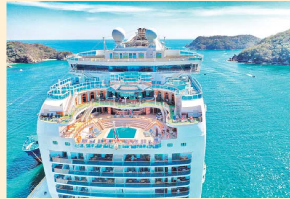
► Bellos y grandes cruceros arriban a Santa Cruz Huatulco y descienden personas de todas las nacionalidades.

nes hacen algunas escalas en las principales playas y las más tranquilas para poder practicar snorkel, otra escala algo más larga es para que los turistas puedan tomar sus alimentos en alguno de los restaurantes de las playas: La Entrega, El Maguey y San Agustín.