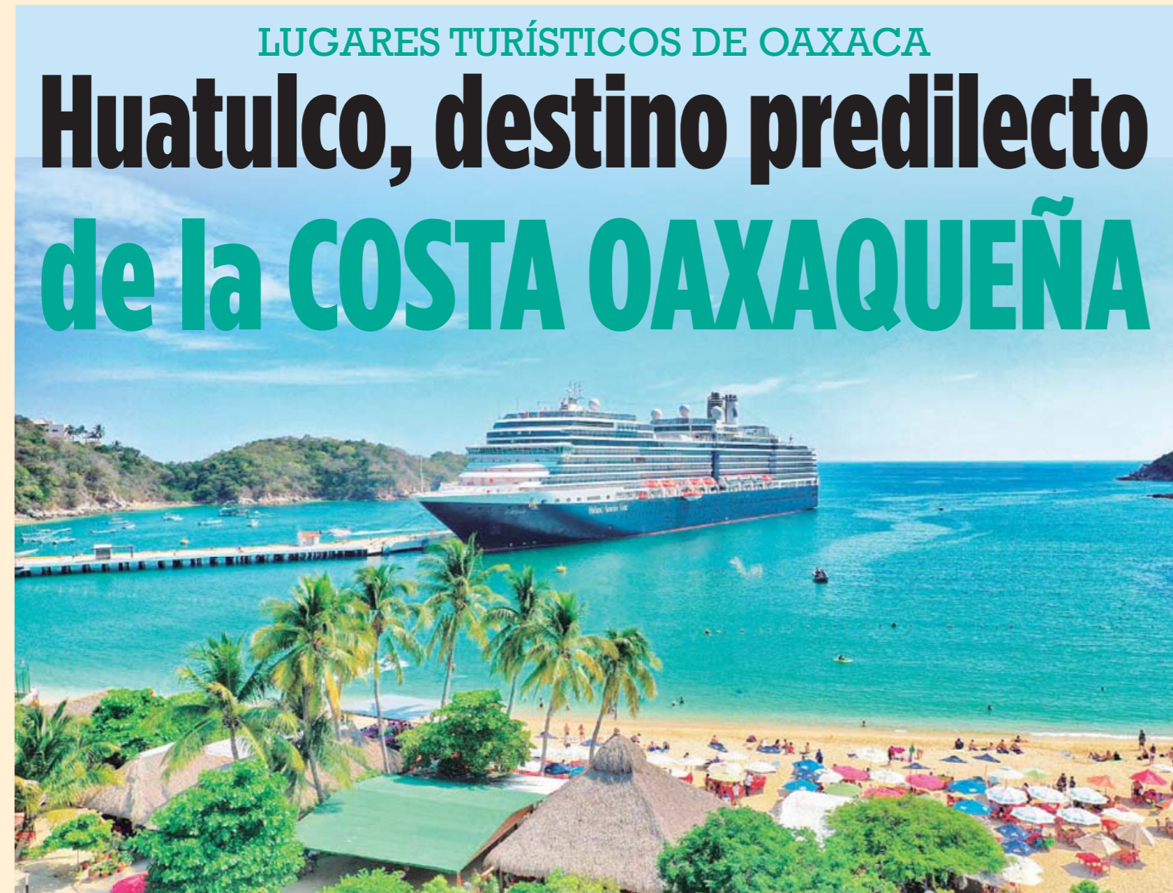
► Santa Cruz Huatulco tiene su muelle de cruceros.

Las vías de comunicación terrestres actualmente son diversas, por lo que se puede llegar por autobús desde la capital del país o de la capital del Estado, así como de otros Estados de la República, también por las llamadas urvans,