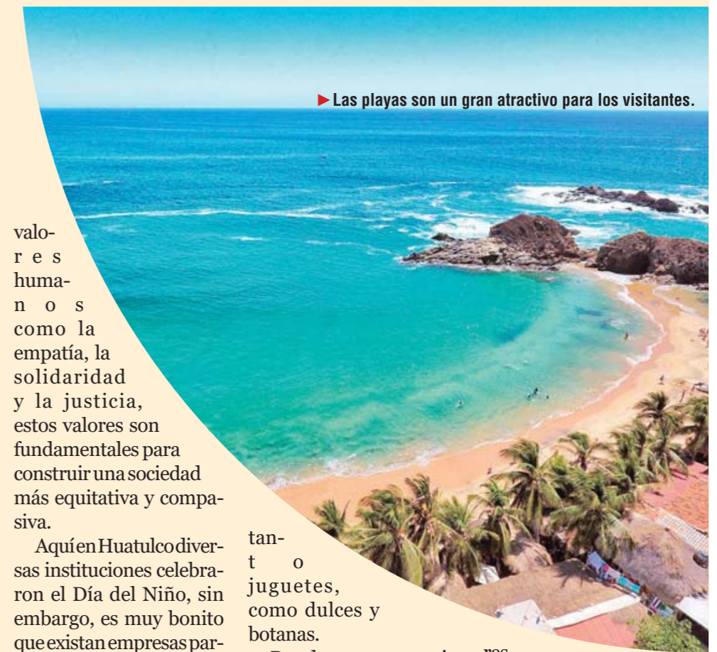
► Las playas son un gran atractivo para los visitantes.