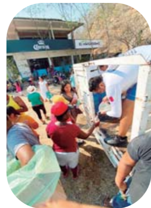
▶ Se espera que este martes los migrantes arriben al municipio de Huatulco.

Con el apoyo de la sociedad, los organizadores de