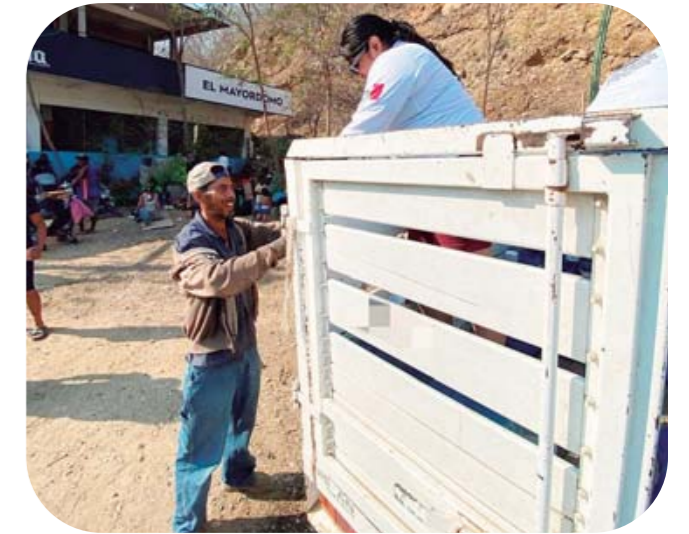
▶ Una noble acción.