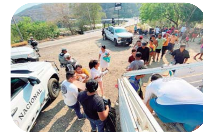
▶ Desde el pasado 24 de marzo salieron de Tapachula, Chiapas.

En San Pedro Pochutla, la autoridad municipal y la