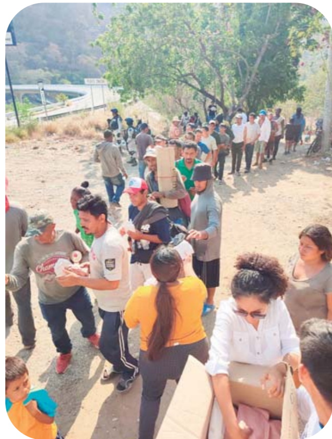
▶ A su paso por la Costa, los indocumentados encuentran agua, comida y un lugar para descansar.

27 de abril, los caminantes continuaron su trayecto por la carretera federal y al mediodía arribaron a la comunidad de El Coyul, Huamelula, los pobladores y autoridad auxiliar les proporcionaron y acondicionaron un lugar en donde pudieran descansar y pasar la noche: además les auxiliaron con alimentación e hidratación.