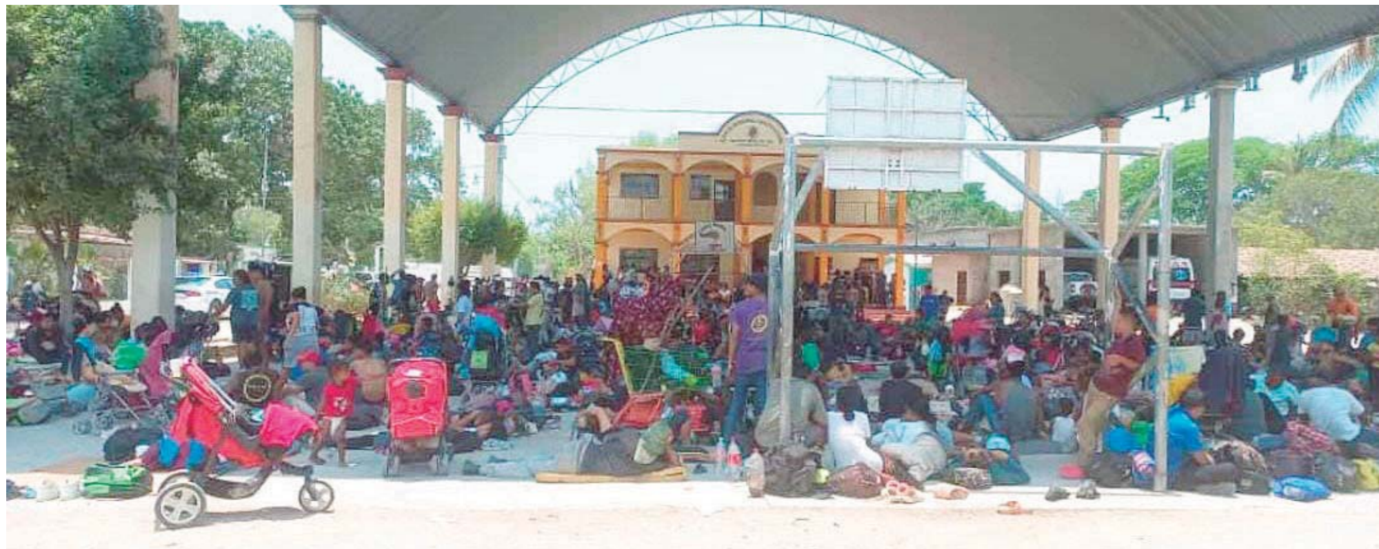
► Albergue improvisado en El Coyul, San Pedro Huamelula.

Salvador, Nicaragua, Honduras, Guatemala y de América del Sur como Venezuela, Ecuador, entre otros.