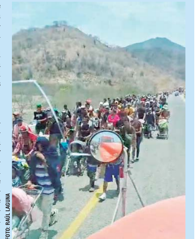
► La larga fila de personas migrantes caminando sobre la

Autoridades municipales mantienen comunicación con personal del Instituto Nacional de Migración (INM) para coordinar la seguridad de los que atravesarán en calidad de migración por la municipalidad.