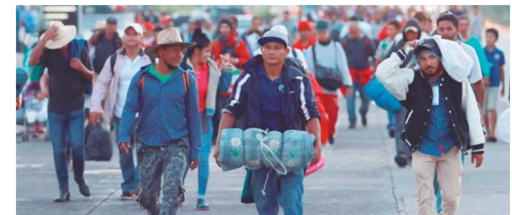
► “La caravana ‘Viacrucis del Migrante 2024’ avanza por la Costa de Oaxaca con miras de poder llegar a Estados Unidos en busca de una vida mejor.

de la Caravana que la tarde noche del sábado pernoctó en El Coyul, Huamelula y que se aproximan este lunes en Santa Cruz Huatulco.