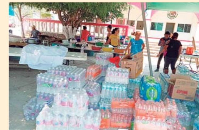
► Parte de la ayuda que la comunidad logró reunir.

personas, divididas en cuadrillas, se sumaron para combatir la conflagración.