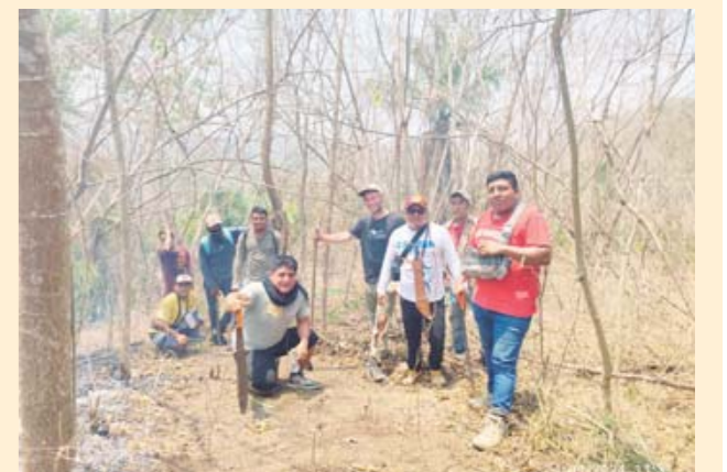
► Tras la suma de esfuerzos, el fuego fue controlado.