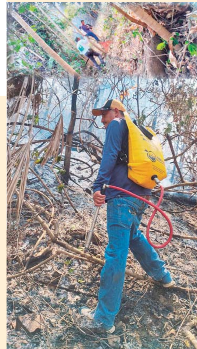
► La lumbre reinició con más fuerza el pasado martes.

mos, material para combatir el incendio y sobre todo, personal que se organizó en diversas brigadas para combatir el fuego.