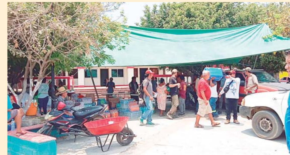
► Hombres y mujeres se sumaron desde distintos puntos para ayudar ante el desastre.

no que el fuego se estaba sofocando a un 80 ó 90 por ciento, y agradeció al pueblo de Chacalapa por la ayuda oportuna que aportó en unión para los vecinos de las comunidades que podrían salir más afectadas.