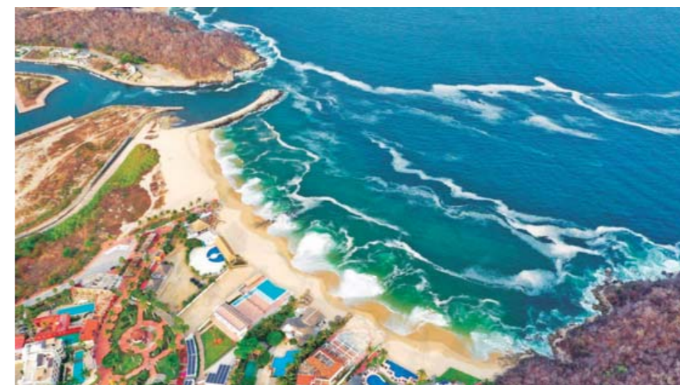
► Vista aérea del hermoso lugar costero.

mos la diversidad y la inclusión, por lo que es esencial que haya alojamientos adecuados para personas con discapacidad. Estos espacios, como el que se encuentra en La Bocana Huatulco, son faros de esperanza, emblemas de accesibilidad y testimonios de humanidad.