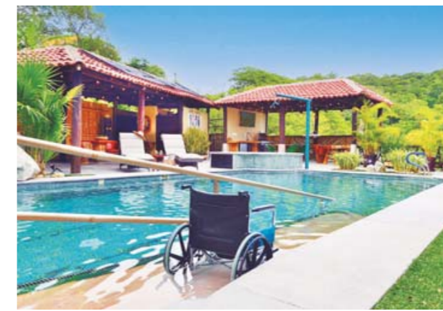
► Es extraordinario que se haya pensado en un lugar para alojar a personas con discapacidad.

Los alojamientos para personas con alguna discapacidad se deben de dar a conocer, para que los puedan disfrutar personas que requieren una motivación, para continuar con el día a día. Siendo así una afirmación que la discapacidad no define a una persona, y que cada individuo merece ser recibido en un entorno que celebra