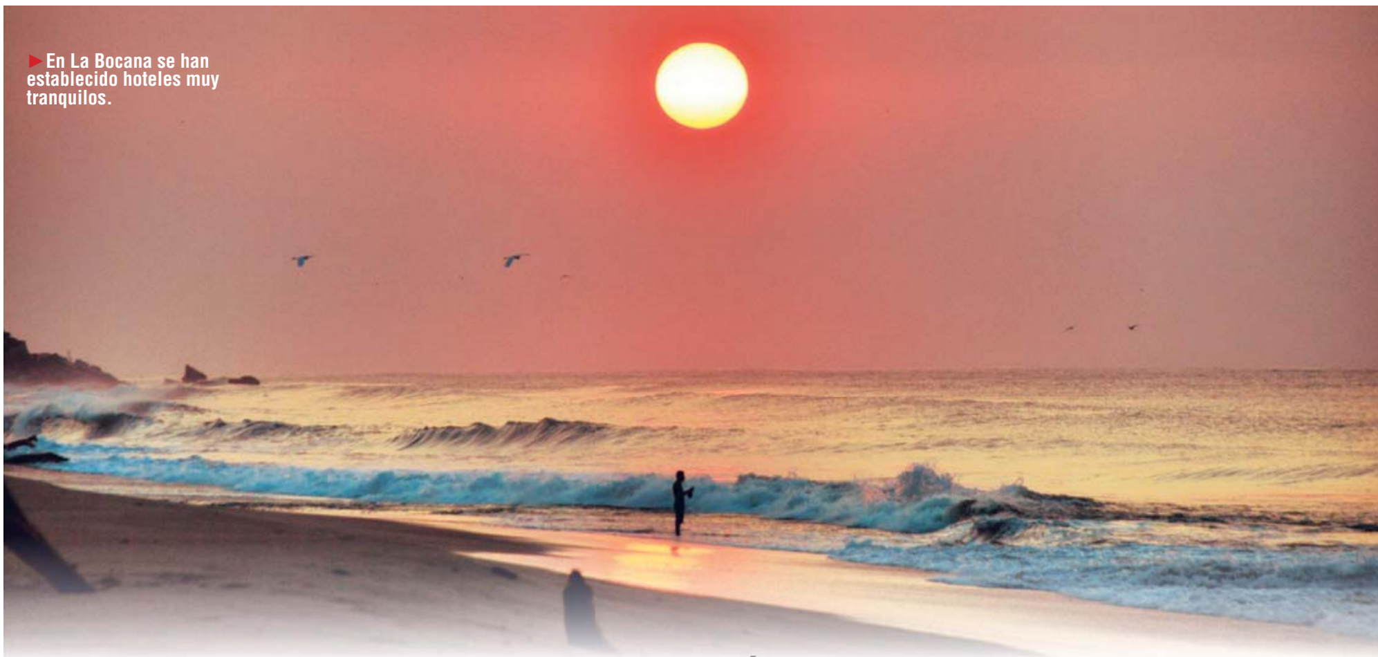
► En La Bocana se han establecido hoteles muy tranquilos.