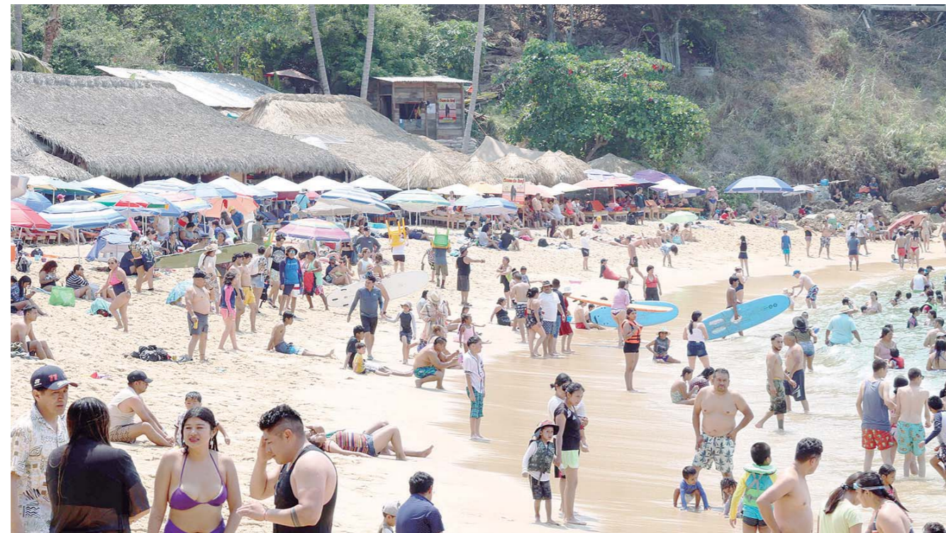
▶ Ante la gran afluencia de turismo, los servicios básicos e infraestructura de la zona turística de Puerto Escondido han sido rebasados.

“Dentro del programa para el desarrollo de la Costa que está estructurando el gobierno estatal, se incluye un apartado para los residuos sólidos urbanos en general, y uno de los componentes es la capacitación de los municipios porque nos interesa, primero que reduzcan la cantidad de residuos que están generando por sí mismo”.