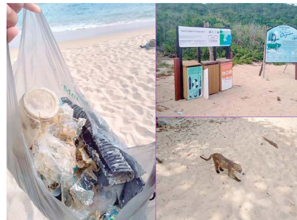
▶ Las playas, invadidas de basura.

Estos municipios son: Pinotepa Nacional, Santiago Jamiltepec, San Pedro Tututepec, San Pedro Mixtepec, Santa María Colotepec, Santa María Tonameca, San Pedro Pochutla y