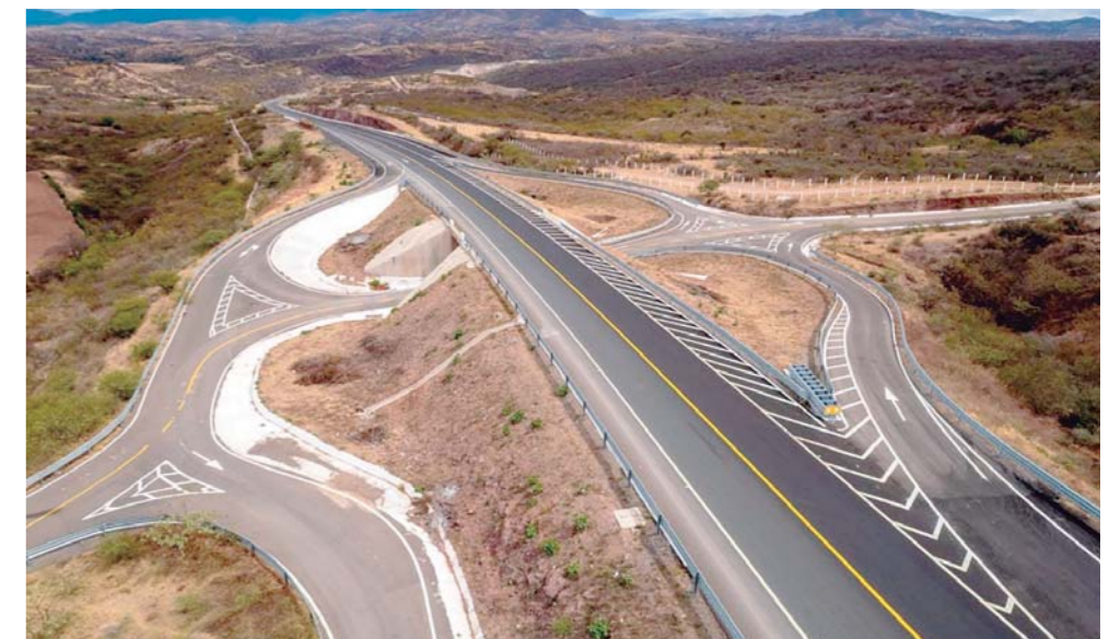
▶ Nueva autopista Oaxaca-Puerto Escondido.

Ante el incremento de paseantes, la respuesta va más allá de los trabajos temporales, por eso se analiza la rehabilitación de las plantas de saneamiento de aguas de Puerto Escondido, para evitar más contaminación en las playas.