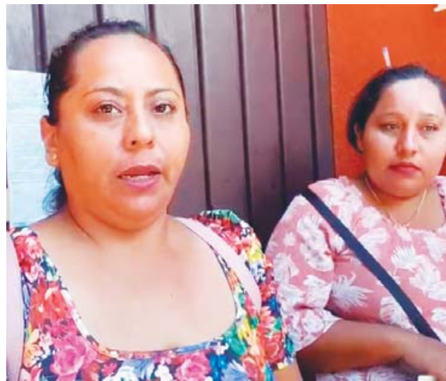
► Piden la contratación de cuatro profesores.

Por esta situación y buscando alternativas en la comunidad, los padres de familia han tenido que erogar 3 mil 500 pesos