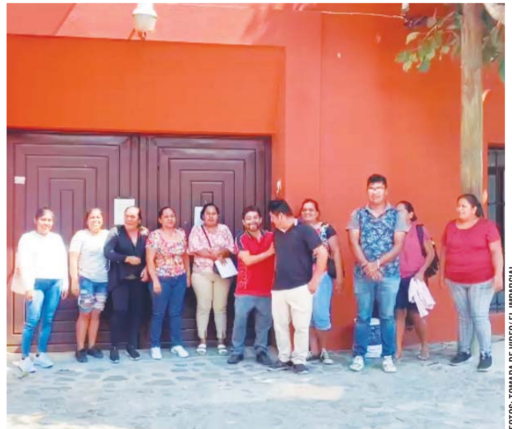
► Los inconformes arribaron a las oficinas de la Unidad de Educación Primaria del IEEPO.

Además de la contratación de profesores que urge