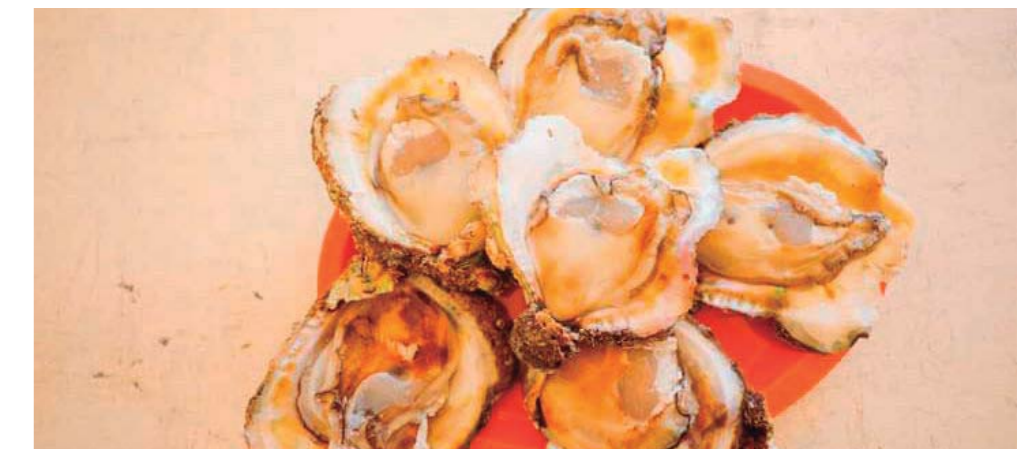
► ¿Una delicia!