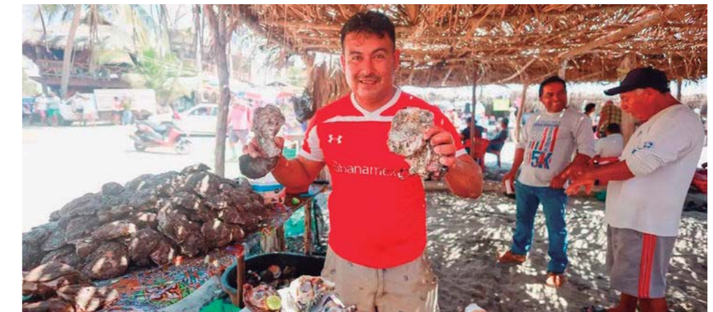
► Gran ambiente en la cuarta edición de la Feria del Ostión.