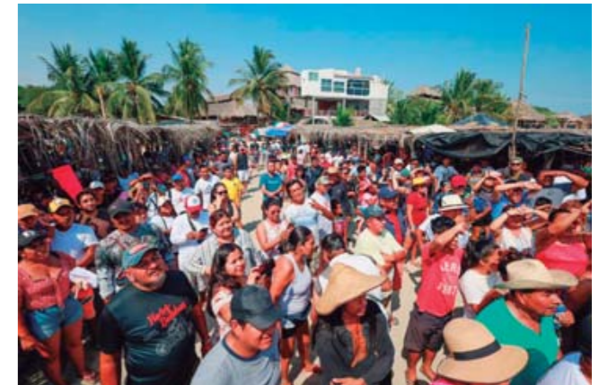
► Las diversas actividades estuvieron al tope.

la Feria del Ostión, por la tarde, los organizadores, dependencias municipales, el comité organizador, autoridades auxiliares de Bajos de Coyula y prestadores de servicios, compartieron con los casi 4 mil asistentes al evento, un baile popular, en celebración del éxito de la Cuarta edición de la Feria del Ostión en Boca Vieja, Huatulco.