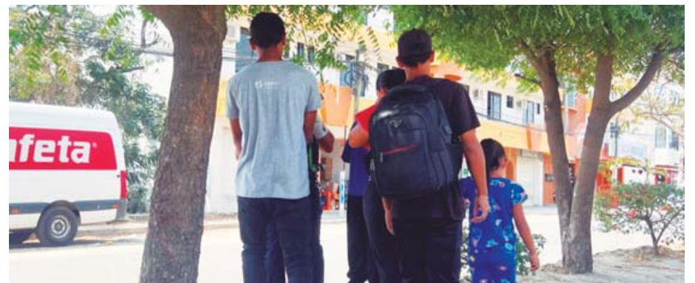
► Van en busca de mejores condiciones de vida.