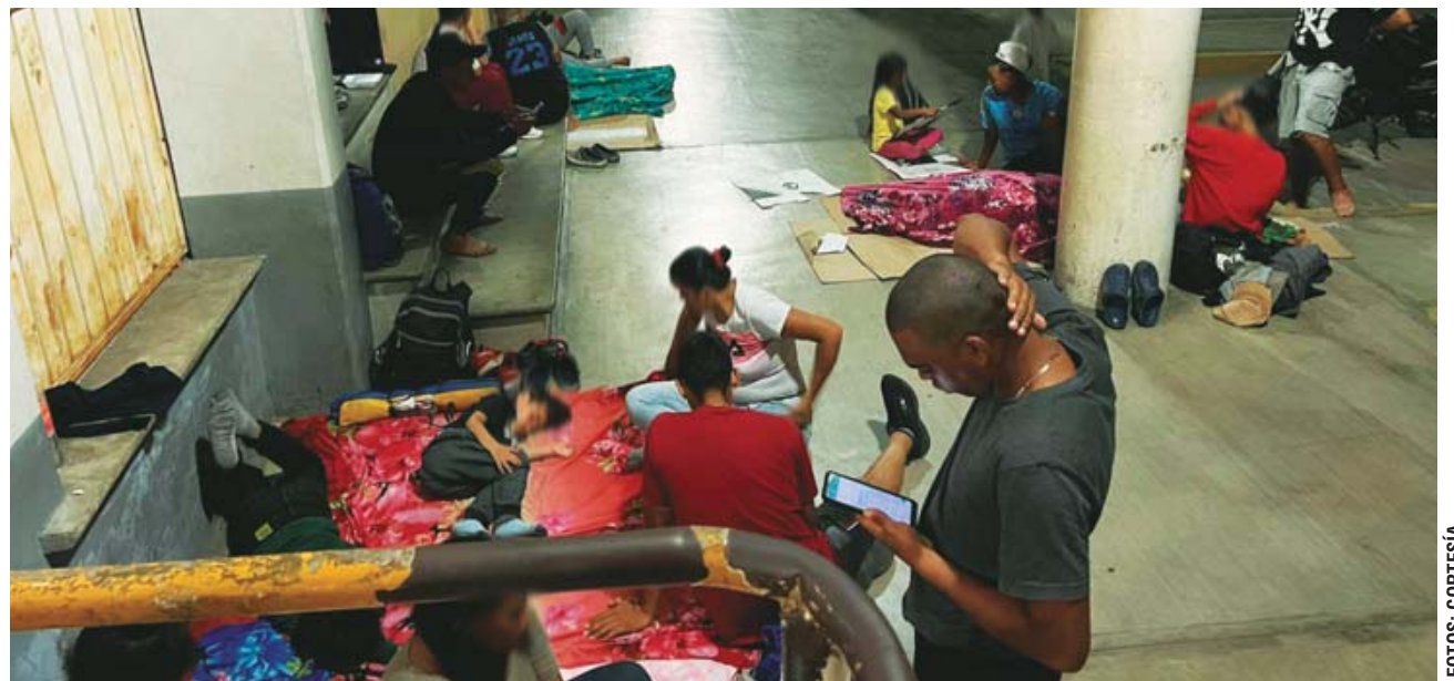
► La ola migrante incluye hombres, mujeres, jóvenes y niños.