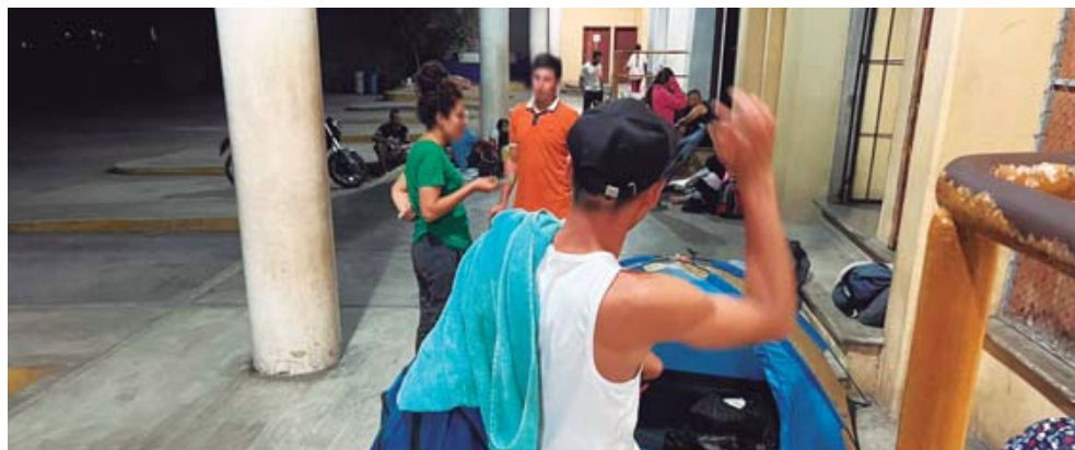
► Se esconden de los oficiales de migración.