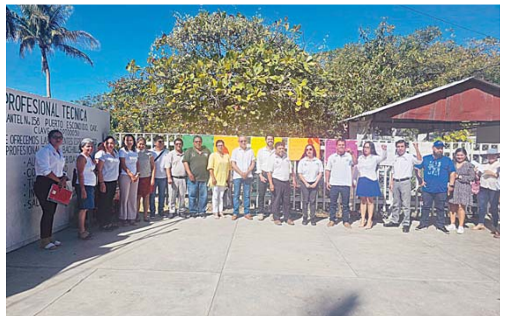
► Los manifestantes aseguraron que la situación es grave.

La situación no es exclusiva de Puerto Escondido, ya que se reportan problemas similares en otros seis planteles del esta-