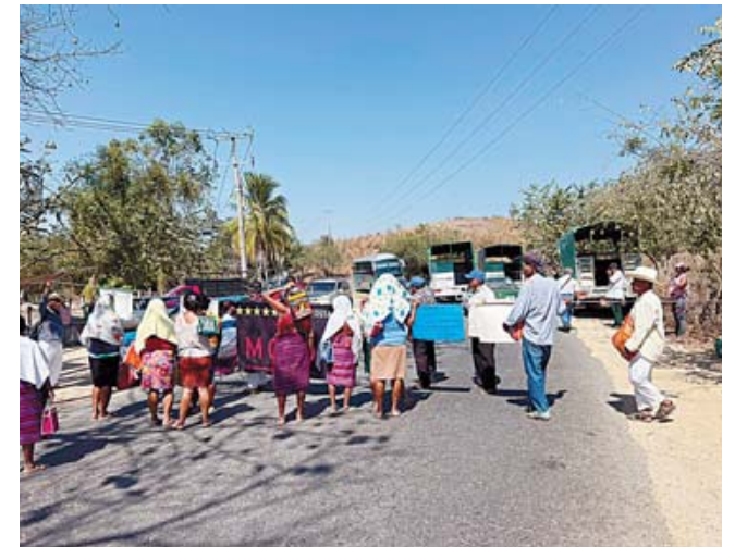
► Colocaron un tendedero de pancartas.

Una segunda manifestación fue realizada por integrantes de la organi-