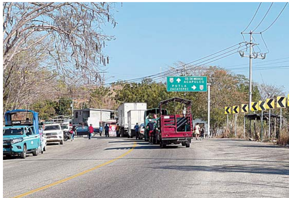
► El primer bloqueo se registró a la altura de El Retén.

gen la atención del gobernador Salomón Jara Cruz, para los municipios de Santiago Ixtayutla, San Agustín Chayuco y San Juan Colorado, donde aún existen comunidades olvidadas y rezagadas.