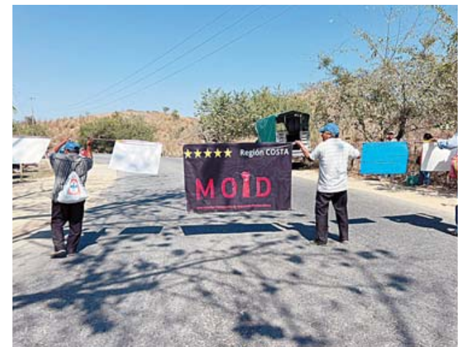
► El segundo bloqueo se instaló en el módulo de vigilancia Guerrero.

zación Movimiento Oaxaqueño de Izquierda Democrática (MOID) quienes realizaron un bloqueo a la Carretera Federal 200, tramo Pinotepa-Acapulco, a la altura del módulo de vigilancia Guerrero, de este municipio costeño.