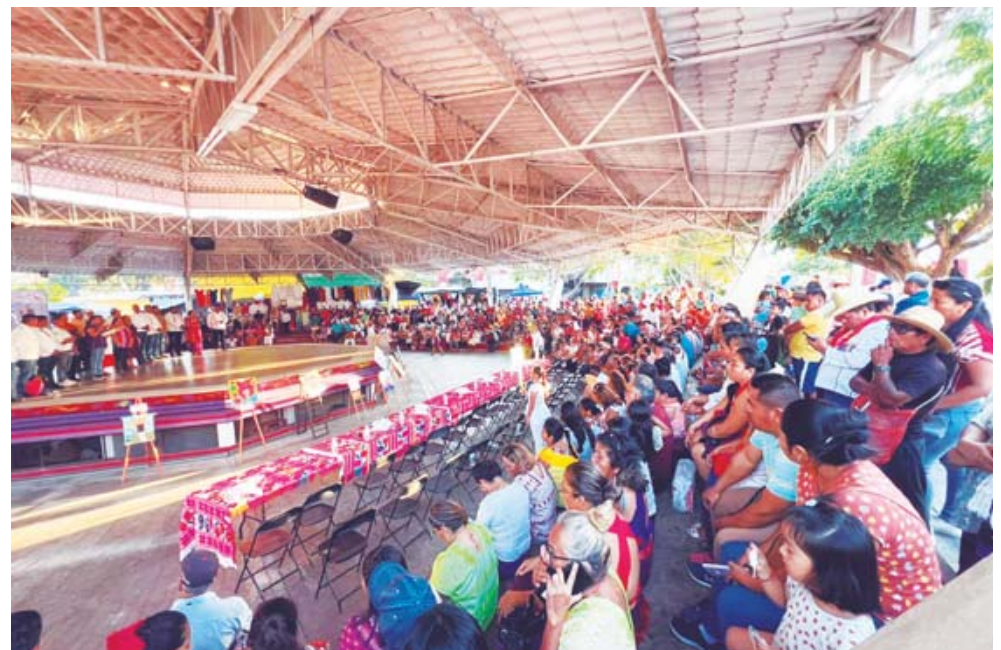
► La sección 22 de la CNTE mantiene viva la exigencia de justicia.

La familia del compañero dio a conocer que Modes-