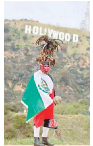
► ¡Orgullo costeño!

En esta ocasión, mostraron los trajes de las danzas de Las Mascaritas y Los Tejorones, las cuales se estarán bailando en el carnaval que se llevará a cabo el próximo 9 de marzo en Santa Ana,