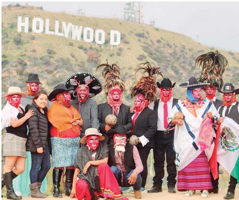
► Los danzantes participarán en un carnaval.

"Ataviados con coloridas máscaras y penachos elaborados con las plumas más finas de gallos, los danzantes oaxaqueños del grupo Chikua'a recorrimos uno de los lugares turísticos más importan-