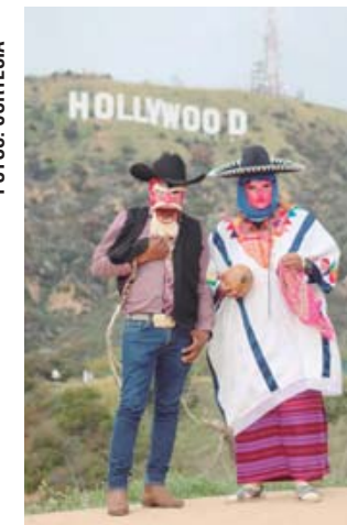
► Llamaron la atención del turismo internacional.

La mayoría de los integrantes de este grupo de danza son originarios del municipio de San Pedro Jicayán y uno de San Andrés Huaxpaltepec, mismos que hablan la lengua mixteca; algunos viven en Estados Unidos desde hace más de 20 años, mientras que otros llevan uno o dos años, informaron.