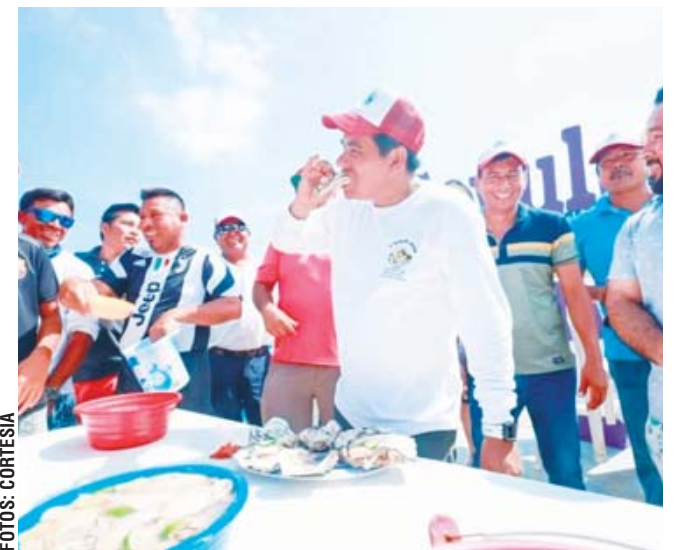
► La Feria del Ostión celebrará su cuarta edición.

durante la degustación de ostiones frescos, se realizará un concurso para encontrar el Ostión más grande de la feria.