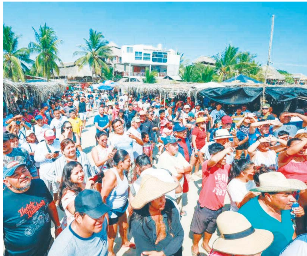
► Se espera el arribo del turismo local, nacional e internacional.

La cuarta edición de la Feria del Ostión comenzará con una limpieza en la playa el día viernes 23