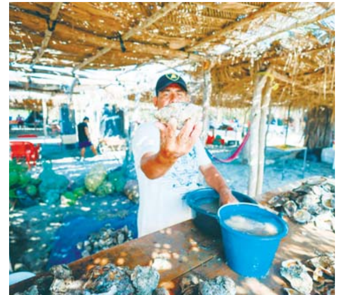
► Personas locales invitan a disfrutar de los tres días de feria.