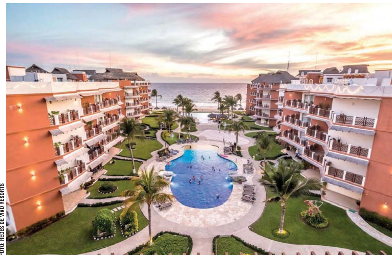
▶ Torres del complejo Vivo Resorts, propiedad de canadienses.