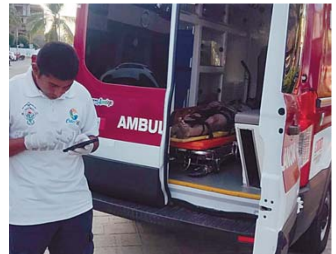
► Una ambulancia trasladó a la víctima a un hospital.