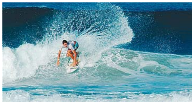
► La playa Zicatela es famosa por sus olas para practicar Surfing.

de estar preparado ante situaciones de emergencia en espacios acuáticos y la pronta respuesta de los servicios de emergencia locales. Además, se recomienda a turistas y personas que se dedican a realizar este deporte extremo tomar sus precauciones.