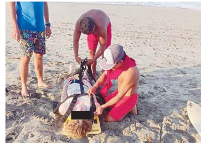
► Los hechos se registraron en la famosa playa Zicatela, en la Costa oaxaqueña.

de estar preparado ante situaciones de emergencia en espacios acuáticos y la pronta respuesta de los servicios de emergencia locales. Además, se recomienda a turistas y personas que se dedican a realizar este deporte extremo tomar sus precauciones.