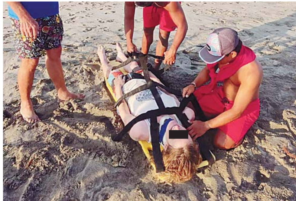
► Se le brindaron los primeros auxilios al extranjero.

El incidente pone de relieve la importancia