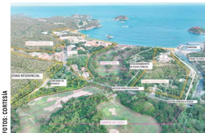
► El campo del golf con el mar al frente