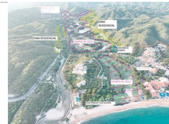
► El proyecto de Área Natural Protegida en medio de desarrollos turísticos y zona habitacional, la queja.