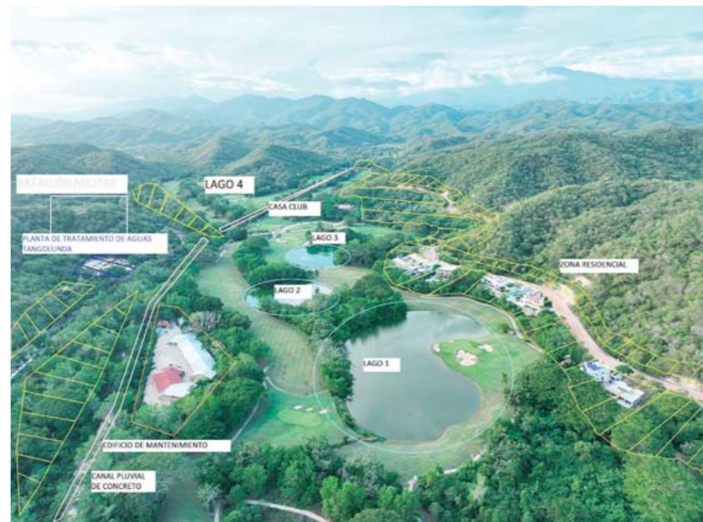
► De acuerdo con los lugareños, la zona cuenta con 4 lagos artificiales abastecidos por la planta de tratamiento; al desaparecer ello llevaría el agua al mar, afectando el equilibrio ecológico.

B ahías de Huatulco, Oax. - Prestadores de servicios como la Asociación de Hoteles y Moteles de Huatulco, la representación de la Asociación Mexicana de Agencias de Viajes, Canaco, Aprodit, red ciudadana Huatulco y población en general han mostrado su inconformidad al cierre del campo de golf Tangolunda o Las Parotas, pues arguyen, “sería un golpe incalculable al desarrollo económico y social de la costa oaxaqueña que implicaría cierre de esta-