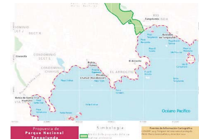
► En el mapa, proyecto del Área Natural Protegida, sería la zona sombreada.

po de Golf tiene colindancia con zonas habitacionales y hoteleras siendo la más cercana, la zona residencial del Campo de Golf. Está inmerso en la zona hotelera Tangolunda, de carácter residencial y comercial.