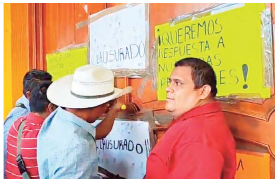
► Los manifestantes colocaron pancartas en las instalaciones municipales.