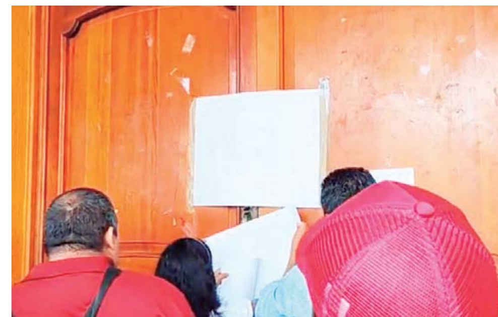
► Acusan ingobernabilidad.