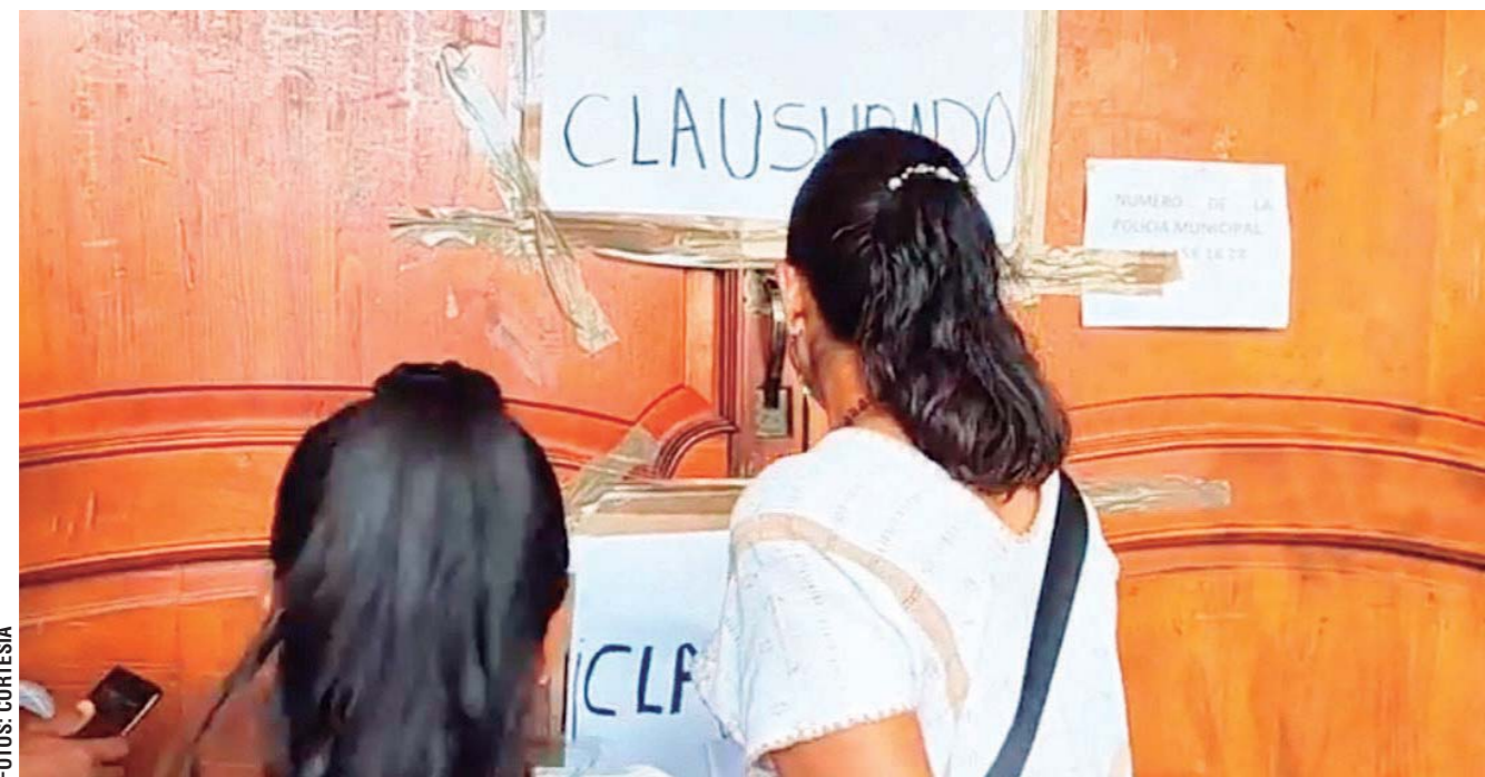
► Reclaman carencias de obras y pésimas condiciones de la infraestructura municipal.

En una asamblea realizada en la explanada, parque y plaza central de la población y a la que acudieron cientos de habitantes de la comunidad,