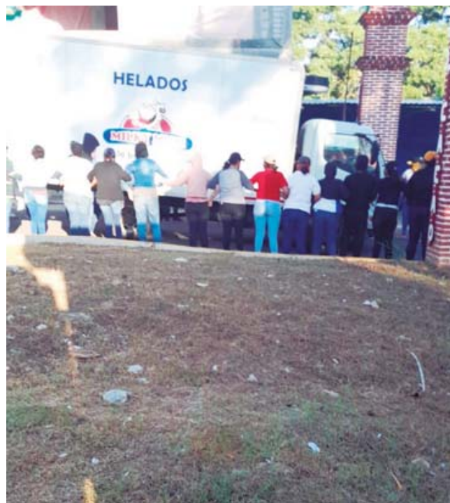
► Diversos automovilistas fueron testigos de los hechos.

van destinados a comercios de la zona de San Juan Cacahuatepec, San Pedro Amuzgos, Santa María Zacatepec entre otros, mismos que no llegan a su destino.