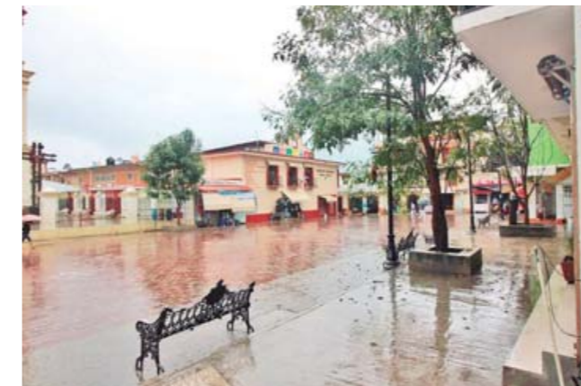
► Los tranquilos aspectos del pueblo de Juquila.