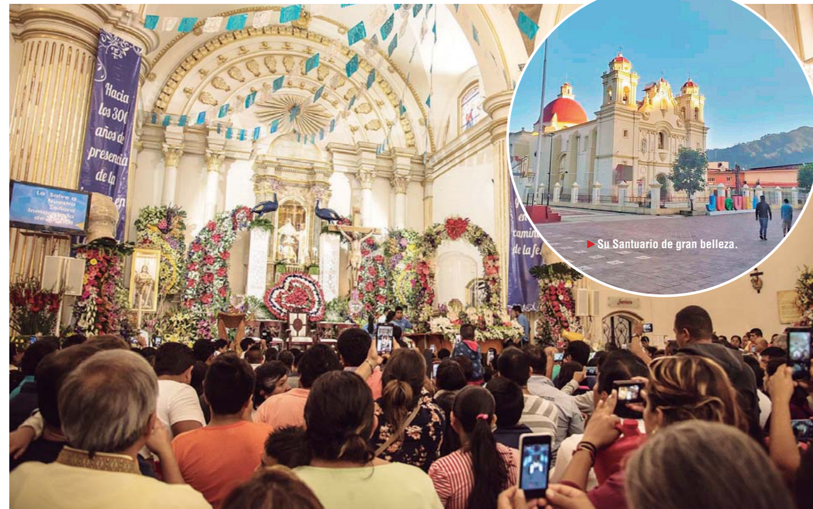
► Gran cantidad de feligreses acuden al Santuario de Juquila.

Respecto de la historia de la venerada virgen, a manera de resumen, se remonta al siglo XVI, en el año 1552, cuando un fraile dominico de nombre Jor-