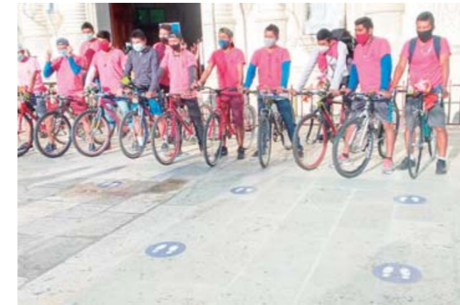
► Miles de jóvenes llegan en bicicleta a Santa Catarina Juquila.

creyó que era la voluntad de la virgen tener el mismo color de piel que sus especiales devotos.