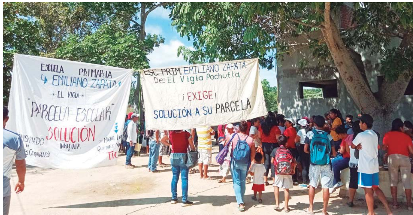
► Bienes Comunales de San Pedro Pochutla asegura que es intermediario para resolver la problemática.

Después de dos días de bloqueo en la carretera federal número 200, por parte de pobladores de la comunidad El Vigía, San Pedro Pochutla, llegaron a una tregua para verificar la información de los firmantes de documentos