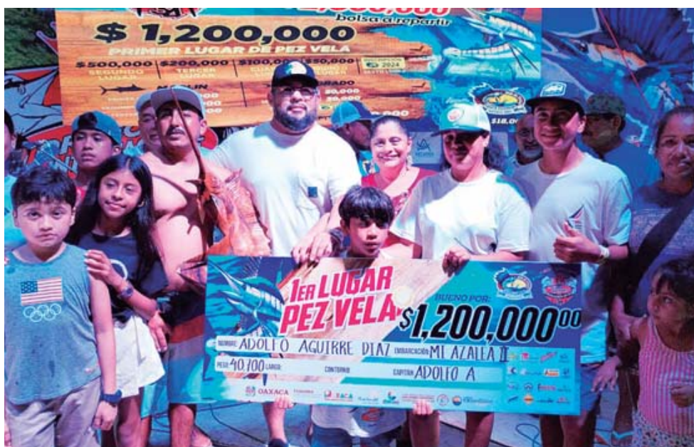
► Primer lugar del torneo de pesca 2023.