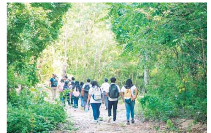
► Interpretación de senderos.

Con estudiantes de diversos niveles académicos se llevaron a cabo interpretaciones de senderos en El Órgano, Candelabro y Las Ninfas, en las que participaron guías de