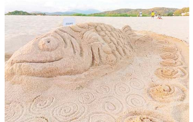
► Construcción de esculturas de arena.

El regresar conchitas al mar fue parte de las distintas actividades realizadas