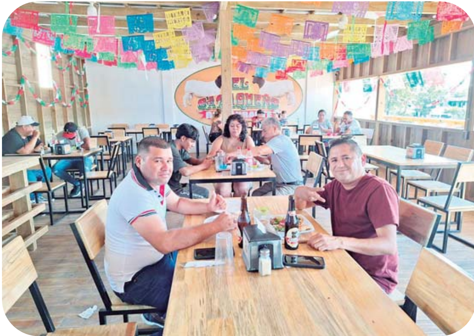
► Los clientes disfrutan de la variedad de platillos.