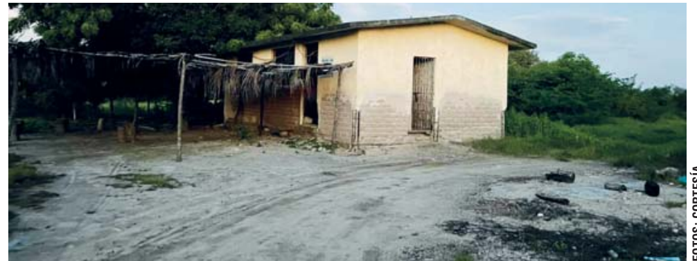
► Es un pueblo fantasma.