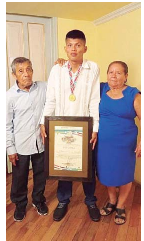
► La familia del joven estuvo presente.